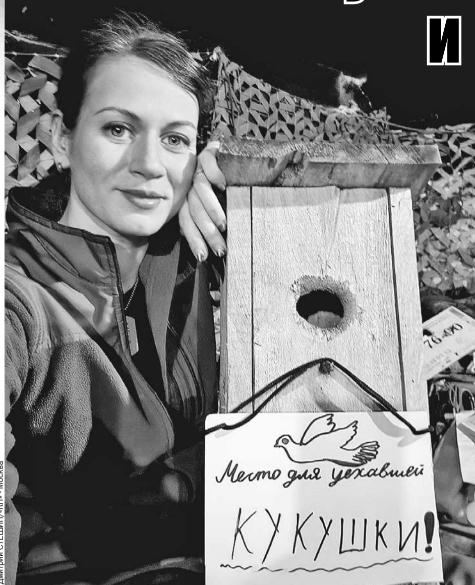
«Валькирия» даже среди серых развалин и гари не теряет чувства прекрасного. Да она и сама прекрасна.

Наутро «Валькирия» уезжала на передок в Часов Яр на несколько недель. Не «по серенькому» - в сумерках, а в тот короткий и благословенный час, когда ночь превращается в раннее утро, когда ночные дроны уже не работают, а дневные еще не подняли в воздух. Я в некотором ошеломлении залез в рюкзак и поставил на стол, с таким