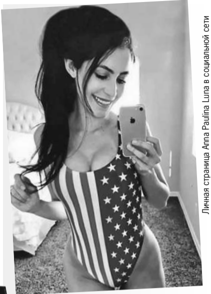
Личная страница Anna Paulina Luna в социальной сети