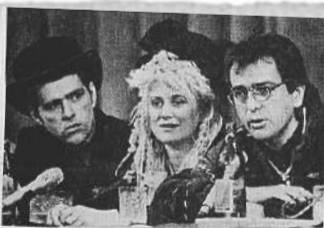
Мелодии зеленого мира

Еще в сентябре 1988 года было подписано соглашение с фирмой «Мелодия»,