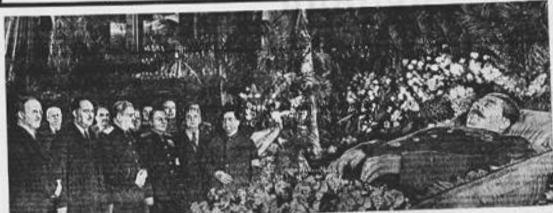
ПОСТАНОВЛЕНИЕ ЧАСЫ ПРОЩАНИЯ