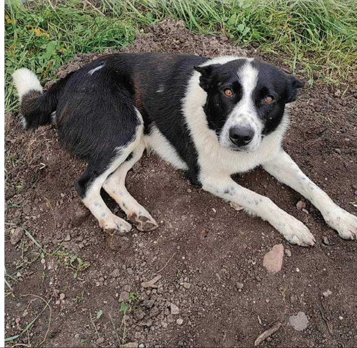
Роли у преданных друзей были распределены. Бежевый не отходил от погибшего хозяина, а черно-белый убежал на дальние расстояния - видимо, так привлекал внимание людей.