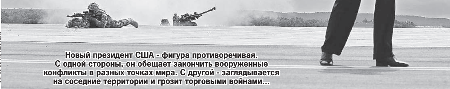
Новый президент США - фигура противоречивая. С одной стороны, он обещает закончить вооруженные конфликты в разных точках мира. С другой - заглядывается на соседние территории и грозит торговыми войнами...

Выходит, ситуация с нефтью может стать дополнительным толчком к ослаблению рубля. Бюджет получит дополнительные доходы - это хорошо. Но цены из-за подорожания доллара могут подняться - это плохо. Впрочем, от импортных товаров мы зависим все меньше, так что вряд ли стоит ждать серьезного роста цен, даже если доллар будет по 120 рублей.