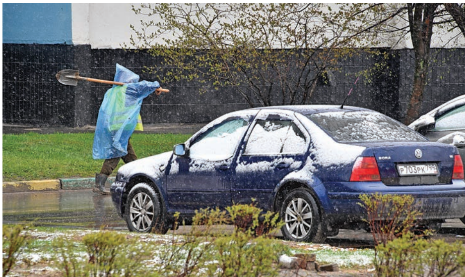
Погода в наших краях вполне позволяет приводить в порядок тротуары, улицы и газоны даже зимой.

По его словам, позитивная динамика есть - чиновники чаще выходят на связь с жителями, но качество не