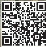
Фото присылайте в «Комсомольскую правду», e-mail: miss@kp.ru

Голосуйте за понравившуюся вам участницу на нашем сайте KP.RU в разделе «Будь стильной с «КП»!