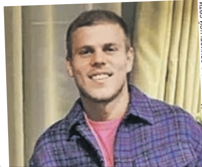
Личная страница Александра Кокорина в социальной сети

Неожиданно втянутый в скандал Кокорин ситуацию пока никак не комментировал.