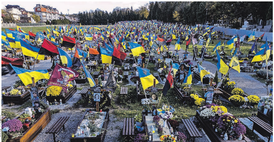
Русофобская политика киевских неонацистов обернулась смертями тысяч простых украинцев. Кладбище, подобных этому во Львове, в стране появилось множество.

Особенно беспокоит, что насильственное принуждение к неонацистской идеологии и ярая русофобия уничтожают некогда процветающие города Украины, в том числе Харьков, Одессу, Николаев, Днепропетровск.