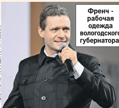
Френч - рабочая одежда вологодского губернатора.

деля к неделе, квартал к кварталу и так далее. Было - стало. Я объехал все муниципалитеты области, отвечаю на все вопросы.