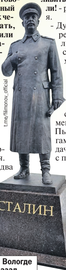
Памятник Сталину в Вологде открыли месяц назад.