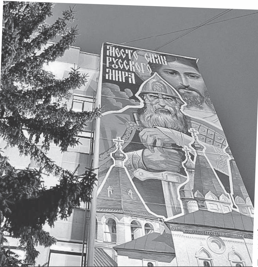
Такой плакат с былинным богатырем и надписью про то, что здесь «место силы Русского мира», висит на здании рядом с администрацией.

А вот в Вологде интересно. Тут обратный эксперимент.