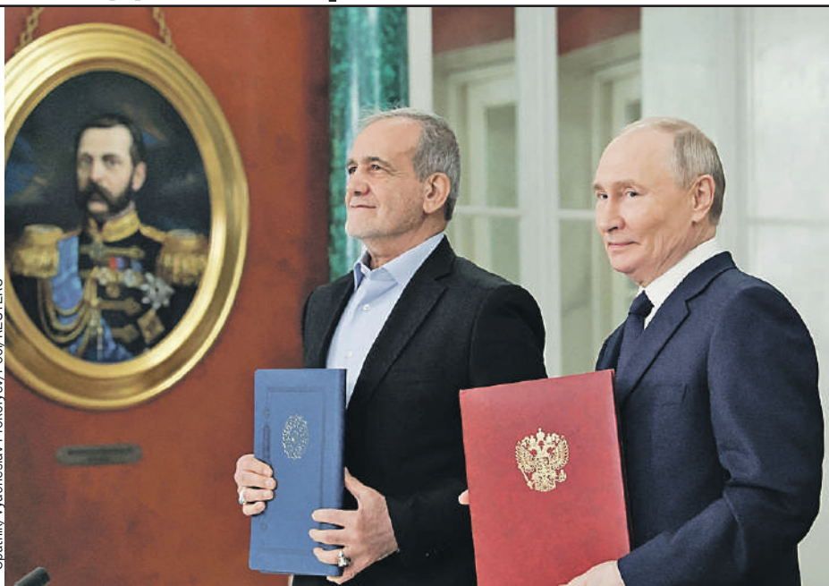
Два президента и один император: Владимир Путин и его иранский коллега Масуд Пезешкиан под пристальным взглядом Александра II.

- Реализация этого проекта помогла бы наладить бесшовную логистику от России и Белоруссии до иранских портов в Персидском заливе, - сказал российский президент.