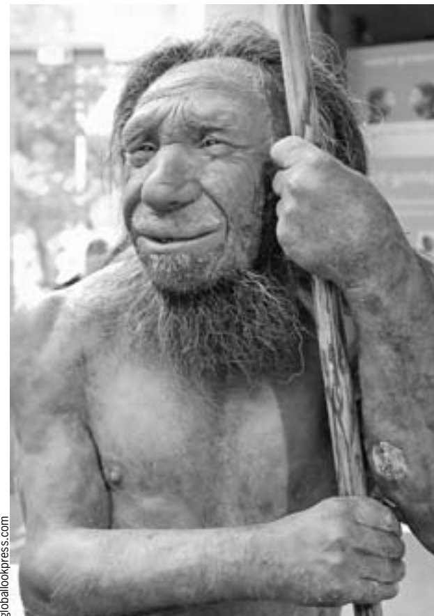
Вот такие допотопные ловеласы склоняли человеческих женщин к тесному общению.

Вряд ли кроманьонцы сильно зарились на неандертальских женщин, скорее их мужчины были охочи до другого привлекательного вида. И в этом увлечении они в прямом смысле слова не знали границ. Народов, которые каким-то чудом избежали сексуального домогательства неандертальцев, раз-два и обчелся. Генетиче-