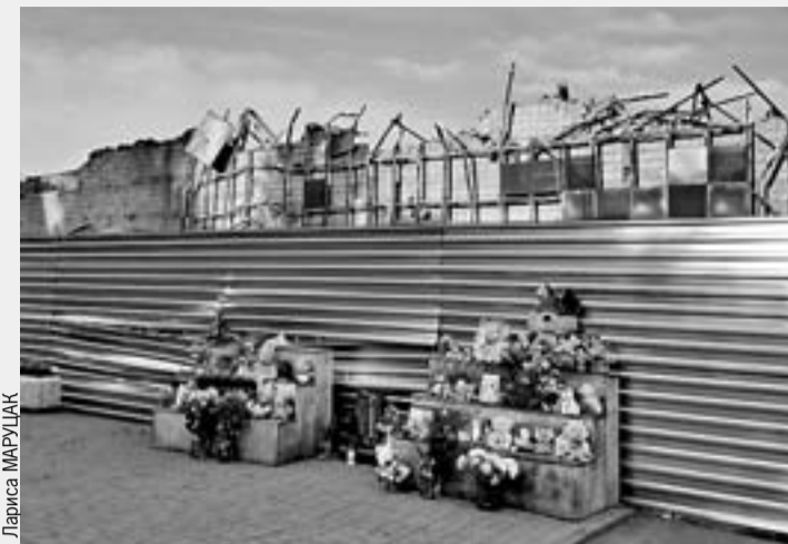
К опустевшему месту трагедии люди по-прежнему несут цветы и игрушки...