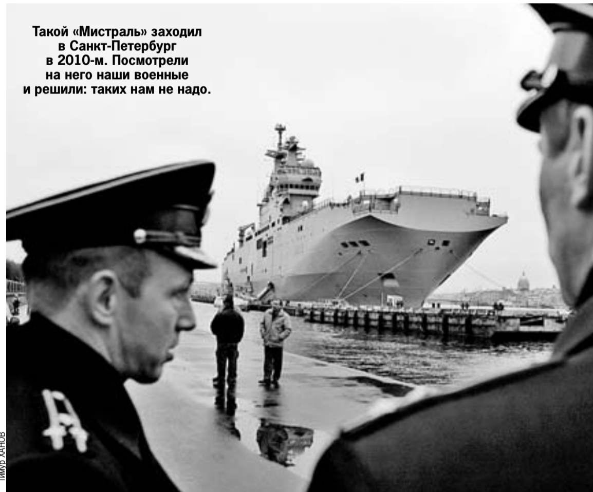
Такой «Мистраль» заходил в Санкт-Петербург в 2010-м. Посмотрели на него наши военные и решили: таких нам не надо.

Иными словами, это и будет вертолетоносец не в чистом виде, потому что вместе с вертушками он будет нести на борту и палубные самолеты.