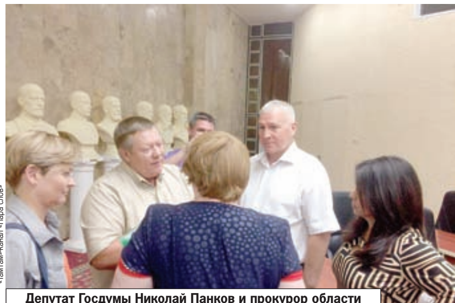
«ТамТам»-канал «Пара слов»

- Она напомнила и о другом поручении Вячеслава Володина: рассмотреть возможность ужесточения ответственности за нарушение закона, - написал парламентарий.