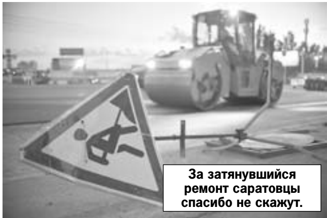
За затянувшийся ремонт саратовцы спасибо не скажут.