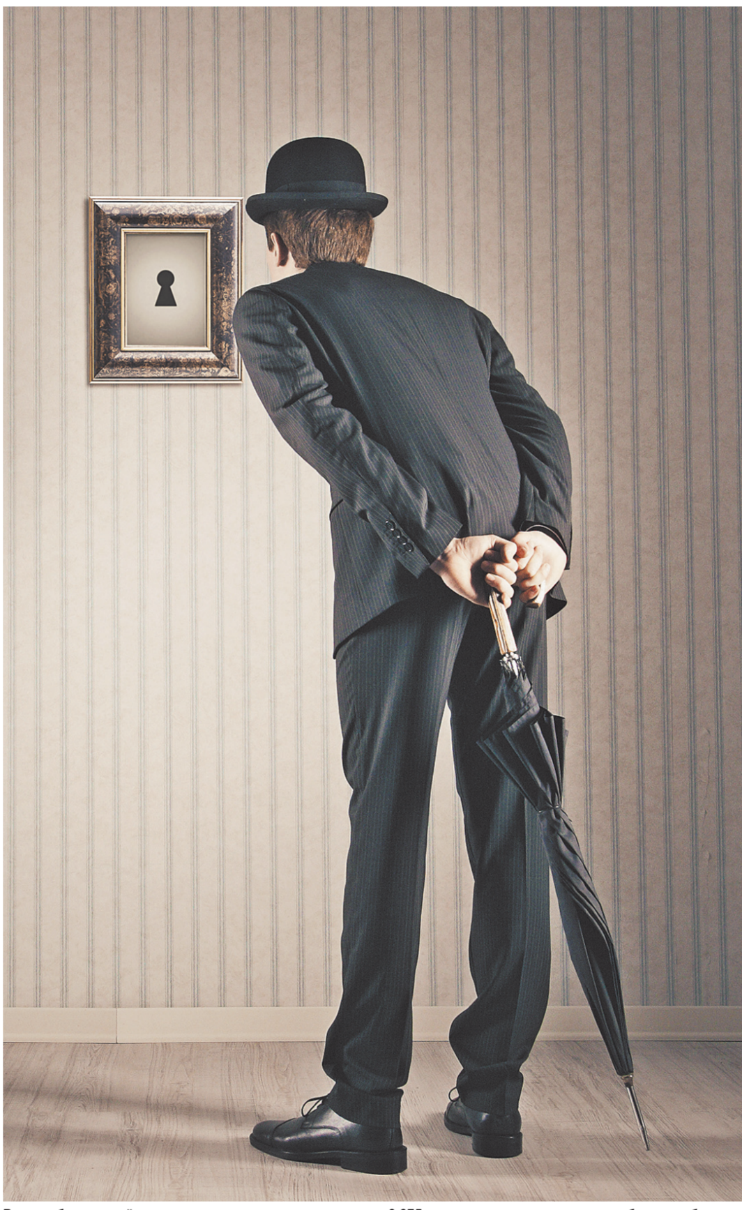
Вход на банковский рынок уже закрыт или ограничен для 6 675 менеджеров и владельцев проблемных банков.

Следующий шаг — распространение требований к репутации на клерков, выполняющих противоправные приказы начальства, а также введение понятия «теневое директорство» — лица, оказывающего влияние на решения, но формально не занимающего высокую должность.