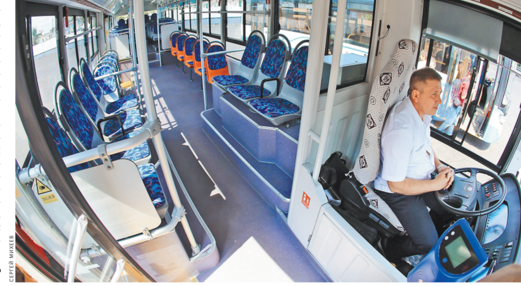
«Китайца» в Москве пока испытывают без пассажиров.