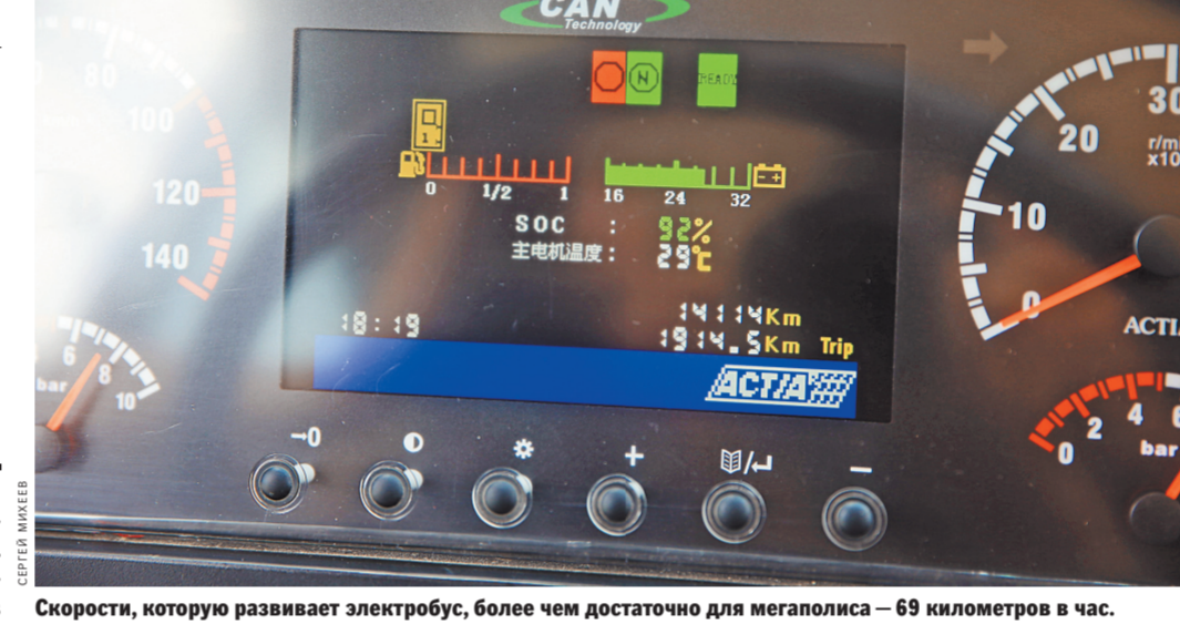
Скорости, которую развивает электробус, более чем достаточно для мегаполиса — 69 километров в час.