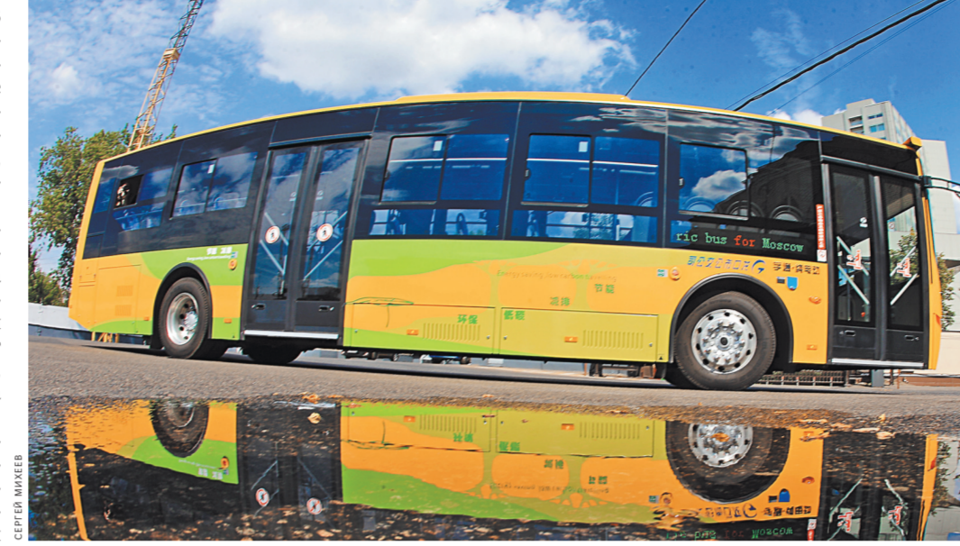
Желто-зеленого иностранца на улицах столицы видно издали — московские автобусы синие.

И последнее: во сколько обойдется ся столице переход на электробусы? Цена производителя пока не называется. Глава «Мосготранса» Евгений Михайлов недавно сказал, что следует ориентироваться примерно на 22–23 миллиона рублей — примерно в два раза дороже автобуса. Но электробус должен быть дешевле в эксплуатации.