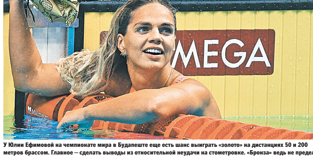
У Юлии Ефимовой на чемпионате мира в Будапеште еще есть шанс выиграть «золото» на дистанциях 50 и 200 метров брассом. Главное — сделать выводы из относительной неудачи на стометровке. «Бронза» ведь не предел.