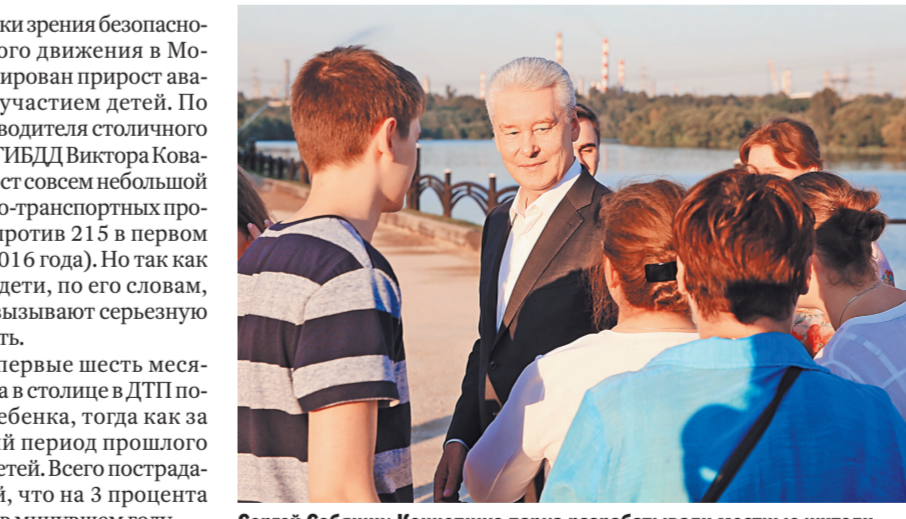
Сергей Собянин: Концепцию парка разрабатывали местные жители.