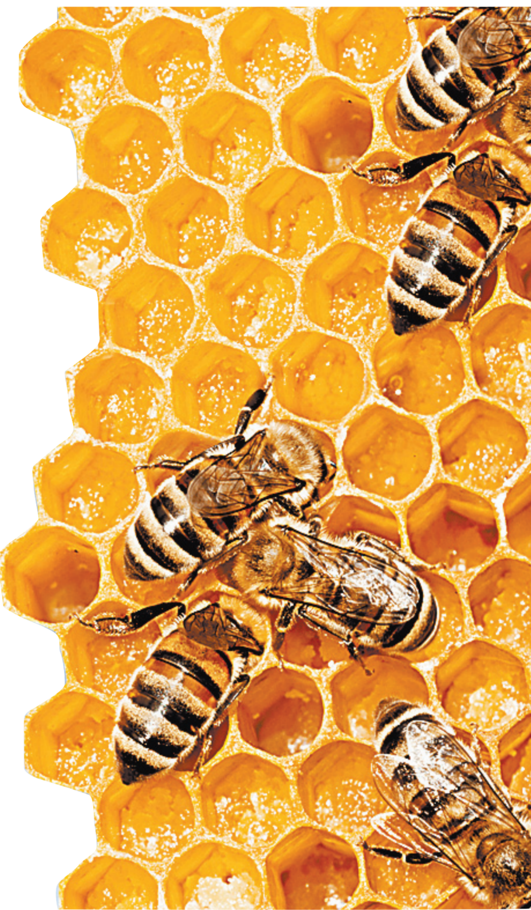
В этом году российским пчелам пришлось пережить несладкую и холодную весну.

ходимости разместить приезжих футбольных фанатов у себя на квартирах, выступили городские власти. Работа по формированию банка жилья была поручена районным чиновникам вместе с жилищным управлением Саранска. Они взаимодействуют с управляющими компаниями, а те — с домкомами, которые знают, какие квартиры в домах пустуют или сдаются. А для того,