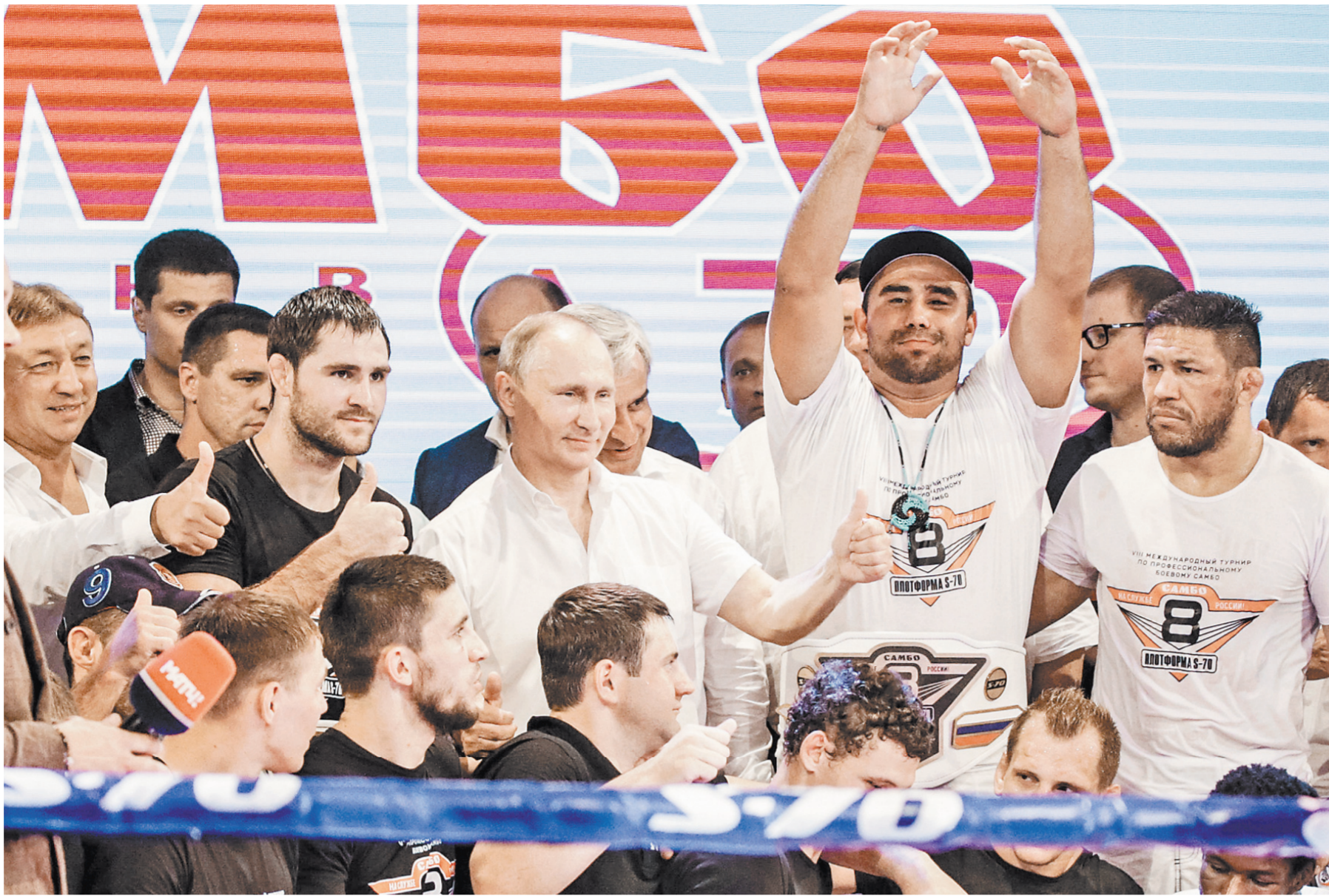
Владимир Путин посетил Международный турнир по боевому самбо и принял участие в церемонии награждения победителей. В рамках турнира состоялось десять поединков между лучшими представителями отечественного и зарубежного профессионального боевого самбо. «Мы сегодня увидели здесь крутых парней», — сказал президент. — Они показали нам все, чем ценятся боевые искусства: разнообразную технику, замечательную борьбу в партере, блестящие броски. Но самое главное — мужество и характер. Фото и видео смотрите на сайте rg.ru/art/1436717

Столичный опыт надо распространить на регионы, уверена Элла Памфилова, поскольку равный доступ к местам проведения встреч избирателями поможет создать конкурентную среду и отменить аргументы о «сушке явки» как одним из инструментов административного ресурса. После выборов ЦИК намерен вернуться и к вопросу муниципального фильтра. «Мы будем в сентябре собирать экспертов по поводу того, какие требуются изменения», — сказала Памфилова. По ее мнению, надо подробно проанализировать этот механизм.