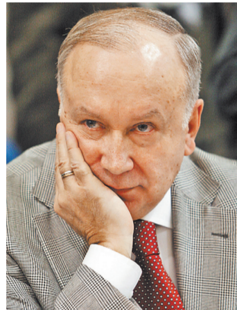
Он держался в стороне от тусовок и суеты. Может, потому и успел сделать многое...

Все точно! Но за четыре года до этого вышел и не менее значительный альбом — «Как прекрасен этот мир». Того же Давида