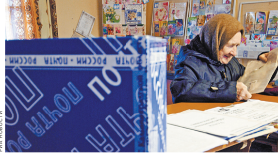
Услугами почты пользуются граждане разных слоев населения. Комфортные условия нужно создать для всех.

Кроме того, все запланированные к открытию отделения почтовой связи нового формата будут отвечать самым современным требованиям доступной среды, рассчитанной на обслуживание людей с ограниченными возможностями.