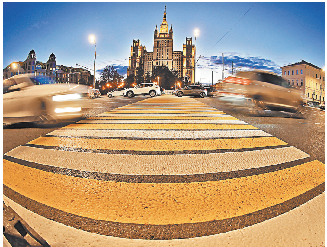
Власти обещают: после завершения всех дорожных работ скорость на Садовом кольце вырастет на 5–10%.

С другой стороны, Россия успешно борется с инфляцией, напоминает эксперт. Если удастся поддерживать ее в районе заявленной цели в 4 процента достаточно долго, а также стабилизировать инфляционные ожидания на долгосрочный период, это сильно подстегнет доверие к российскому рублю.