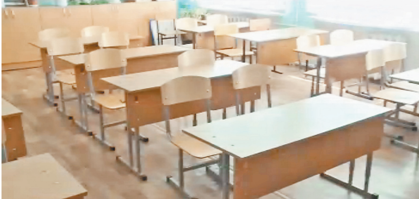
После скандала выяснилось: деньги на парты собирали не только в 12-й школе, но и в других учебных заведениях республики.