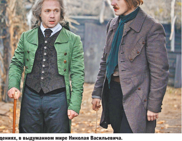
Часть действия разворачивается в видениях, в выдуманном мире Николая Васильевича.

Думается, это только часть правды. Другая ее часть состоит в том, что у нашей культуры исторически сложные отношения с телесностью. Они родом из Средневековья — у нас ведь не было ни Возрождения, ни Реформации, которые тело реабилитировали. У нас же чуть ли не до конца XX века изображение плотской любви в литературе имело лишь два регистра — это либо территория стыдливого умолчания и тонких намеков, либо грубость и подчеркнутая физиологичность. Но в последнем случае речь идет о произведениях заведомо маргинальных. И эти сложившиеся особенности автоматически перекочевали в новый вид искусства — кино.