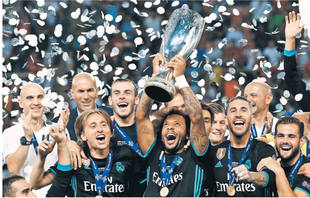
«Реал» выиграл уже шестой трофей за полтора года работы главным тренером Зинедина Зидана.

— Я доволен многими аспектами нашей игры, — отметил португалец на послематчевой пресс-конференции. — Мы бились до последнего. Во втором тайме мы нашли способ, как создать им про-