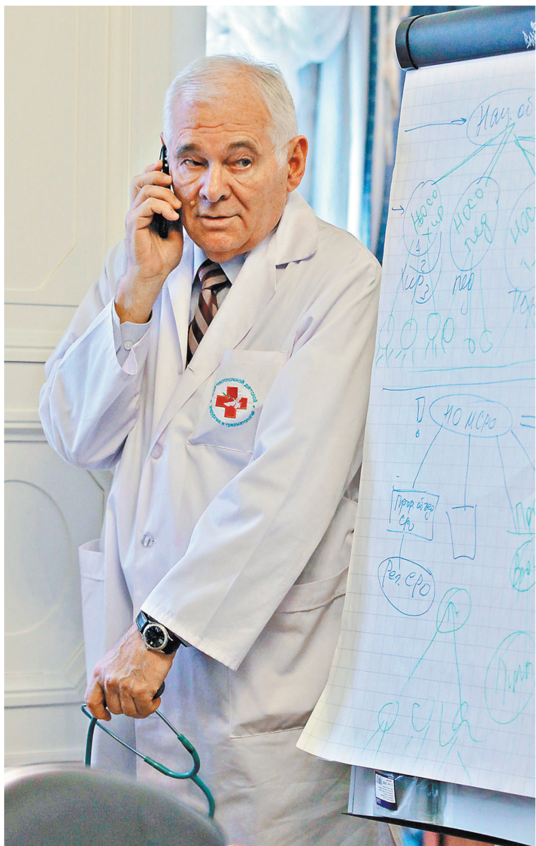
Леонид Рошаль: Нужна четкая и профинансированная государственная программа по решению кадровой проблемы в здравоохранении.

Мы понимаем, что это скрытая форма распределения. Национальная медицинская палата (НМП) активно поддержала идею министра о проведении аккредитации врачей и конкретно помогла в ее реализации, а также активно участвовала в разработке профессиональных стандартов «педиатр участковый» и «терапевт участковый», что является основой для аккредитации. Руководителями всех региональных аккредитационных комиссий были представители НМП.