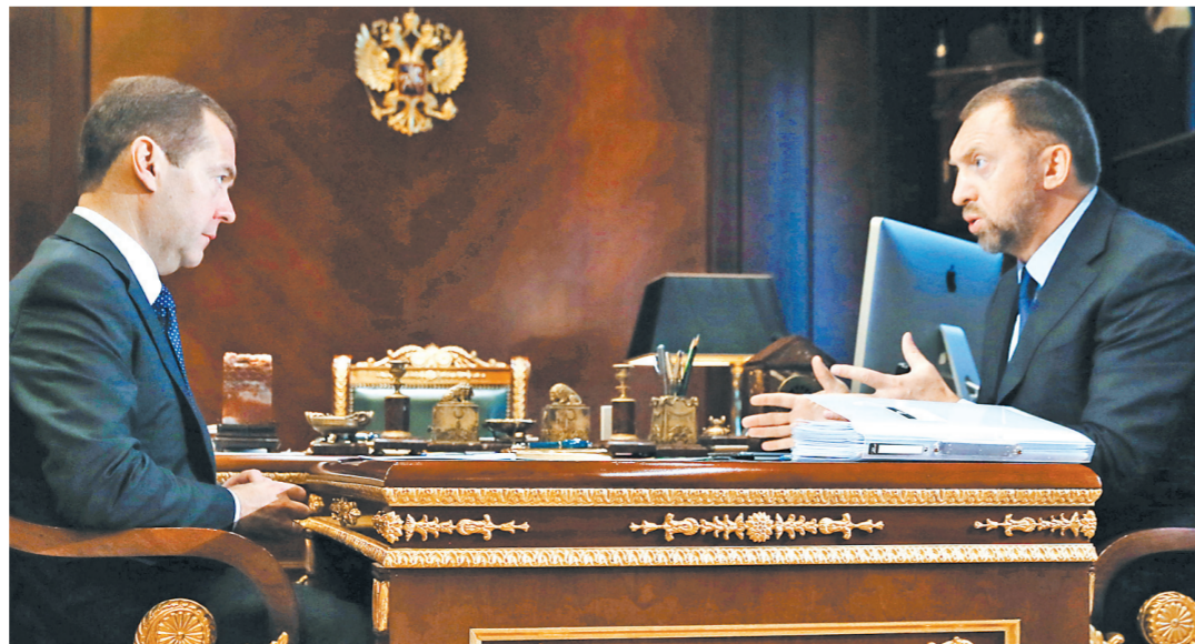
Глава правительства в беседе с Олегом Дерипаской выяснял экспортные возможности группы «ГАЗ».

Перспективным направлением в автомобилестроении считается электрический и беспилотный транспорт. Правительство на эту тему недавно проводило отдельное совещание. Олег Дерипаска уверен, что использование таких машин не за горами — на горизонте ближайшие 10 лет. «Есть участки, которые уже сейчас готовы», — предложил он. — Допустим, аэропортовый транспорт, логистические участки цепочек уже сейчас могут быть оснащены автопилотом».