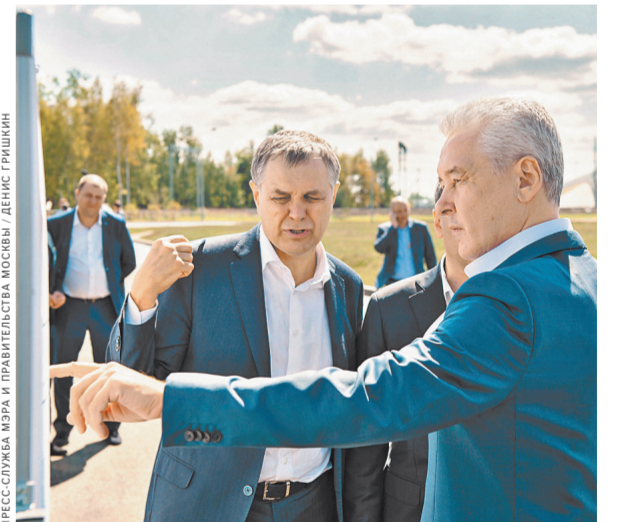
Сергей Собянин: Двухполосную эстакаду — по одной полосе в каждую сторону — здесь построили за полтора года.

РЕШЕНИЕ Верховный суд РФ приговор вербовщикам не изменил