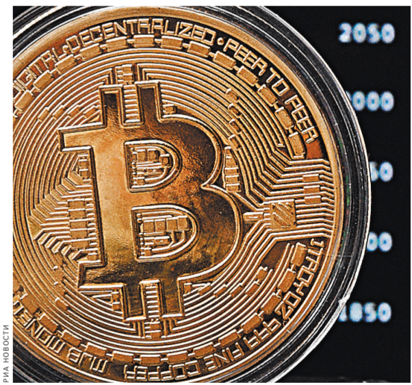
Интерес к биткоину и другим электронным валютам выходит на первый план, но к инвестициям в них стоит относиться очень осторожно.

Именно поэтому самые разные страны мира начинают постепенно обращать внимание на «электронные деньги». Сегодня криптовалюта на официальном уровне признаны платежным средством в Японии, совсем не-