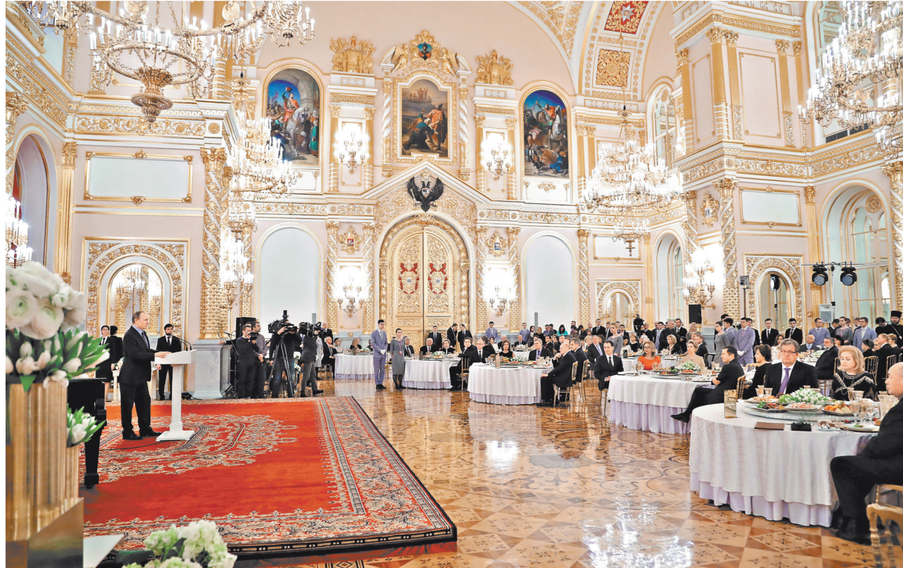
Приним по случаю юбилея Наны Ельциной, — в Александровском зале Большого Кремлевского дворца, здесь собрались ее родные и близкие, высокопоставленные чиновники, деятели культуры и бизнесмены.

«Вы мне устроили такой праздник», — растрогалась Ельцина. «Я как могла вносила свою лепту на протяжении всей своей жизни, а сейчас вместе с Президентским центром мы стараемся тоже делать добрые дела», — сказала именинница. «Конечно, я могу только поощрять: сколько у меня хватит сил, я буду стараться», — заключила она.