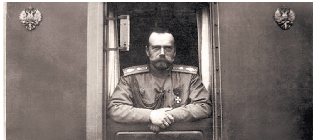
Государь Николай II: поезд дальше не пойдет.

Первые 100 рублей на строительство Федоровского собора перечислил находившийся на одре предсмертной болезни святой Иоанн Кронштадтский. Первые 25 тысяч — государь-император. Деньги продолжили собирать всемирно, и храм был построен.