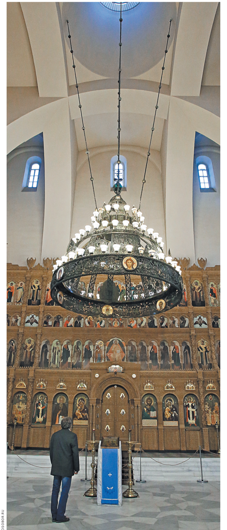
Восстановленный по фотографиям верхний храм: люстра в виде короны царя.

Столетие отречения императора Николая II от престола будет отмечено патриаршеством богослужением. Патриаршья литургия будет совершена сегодня. В день отречения 100 лет назад была явлена Державная икона Богородицы, верующие восприняли это как знак заступничества Божией Матери о русской земле. Сейчас Державная икона хранится в Казанской церкви в Коломенском, где была обретена, и являет собой одну из главных святынь современной России. В этом храме Патриарх Кирилл и совершит сегодня богослужение.