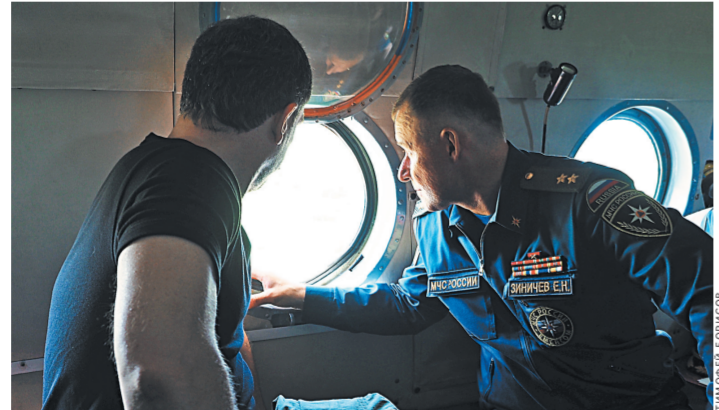
Глава МЧС Евгений Зиничев оценил ущерб от паводка в Амурской области, в том числе и с вертолета.

И это еще хорошо, что не начался сброс в Зейской ГЭС. Ее мощность гораздо больше, чем знаменитой Бурейской электростанции.