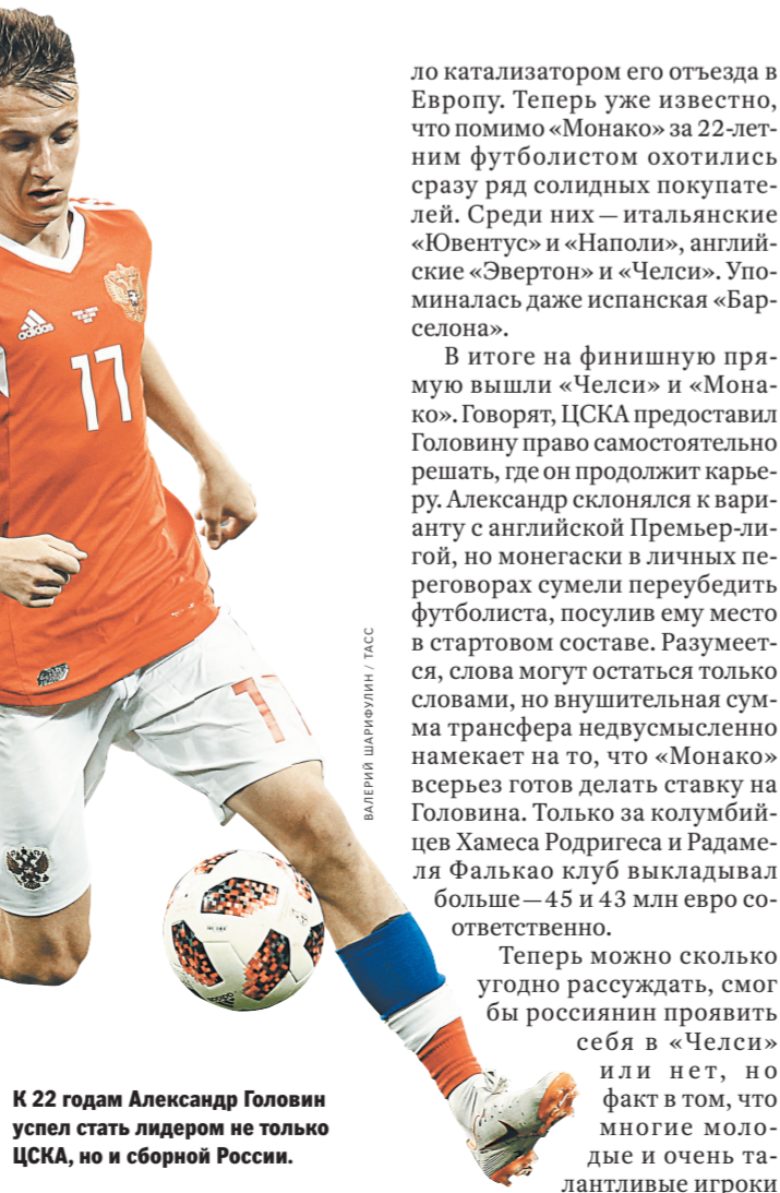
К 22 годам Александр Головин успел стать лидером не только ЦСКА, но и сборной России.

Интерес европейских клубов Александр Головин вызвал уже давно, а удачное выступление сборной России на чемпионате мира и лично талантливого полузащитника ста-