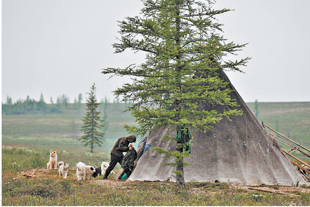
Русский Север всегда был магистральной темой отечественной литературы.

пример москвич, способен разоблачить, только если не скользить по строчкам глазами, а полноценно проговаривать про себя каждое слово: «Путь бабки соседки помучать куда он дился. Думо мни то ни догодатце. Он их душают стигнул я ватюши». Не отквашивать себе в этом удовольствии: «северные» главы короткие, а послесловие от такого своеобразного русского языка — долгое. «Медленно растет карельская сосна», — гласит опубликованный в прошлом году манифест «новой северной прозы». В ее полку прибыло.