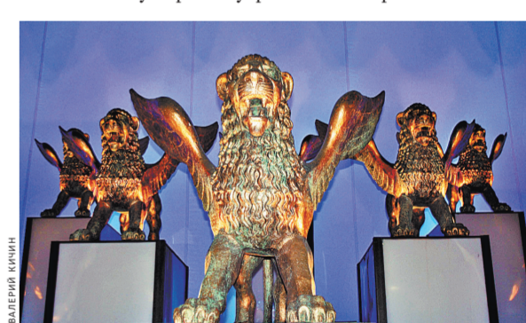
Венецианские львы — единственные в мире звери, которые лучше всех разбираются в тонкостях кинематографического искусства.

Венеция первой из фестивалей обратила внимание на телекino, показав пару сериалов «Молодой папы» Паоло Соррентино. Традицию продолжает конкурсная картина британец Коэн «Баллада Бастера Скраттса» — вестерн из времён Дикого Запада; фильм затевался как сериал для Netflix, авторы рассматривают его как антологию ковбойских баек. Тот же эпохе посвящен и вестерн Жака Одиара «Братья Систерс» с Джейком Джилленхолом, Хоакином Фениксом и Рутгером Хаузером в главных ролях.