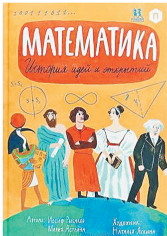
История математики от Пифагора до Эйнштейна и Перельмана.

Уверены, эта книга понравится и детям, и взрослым. Ведь что может быть лучше, чем устроиться всей семьей поздним вечером на балконе, заварить горячий чай, укутаться в теплый плед и вместе наблюдать за звездами. Искренне радоваться, увидев знакомое очертание, и торопиться загадать желание, пока падает звезда. А можно устроить соревнование, кто найдет и узнает больше звезд созвездий. Или вместе отправиться в воображаемое путешествие на Луну или Марс, ориентируясь по звездам, как водители по дорожным знакам. Но предупреждаем, после прочтения этой книги дети попросят купить им телескоп.