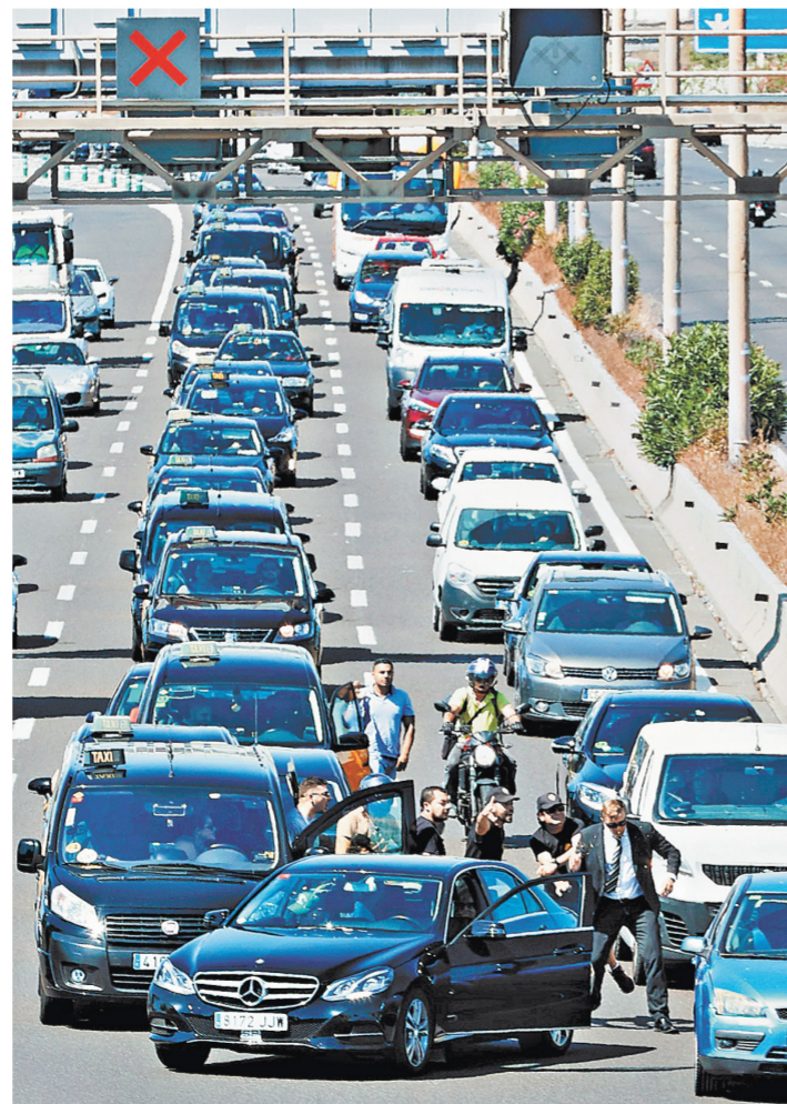
Таксисты Барселоны организовали медленный марш в знак протеста против использования онлайн-сервисов.