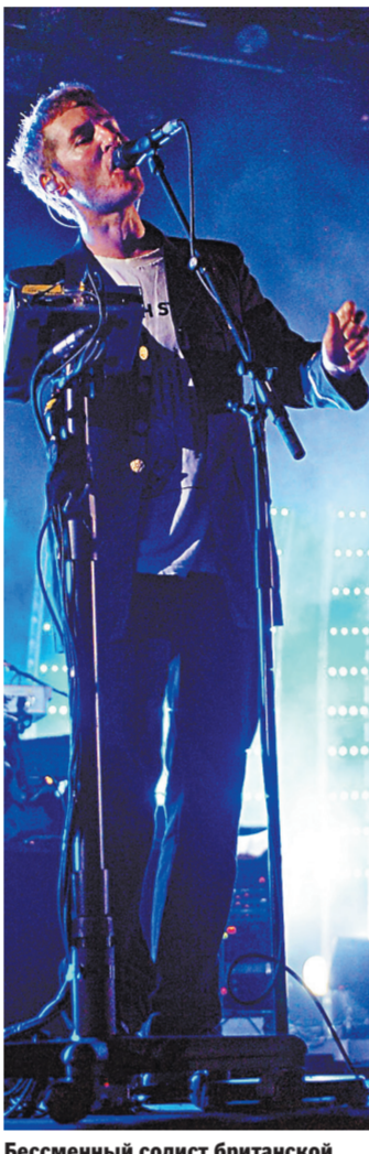
Бессменный солист британской группы Massive Attack Роберт «3D» Дель Ная.

изучать историю жанра, а по татуировкам — неугмонную фантазийность этого прикладного жанра искусства. Впрочем, каждый найдет себя на Park Live: музыку и по вкусу, и по темпераменту. Из тех артистов, которые удивят на фестивале также — блюз-рокеры Kaleo, играющие тяжело, с обилием нервных, взрывных и разрывных гитарных соло. Эту группу можно назвать «Воспоминание о будущем»: по музыке англоязычных исландцев реально представить, что на дворе по-прежнему 70-е, а The Doors и Джими Хендрикс еще живы и внимательно прислушиваются к песням своих коллег и единомышленников из Kaleo. Кстати, с этого года территория Park Live заметно расширилась. Теперь она будет вплотную примыкать к набережной Москва-реки и ее танцевальным площадкам. А неподалеку припаркуют автомобиль с аппаратурой для караоке. Те, кто успешно споет, получат собственный «концертный» видео-клип на электронную почту.