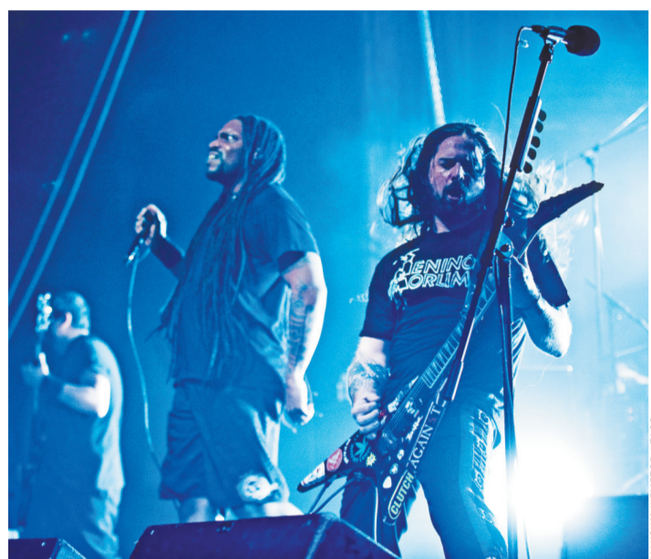
В группе Sepultura меняются составы, теперь стало больше бразильской страсти, но тяга к стремительным, яростным мелодиям неизменна.

Легенды мирового треш-метала Sepultura в отсутствие новых песен поступили иначе. Переиздавая свой знаменитый альбом Agise, бразильцы кропотливо покопались в архивах и нашли множество неизданных прежде демо-записей, редких миксов известных хитов, а также полновесный концерт — Live In Barcelona. Все 37 песен для двойного диска записывались еще при участии золотого состава Sepultura, в частности — певца и гитариста Макса Кавалеры и его брата Игоря Кавалеры — ударника.