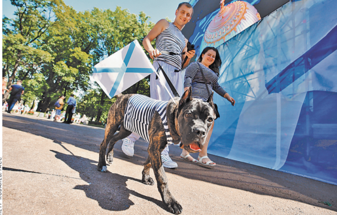
Тельняшка — неотъемлемый атрибут на этом празднике.