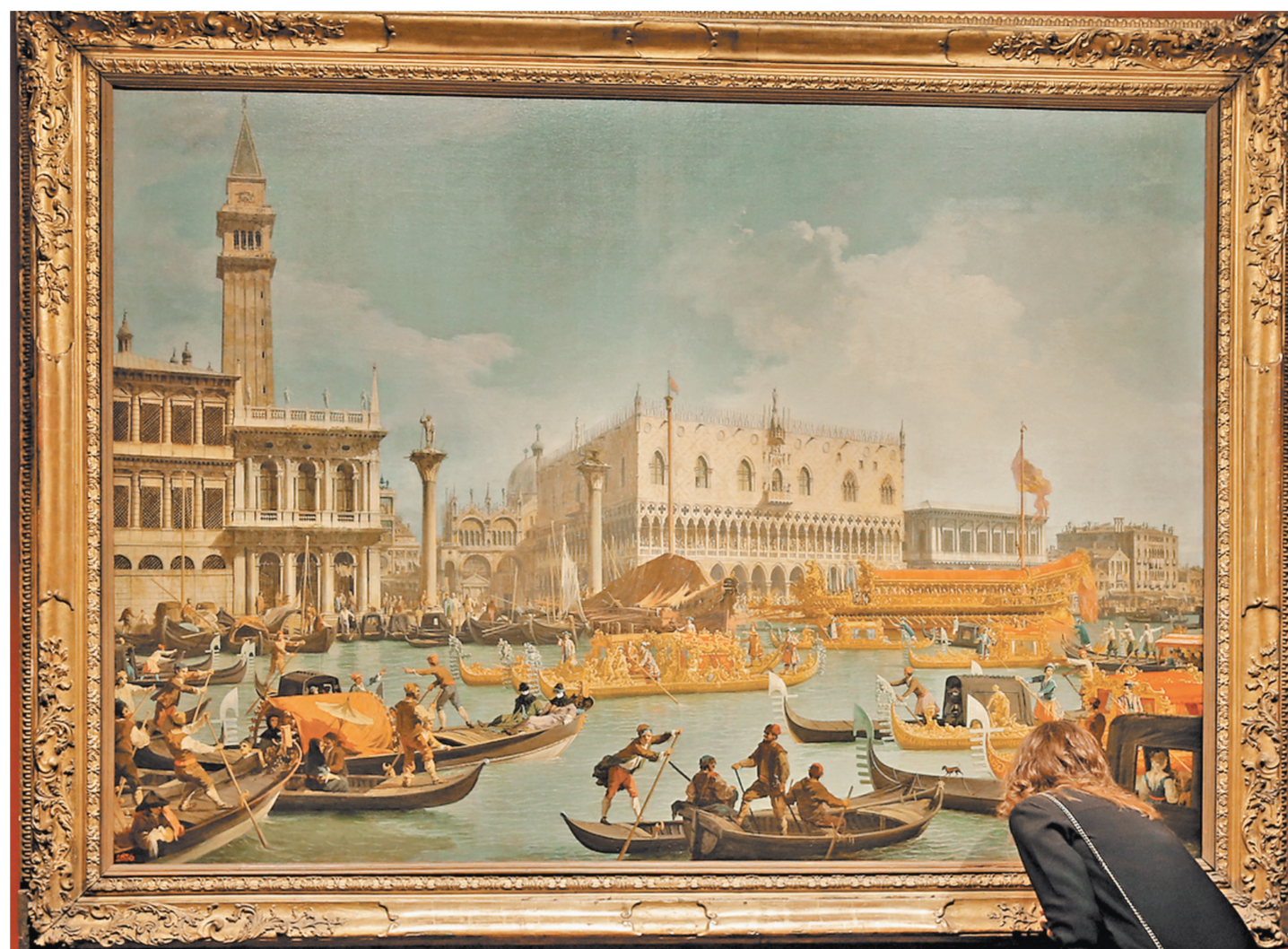
Пушкинский музей приглашает в эпоху Вивальди, Гольдони и Казановы.