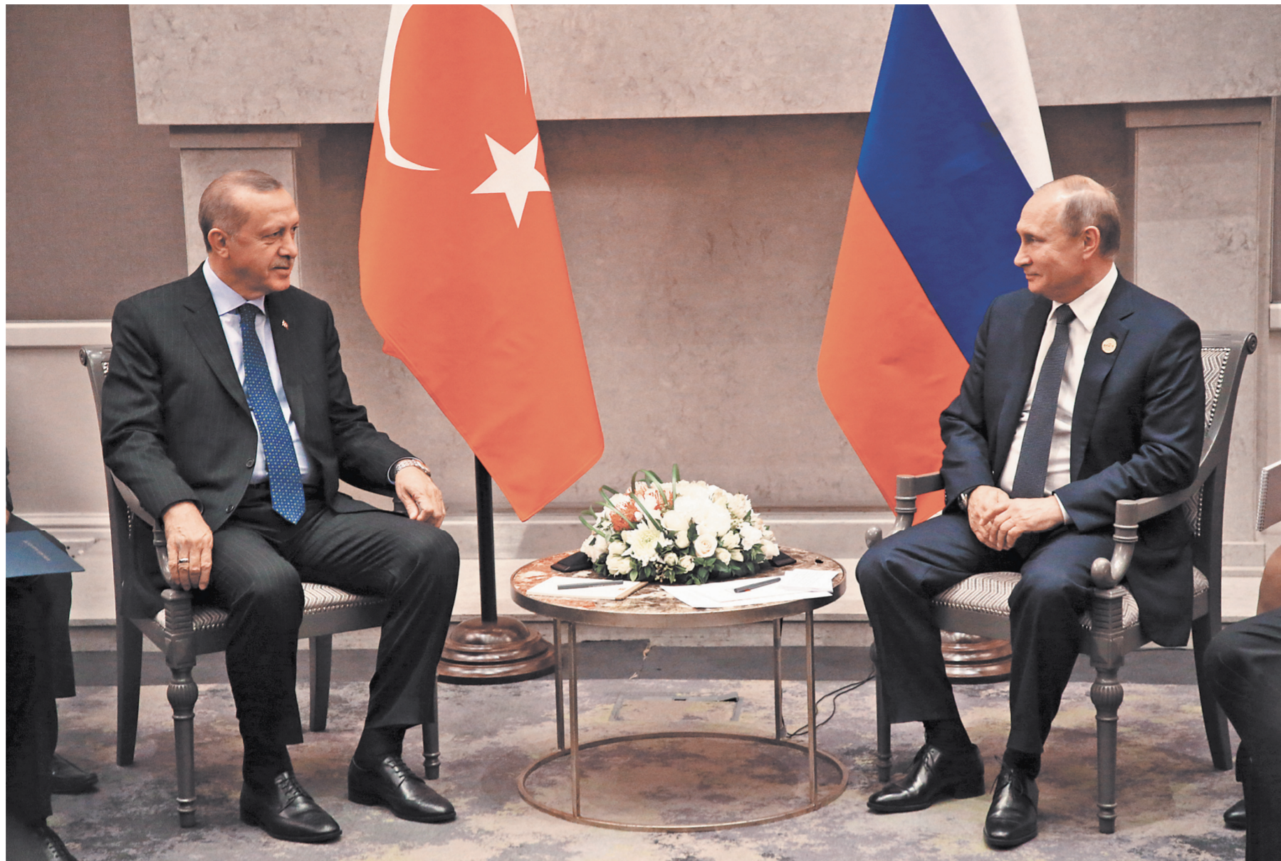
В Иоханнесбурге Владимир Путин и Реджеп Эрдоган «сверлили часы» по поводу совместной работы.

1 Банк, учрежденный в рамках БРИКС, выделит России кредит на миллиард долларов под инфраструктурные проекты, рассказал в кулуарах форума вице-президент банка и его главный финансист Лесли Маасдорп. Средства пойдут на разные цели — от строительства портов и дорог до энергетических проектов.