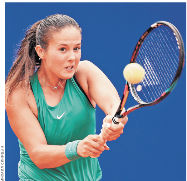
Обидно, что Дарья Касаткина покидает домашний турнир, но в Москве еще можно победить за двух россиян.