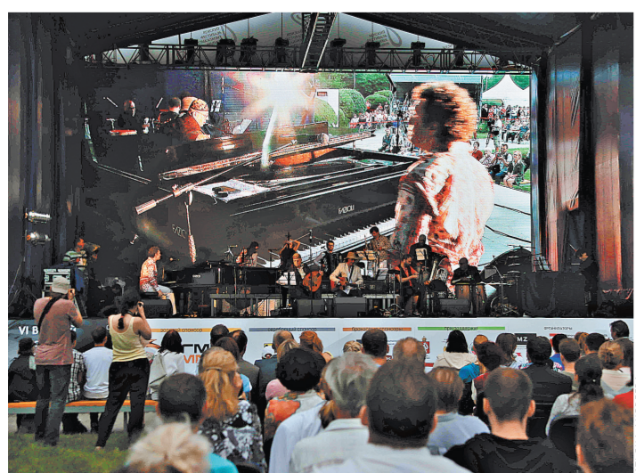
Семнадцать музыкальных вечеров под екатеринбургским небом — идет традиционный Венский фестиваль.

Завершится IX Венский фестиваль 11 августа традиционным DJ-парадом: в живых выступлениях примут участие известные диджеи из Москвы, Риги, Петербурга и Екатеринбурга.