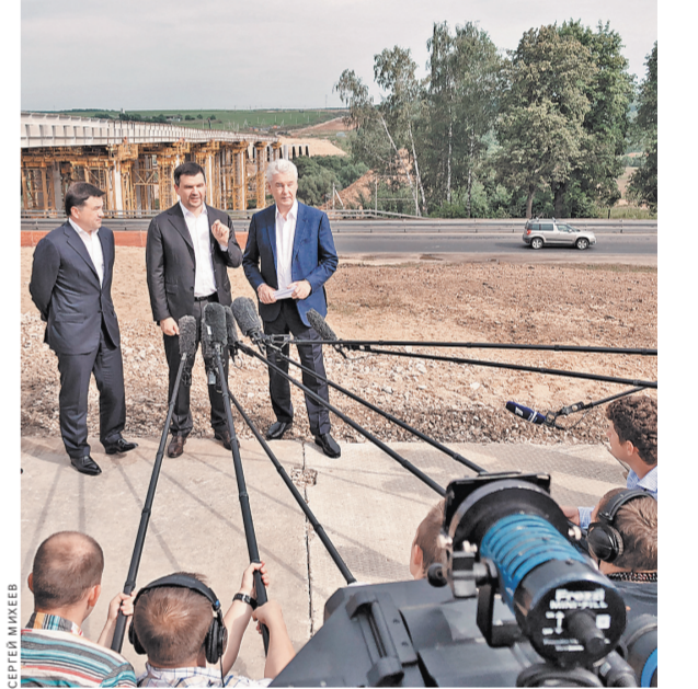
Мэр столицы Сергей Собянин и губернатор Подмоскovie Андрей Воробьев оценили готовность новой трассы.

Большая часть 530-километрового кольца может быть запущена в 2019 году, считает Воробьев. Сейчас из пяти участков строятся три: московский от «Дона» до «Малой бетонки» и два подмосковных, соединяющие автострасы Москва — Санкт-Петербург с А-107 и М7. По четвертому сегменту между трассами «Дон» и «Волга» заключено концессионное соглашение с инвестором, а работы на пятом пусковом комплексе от М1 до М11 планируется начать после 2022 года. На ЦКАД будет по две полосы в каждую сторону. Как заявил зампреда правительства РФ Максим Акимов, на дороге не будет шлагбаумов, деньги за проезд автоматически списывает система free flow.