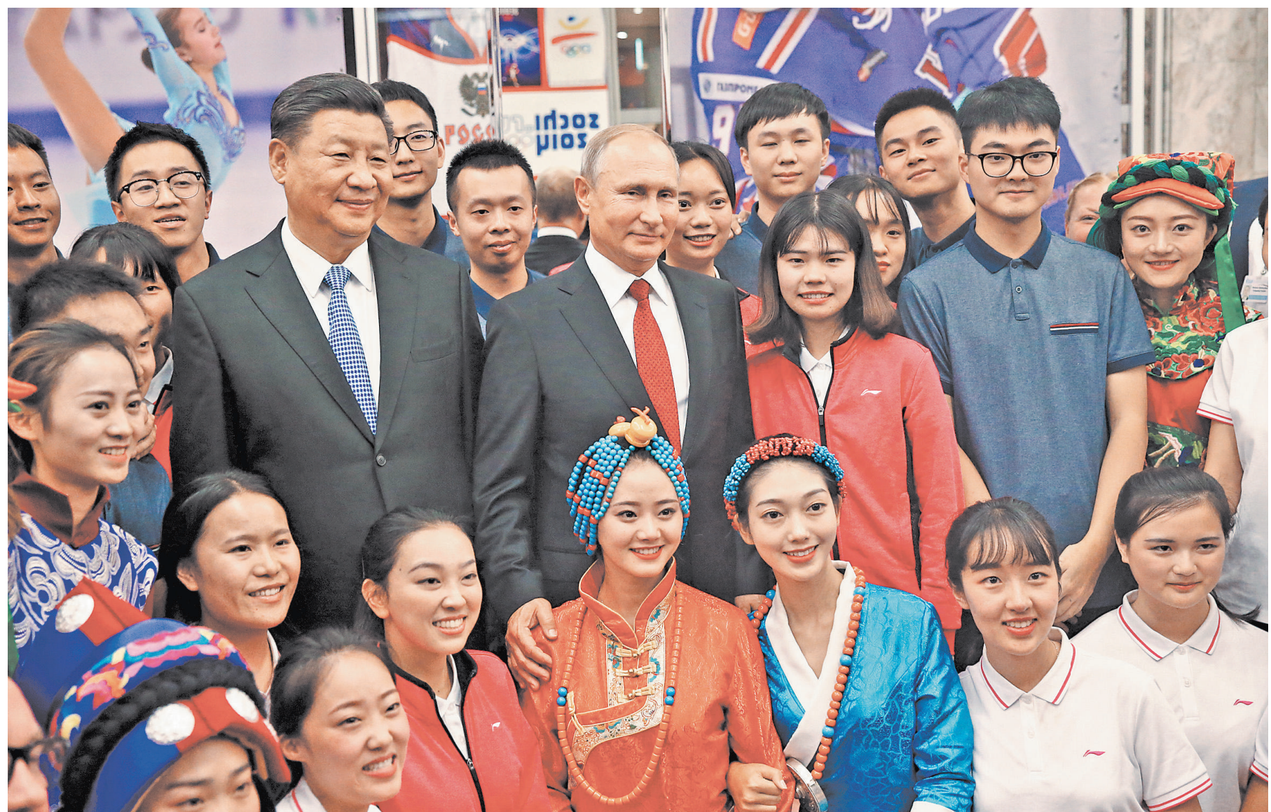
Владимир Путин и Си Цзиньпин во время посещения Всероссийского детского центра «Океан».

1 «Считаю правильным, чтобы наши ведущие компании, корпорации, которые реализуют проекты на Дальнем Востоке, а это «Роснефть», «Газпром», «Росатом», «Роскосмос», предприятия, занимающиеся авиационной промышленностью, другие, разместили на острове Русский свои инженерные подразделения, центры исследований и разработок», — сказал президент.