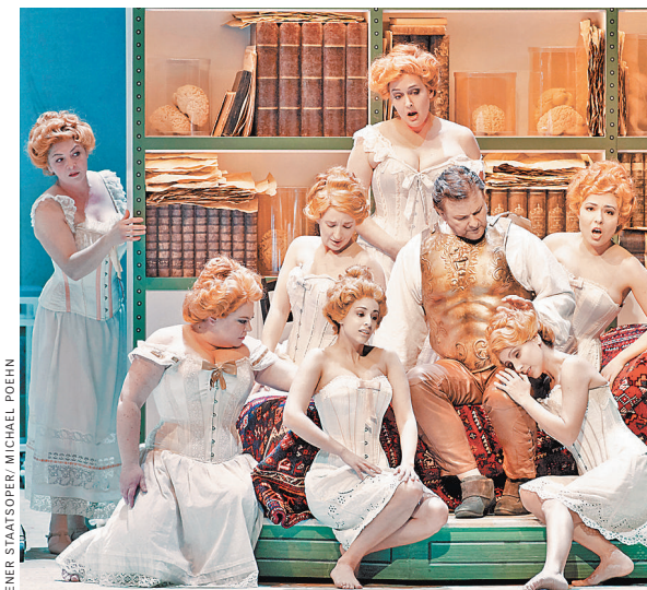
В следующем сезоне в Венской опере впервые будет дирижировать Валерий Гергиев — «Парсифалем» Вагнера.

Будут и новшества с артистами, выступающими на прославленной сцене. Например, оказалось, что Валерий Гергиев, который много раз дирижировал Венским филармоническим оркестром, никогда не руководил этими музыкантами в оркестровой яме Венской оперы. В этом сезоне Гергиев продиржирует «Парсифалем» в Венской опере. Разумеется, шла речь на пресс-конференции и о российских артистах, которые активно присутствуют и в оперной, и в балетной труппах, и в оркестре театра.