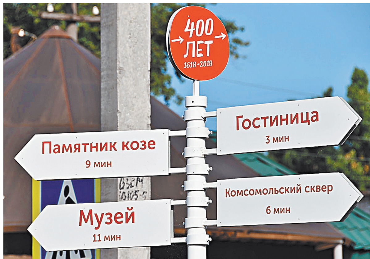
Урюпинск совсем крохотный город. Расстояния здесь отмеряются не километрами, а минутами неспешной походки. К 400-летию фасады покрасили, таблички обновили, а магазины дают скидку до 15 процентов!

В перспективе участок Курского направления войдет в МЦД-2 — «Нахабино — Подольск», где поезда будут ходить в часы пик каждые 4–6 минут.