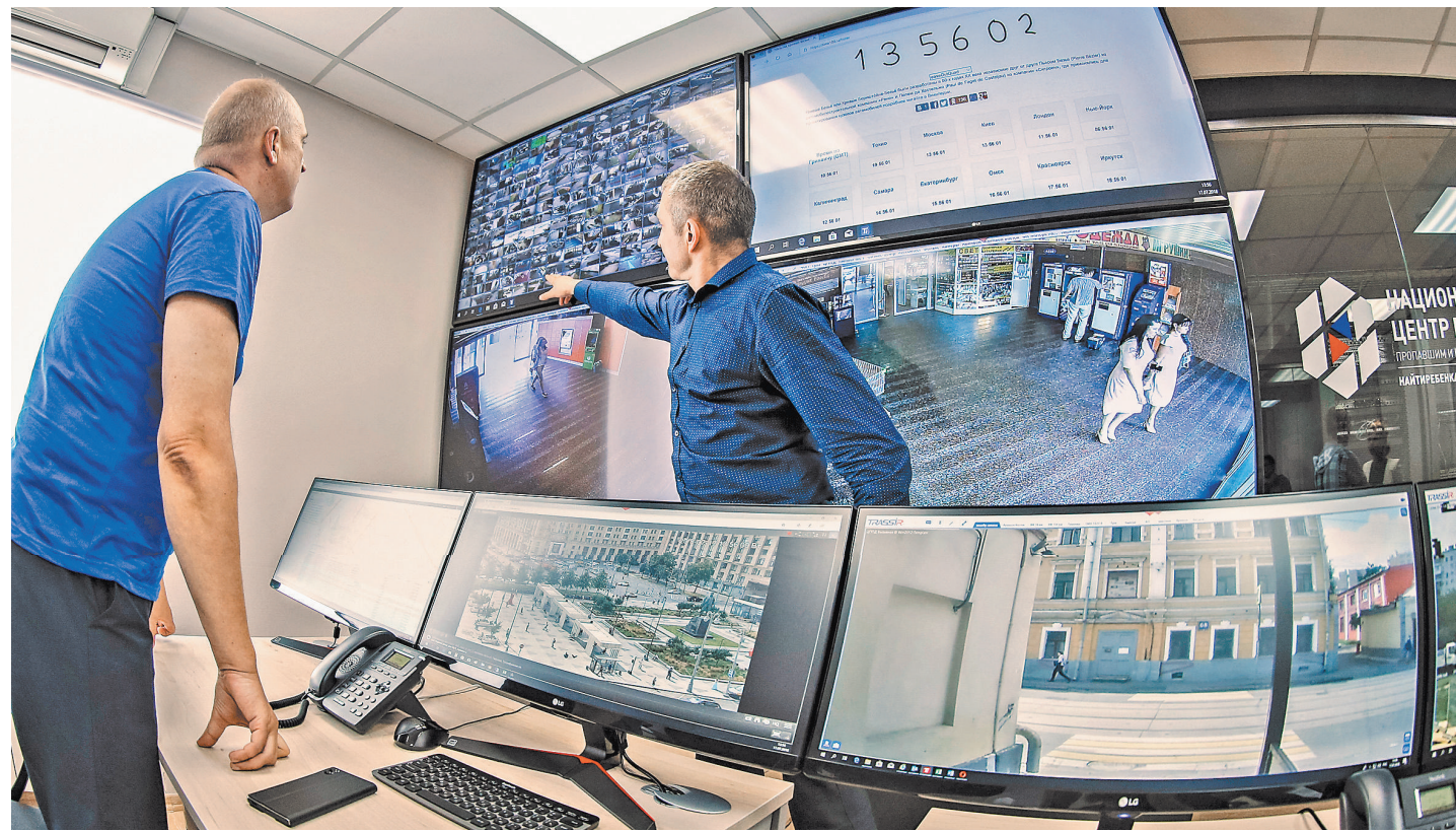
Волонтеры обучали использовать для поиска электронные устройства. В том числе мобильные телефоны, навигаторы и дроны.

На обучение приехали как опытные поисковики и руководители отрядов, которые занимаются поиском пропавших детей много лет, так и те, кто совсем недавно по зову сердца стал доброво-