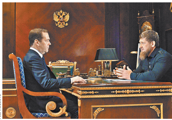
Рамзан Кадыров пригласил главу правительства на празднование 200-летнего юбилея столицы Чечни — Грозного.

«У нас приближается большой праздник — 200-летие Грозного», — продолжил Кадыров. — Вы знаете, в каком состоянии мы получили Грозный, а сегодня мы готовимся к празднику и надеемся, что вы приедете тоже, если будет время. Мы вас приглашаем, потому что вы лично участвовали в восстановлении, возрождении нашего города». «Абсолютно согласен с тем, что праздник — это не только праздник, но и повод привести в порядок городское хозяйство, повод хороший», — сказал в ответ Медведев. — Надеюсь, что к юбилею удастся сделать все, что еще не закончили. Премьер-министр поблагодарил главу республики за приглашение.