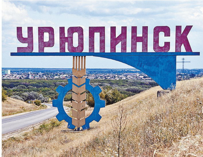
До сих пор многие не верят в существование Урюпинска. Думают, что это из анекдотов. А между тем городу исполняется 400 лет!