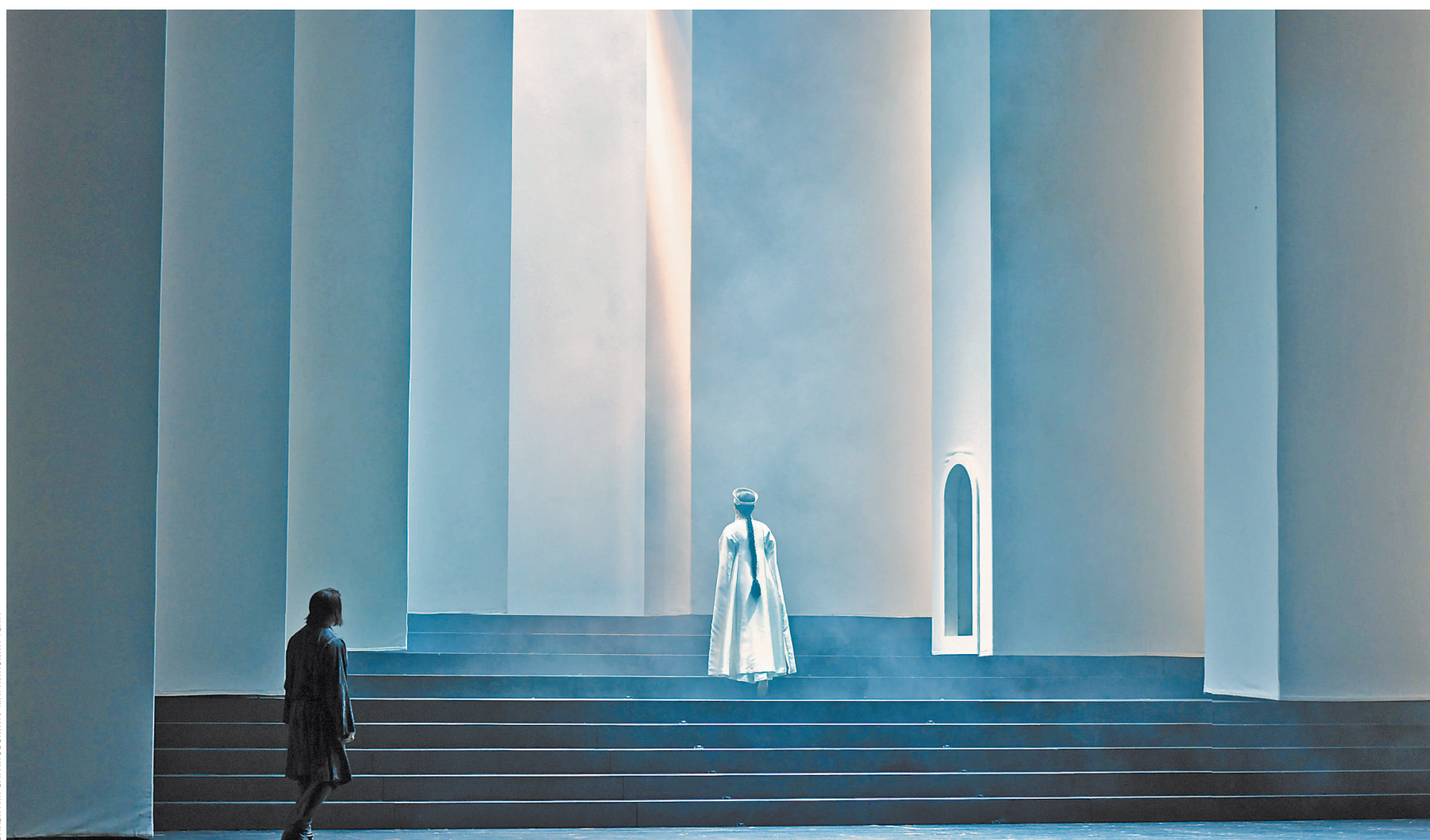
В новой «Царской невесте» участвует целое поколение молодых певцов Мариинского театра.