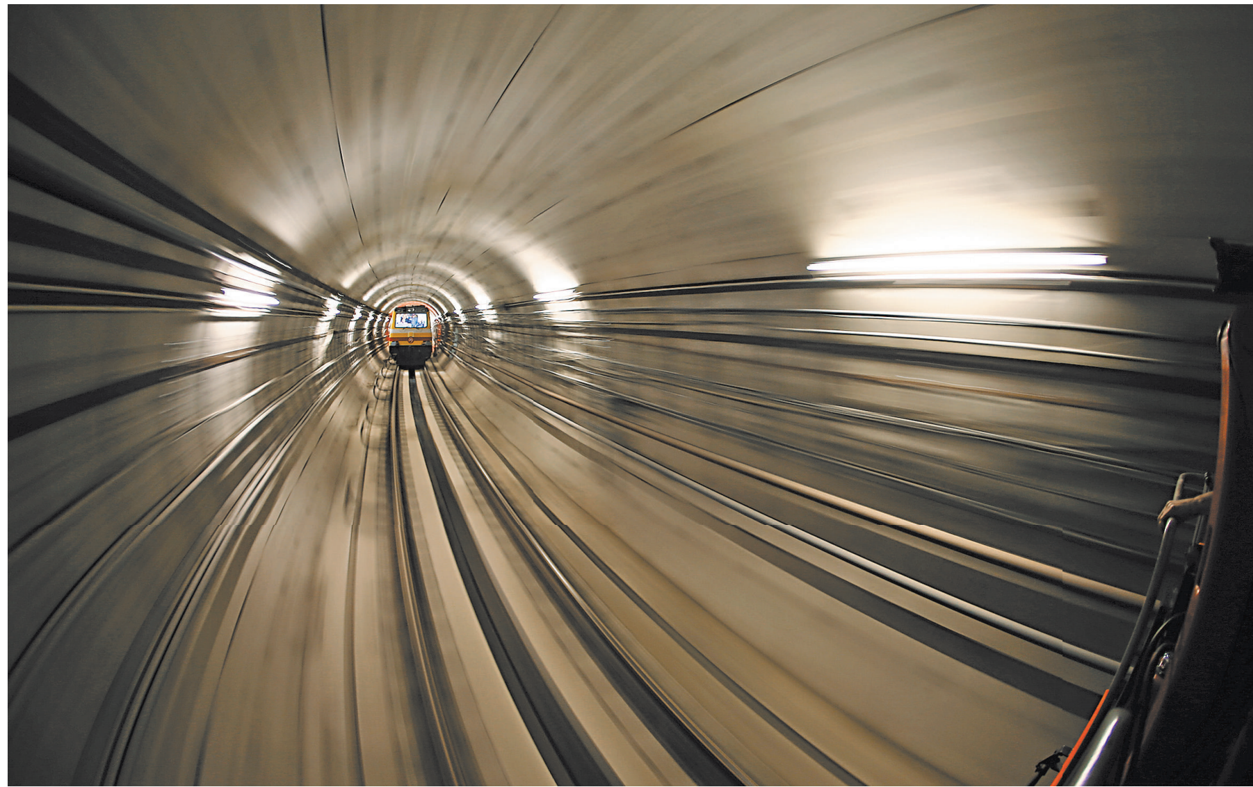
Цифровые технологии «сжимают» пространства. Скоро полностью на цифровое управление переведут не только метрополитен, но даже авиалайнеры.

1 «К сожалению, — продолжил Акимов, — Россия, имея огромный транзитный транспортный потенциал, пока не вполне его освоила и не предложила партнерам сервисы мирового класса».