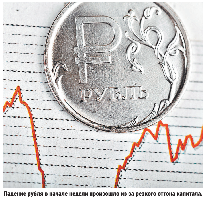
Падение рубля в начале недели произошло из-за резкого оттока капитала.

Прогнозируя откат курса к уровню начала августа, Орешкин в эфире Business FM уже посетовал продавать доллары — видимо, чтобы заработать на разнице курсов валют. Позднее председатель правления ВТБ Андрей Костин в интервью радио напомнил, что Орешкин был одним из самых ярких экономистов, когда работал в ВТБ, но насчет его совета сделал оговорку: «Я бы не был так уверен». Костин предпочитает дожидаться ноября, когда станет окончательно известно, насколько США ужесточат санкции против России. По словам Костина, сейчас у банка достаточно долларов на случай, «если народ побегит деньги снимать», а на случай ужесточения санкций США в отношении банка ВТБ подготовил план действий, который сохранит валютные депозиты в целостности.