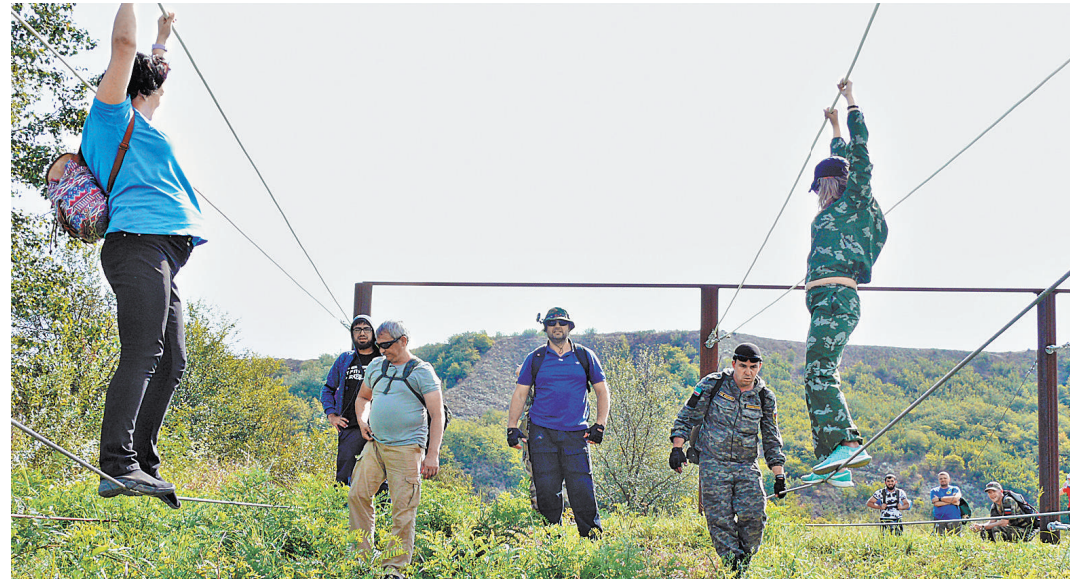
На обучение приехали как опытные поисковики с многолетним опытом по розыску детей, так и новички в этом деле, желающие помогать людям.