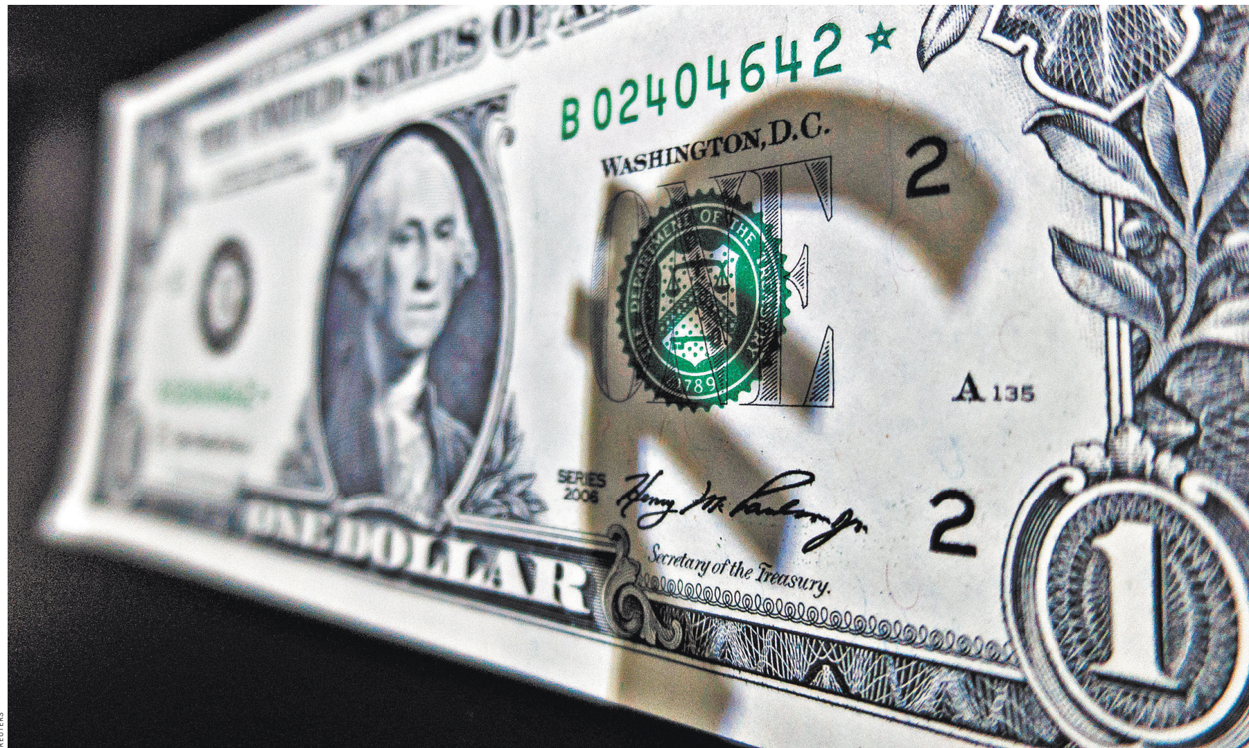
Юнкер назвал абсурдом, когда Европа платит за энергию в долларах, хотя покупает ее не в США.