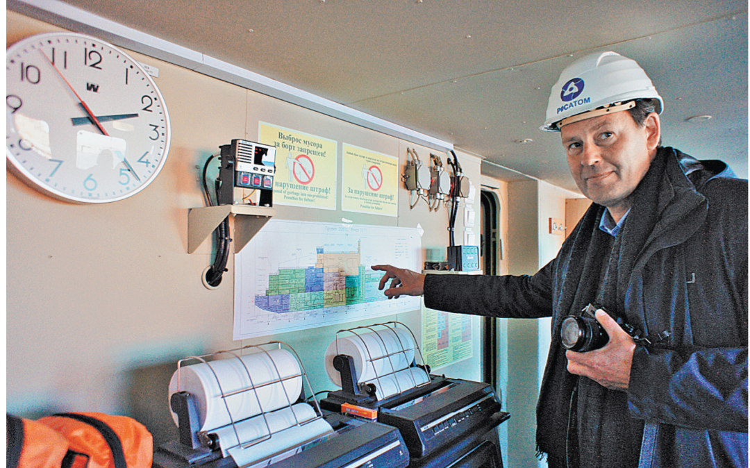
Открытый диалог с экологими стал нормой в «Росатоме». В этот раз активистам норвежского объединения «Беллона» дали возможность рассмотреть изнутри плавучий энергоблок «Академик Ломоносов». Оказавшись внутри, гости из Норвегии получили подтверждение, что в один из двух реакторов ПЗБ ядерное топливо уже загружено и начаты подготовительные процедуры к такой же операции на втором. А затем, побывав в машинном отделении, на центральном пульте управления, в каютах, на мостике и вертолетной палубе, смогли увидеть, как это уже работает, и понять, как должно функционировать в составе плавучей атомной теплоэлектростанции в Певеке.