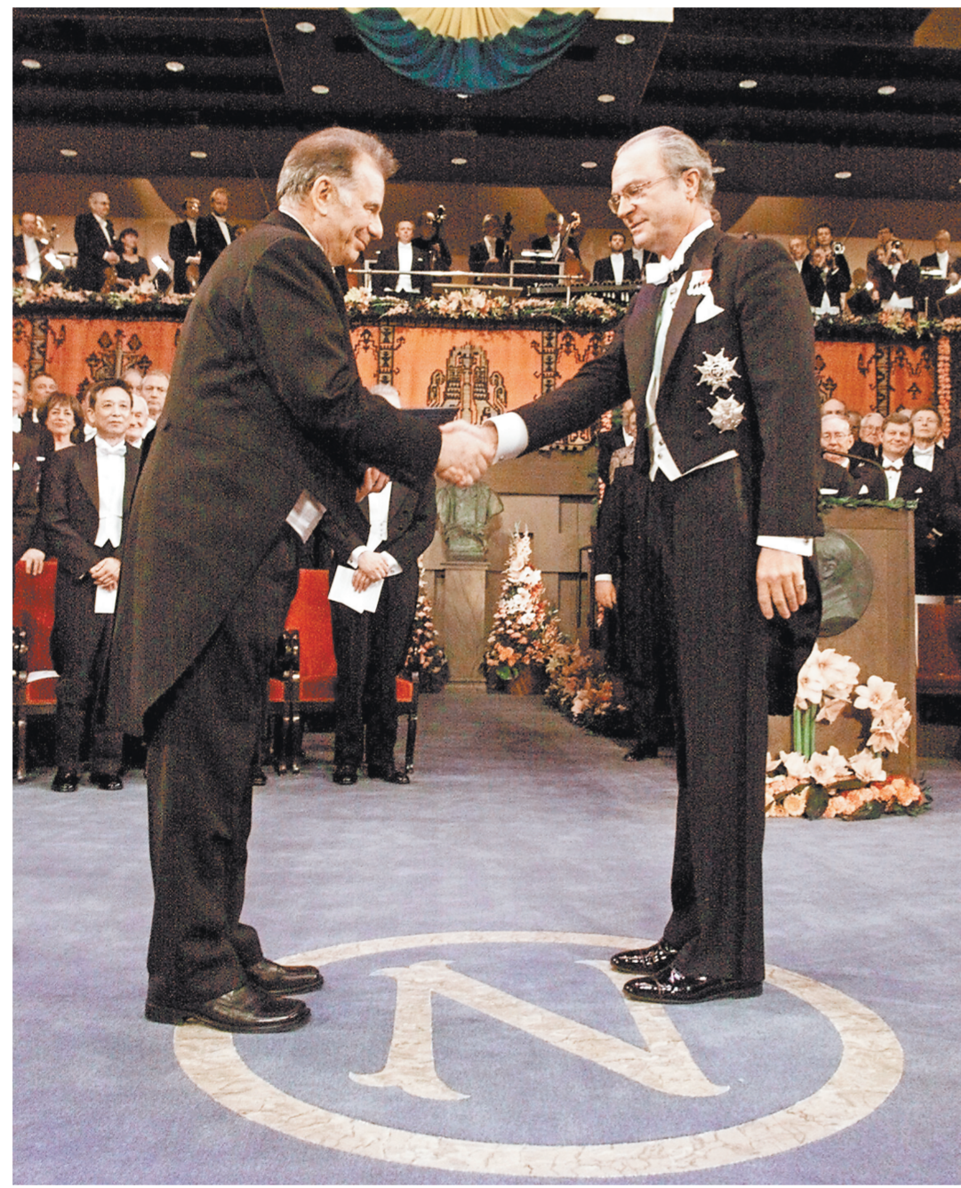
Свою Нобелевскую премию академик Жорес Алферов получил в 2000 году из рук короля Швеции.

«Действительным источником этого зла, по моему мнению, является экономическая анархия капиталистического общества. Мы видим перед собой огромное производительное общество, чьи члены все больше стремятся лишиться друг друга плодов своего