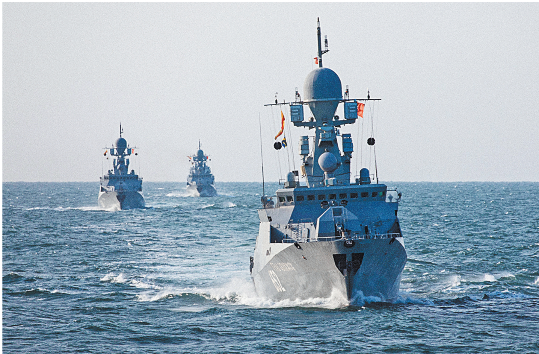
МИНИСТЕРСТВО ОБОРОНЫ РФ