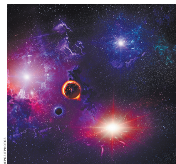
Астрономам еще предстоит отыскать в космосе многочисленные родню нашего светила.

Ученые считают, что одновременно с ним из газопылевого облака на свет появились еще сотни, а то и тысячи сестер-близнецов. Одни взорвались и ушли в небытие, другие разлетелись по космосу. Их следы отыскать почти невозможно. Правда, недавно одного близнеца вроде бы удалось отыскать. Изучив более 30 звезд в нашей галактике Млечный Путь, астрономы выделили одну звезду HD 162826, которая находится в созвездии Геркулеса. Этого претендента на близнеца Солнца можно увидеть в обычный бинокль неподалеку от яркой звезды Вега.