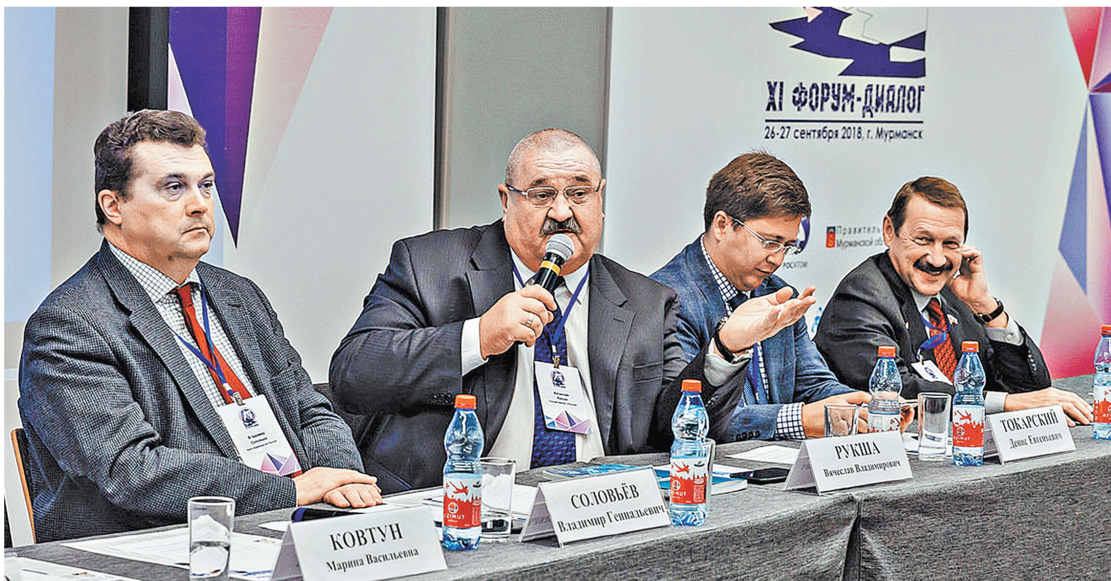
Финальным аккордом в рамках мурманского форума стало заседание Арктического клуба, который совместно подготовили и провели Союз журналистов России и госкорпорация «Росатом».

может составить грузооборот в Арктике к 2024 году.