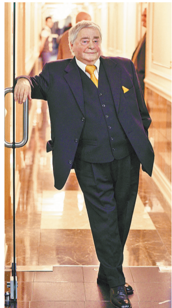
Роман Карцев был совершенным образцом особой актерской породы — одессит.