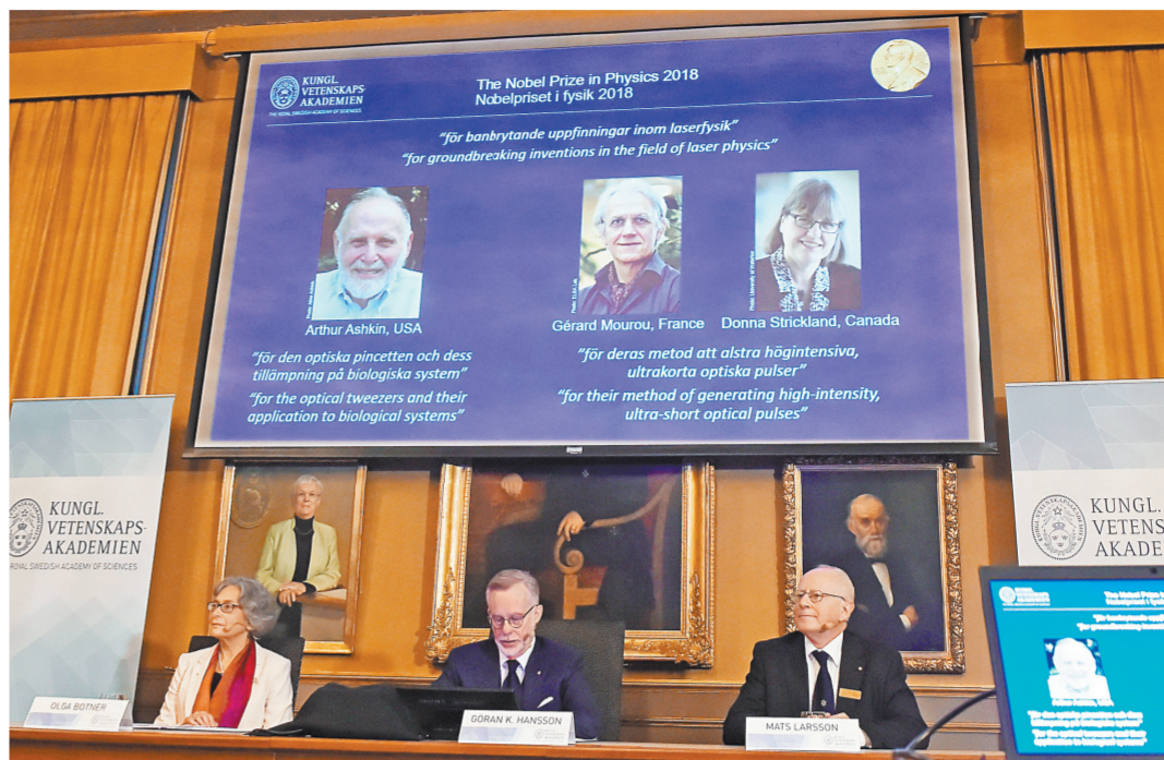
Нобелевский комитет умеет держать интригу до самой последней секунды и почти всегда удивляет.

Каждый год объявление лауреатов становится как для научного сообщества, так и для всего