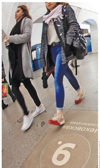
Пассажиры надеются, что новая навигация поможет им все-таки лучше ориентироваться.