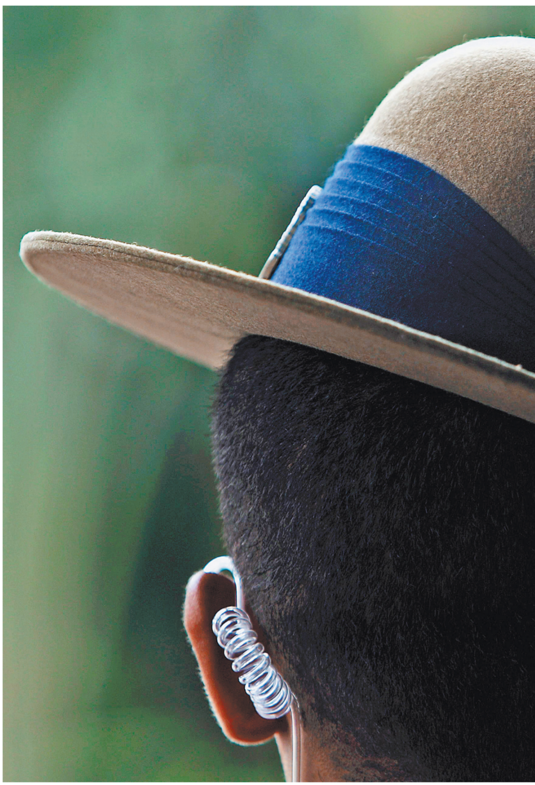
Эксперты призывают декриминализировать статью 138.1 УК, ведь реальным шпионом она не грозит.

Разработать поправки, позволяющие отделить шпионскую технику от электронных гаджетов, было поручено ФСБ