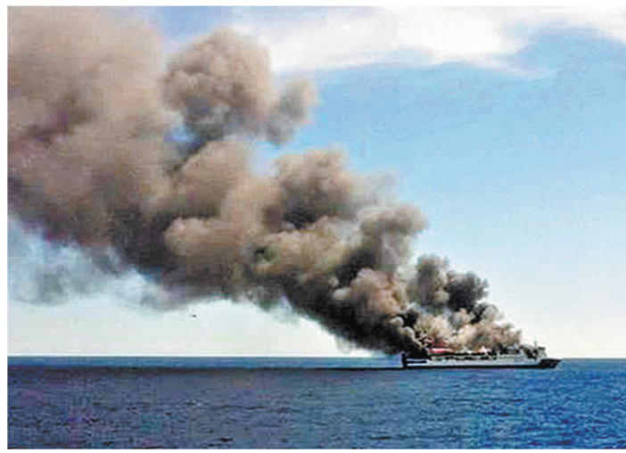
Чрезвычайное происшествие случилось в нейтральных водах Балтийского моря.

Однако, судя по сделанным снимкам, дым стоял приличный. Поэтому, считают российские специалисты, это не было