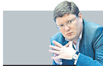
Андрей Исаев первый заместитель руководителя фракции «Единая Россия» в Государственной Думе