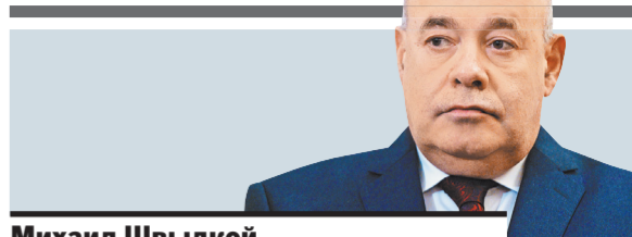
Михаил Швыдкой доктор искусствоведения