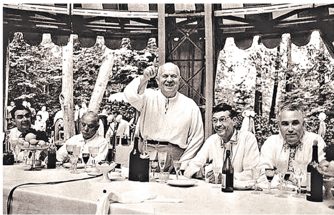
Никита Сергеевич Хрущев на отдыхе в Крыму. Фото 1960 года.