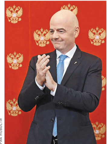
Президент ФИФА Джанни Инфантино считает, что у футбола и шахмат много общего.

«Возвращаясь домой после проведения невероятно успешного чемпионата мира по футболу в России, я очень рад сказать несколько слов и вам, людям футбола мира. Прежде всего позвольте мне сказать, что наш футбольный чемпионат мира в России был просто самым лучшим! Он получился таковым благодаря очень тесному сотрудничеству с российским организационным комитетом, председателем которого был один из вас — Аркадий — мой добрый друг, который руководил этим действом в России и показал, как именно необходимо подходить к организации событий такого грандиозного масштаба.