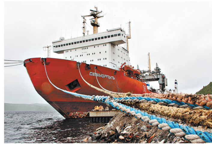
Для атомного ледоколостроения «Севморпути», единственного в своем роде, в Арктике снова есть работа.

А теперь мы смоги побывать не только на палубе и внутри нового для «Росатома» объекта, но и увидели практические результаты нашего взаимодействия в другом проекте, который долгое время оставался проблемным. Это плавбаза «Лепсе» с облученным ядерным топливом, которое осталось еще с советских времен. «Лепсе» была предметом серьезного беспокойства не только жителей Мурманска, но и нас в Норвегии. Теперь объект переведен в контролируемое состояние, а ядерное топливо начинают выгружать. Открытость, которую демонстрирует в таких делах «Росатом», мы приветствуем.