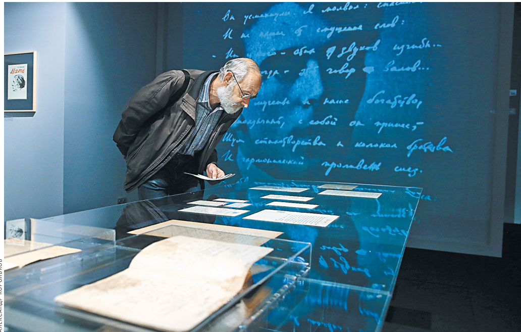
Сразу три выставки встречают первых посетителей в новом здании Литературного музея имени Даля.

«ГМИРЛИ имени Даля впервые ставит задачу средствами музейной экспозиции воссоздать целостную и достоверную историю русской литературы XX столетия», — уверяют музейщики. И амбиции эти своевременны: как это ни странно, в России все еще нет единой истории русской литературы. И сто лет спустя после трагического разлома 1917 года и всего, что за этим последовало, она воспринимается и, главное, изучается разрозненными кусками: отдельно — поддерживаемые властями члены советского Союза писателей, отдельно — репрессированные и ушедшие в глухой андеграунд «самиздатчики», отдельно — русское зарубежье всех волн. И приходится прилагать мысленное усилие, чтобы сообразить, что Бунин восторгался «Тихим Доном», Солженицын лишь по досадной слу-