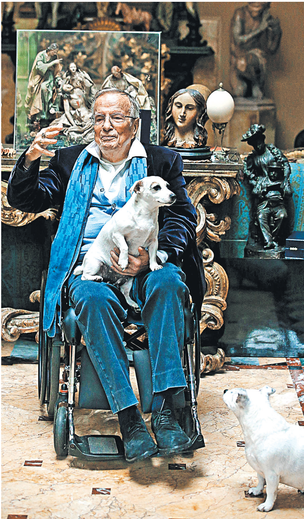
Франко Дзеффирелли стал эпохой в искусстве.

«За всю жизнь у меня было только две жены — кино и опера. Когда одна начинала надеяться, я уходил к другой», — отшучивался Дзеффирелли в том же интервью. Он смог гениально соединить кино и оперу. Его версии «Травиаты» с Терезой Стратас, «Отелло» с Катей Риччарелли и «Сельская честь» с Еленой Образовой становились хитами мирового кинопроката. И только сетовал, что так и не