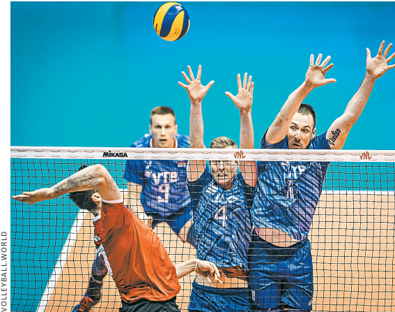
Сборная России постепенно движется к выходу в финальный турнир Лиги наций, который состоится в США.