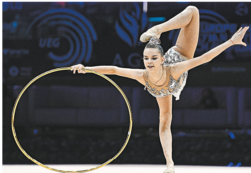
«Художница» Дина Аверина поедет в Минск без своей сестры-близняшки Арины.