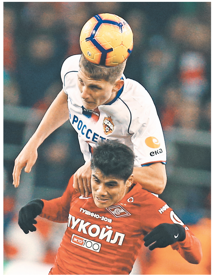
ЦСКА и «Спартак» снова встретятся еще до начала нового сезона.