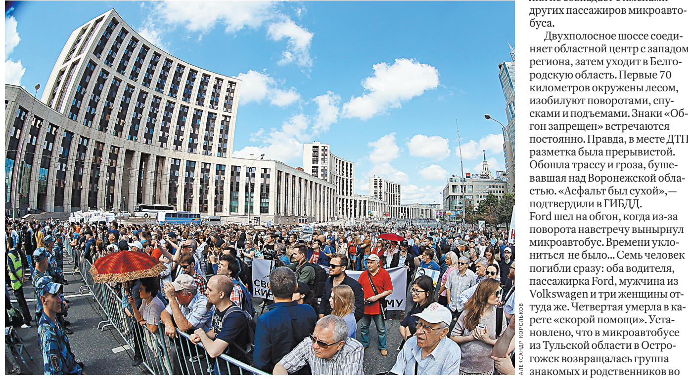
Все участники акции проходили через рамки — мера безопасности, предпринятая правоохранительными органами.