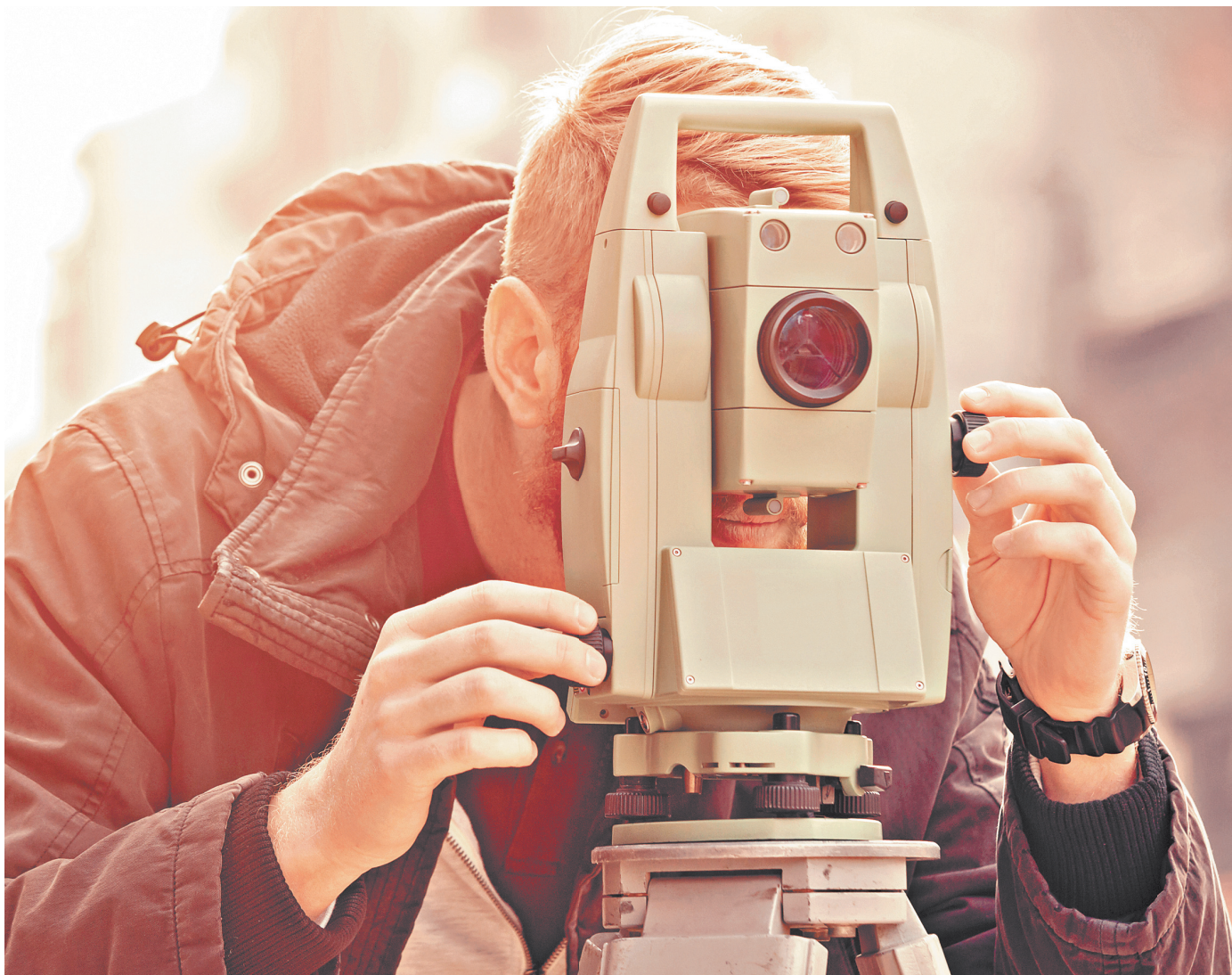
ИСТОК / ИСТОК

Поправки в Федеральный закон «О кадастровой деятельности» позволяют снять барьеры при выполнении комплексных када-