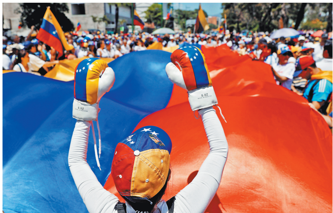
Вернувшийся в Каракас Гуайдо заставил сторонников, собравшихся ради него на митинг, ждать несколько часов.

Как выяснилось, взрывные устройства прислали по почте. Пришли одинаковые белые конверты формата А4, внутри — свертки желтого цвета, которые при открытии конвертов начинали гореть. Эксперты утверждают, что ввиду маломощности бомб их действия хватило бы лишь на небольшое возгорание. Полиция полагает, что такие же посылки могут прийти и в другие места, поэтому просит жителей столицы проявлять бдительность. ●