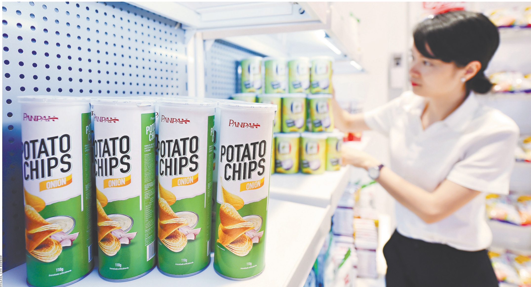
В компании Rapran Foods упаковки с картофельными чипсами и другими закусками, предназначенными для зарубежных рынков строго контролируются. 20 июня 2018 года.

В провинции Фуцзянь, известной быстрыми темпами роста своих электронной и швейной индустрий, появляются все больше заводов, внедряющих автоматизацию. За первые 10 месяцев 2018 года это привело к росту импорта промышленных роботов в 16 раз. В северокитайской провинции Шаньси угольные компании переходят на новую энергию и новые