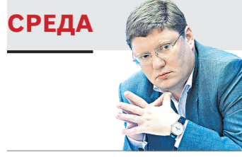
Андрей Исаев первый заместитель руководителя фракции «Единая Россия» в Государственной Думе