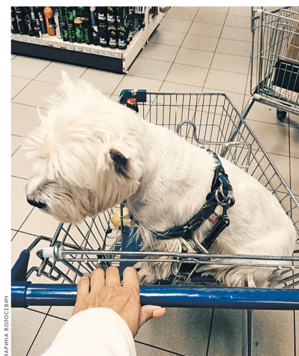
Чтобы уберечь своих любимцев от воров, собаководы советуют чипировать их или надевать GPS-ошейники.