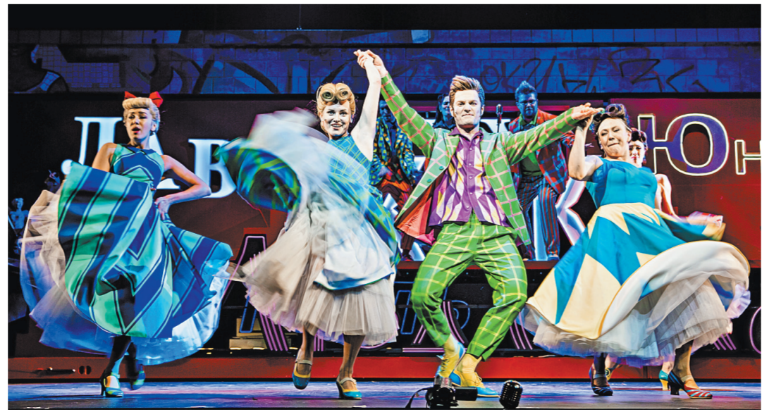
Спектакль сделан в бродвейском стиле с фирменной экспрессией, вихревыми ритмами и спецэффектными номерами.