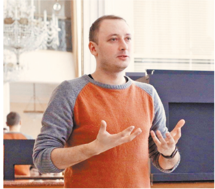
Тимофей Кулябин: Я не стану истязать себя борьбой и противостоянием — просто уйду, не буду тратить свою жизнь на войну.

Знаменитым оперным режиссером Тимофея Кулябина сделал его вагнеровский «Тангейзер», появившийся в Новосибирской опере в 2014 году и получивший под суд... Но международный успех пришел к режиссеру исключительно в художественной плоскости год спустя вместе со драматическим спектаклем по чеховским «Трем сестрам» в новосибирском «Красном факеле», который по сей день гастролирует по миру.