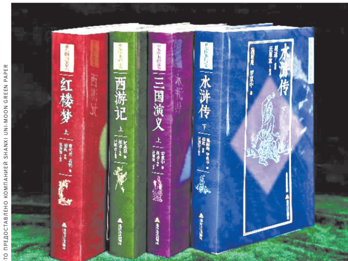
Четыре классических произведения китайской литературы, напечатанные на «каменной бумаге», изготовленной из отходов угольного производства.