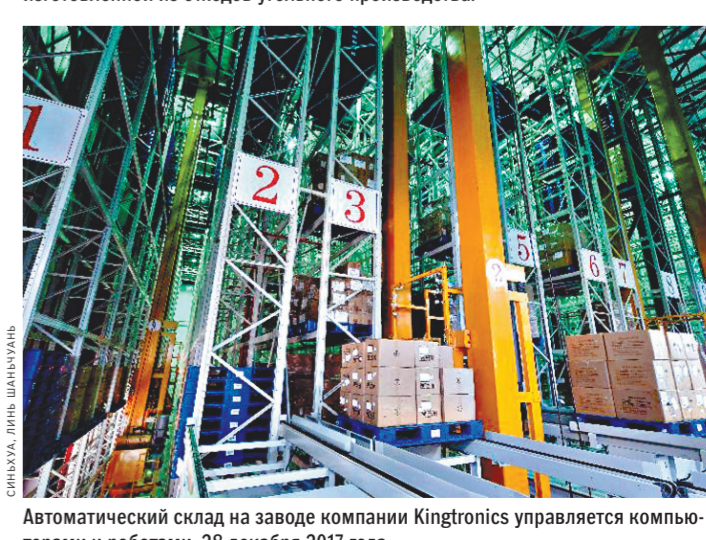
Автоматический склад на заводе компании Kingtronics управляется компьютерами и роботами. 28 декабря 2017 года.