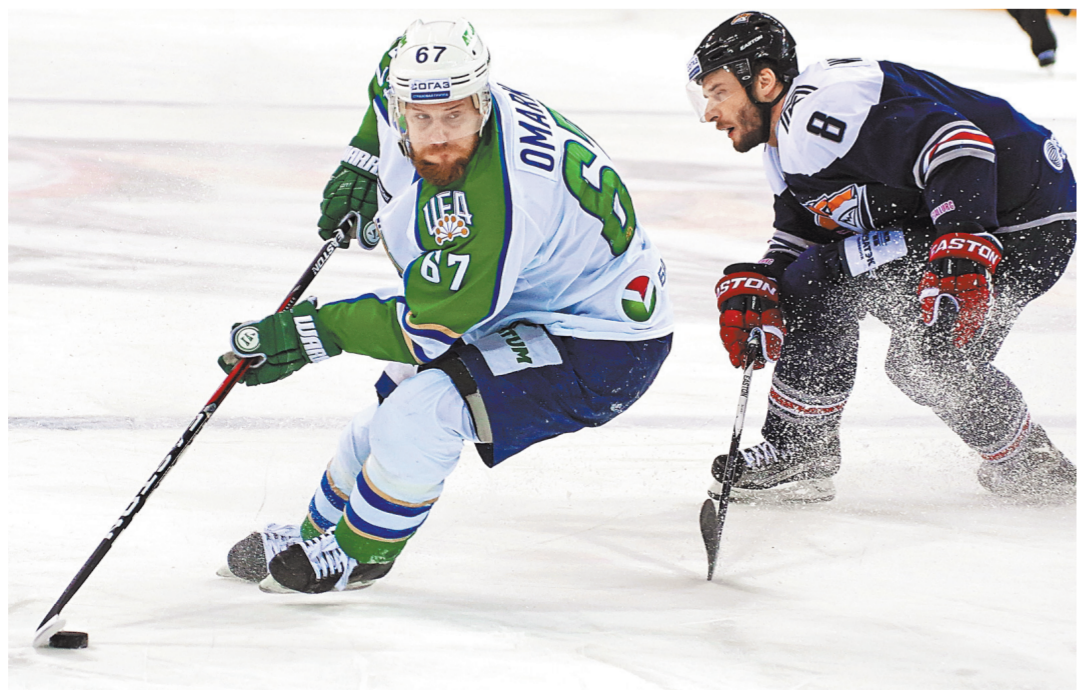
Хоккеисты «Салавата» (в светлой форме) снова обыграли «Металлург» в Магнитогорске и вышли вперед в серии.

Пятый матч в этой серии состоится уже сегодня в Петербурге. Кроме того, аналогичную по счету встречу проведут в Астане местный «Барыс» и нижегородское «Торпедо». Счет в этом противостоянии пока также ничейный — 2:2.