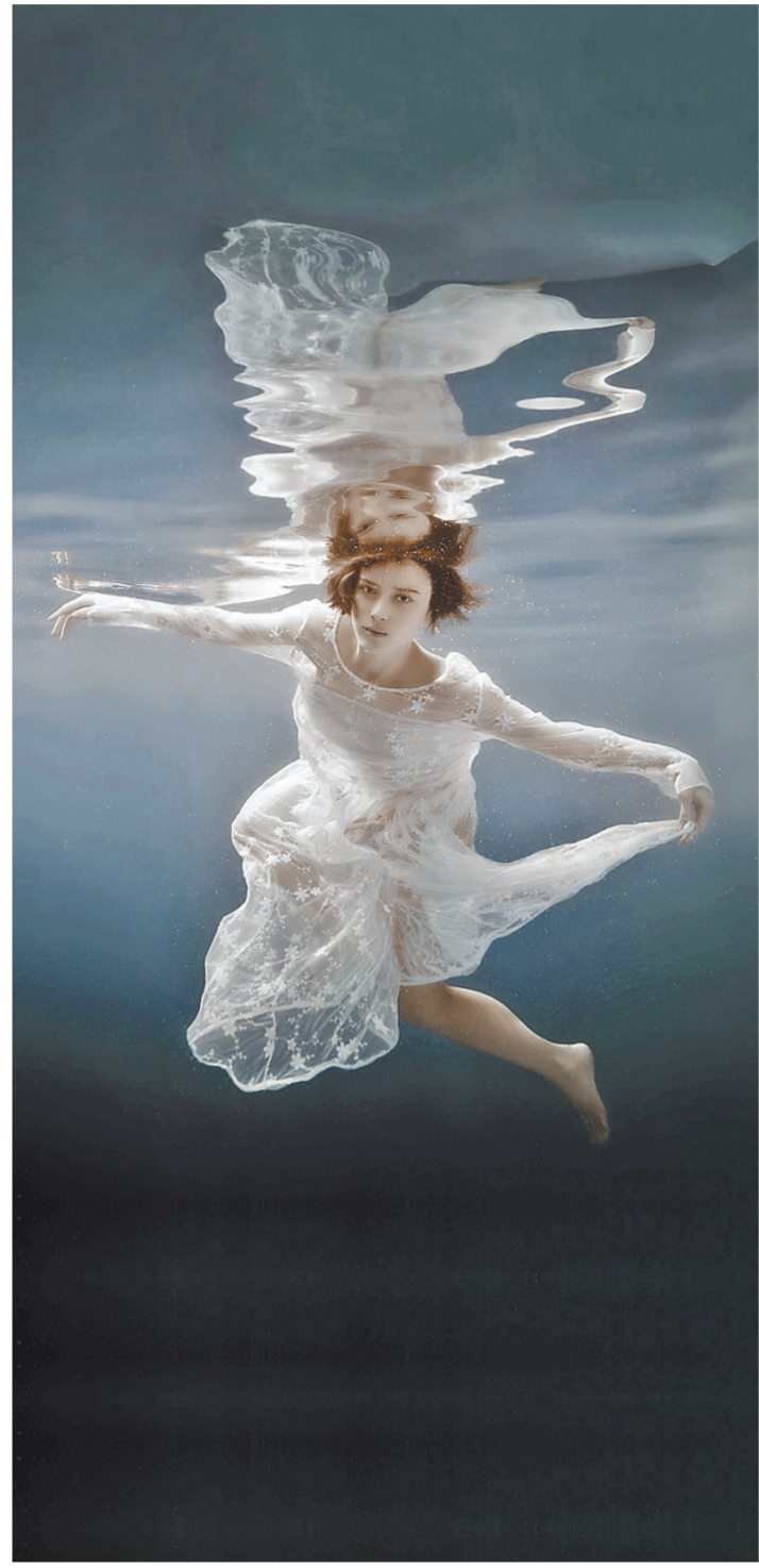
«Русалка» хотя и сказочный сюжет, но и мрачный, местами даже жестокий и, конечно, очень трагический.

«Русалка» — самая знаменитая опера Антонина Дворжака, созданная на либретто писателя Ярослава Квалиты, первая постановка которой состоялась в Праге в 1901 году. Это наиболее часто представляемая чешская опера в мире. Правда, в Советском Союзе она шла редко и под названиями «Большая любовь» или «Любовь русалки», так как у России есть своя «Русалка» — опера, написанная Александром Даргомыжским в 1848 году и впервые поставленная восемь лет спустя в Мариинском театре. Но несмотря на то, что партию Мельника пел даже Ша-