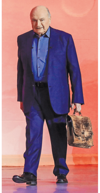
Михаил Жванецкий не переносит безкусия и бездарности — ему от них физически плохо.