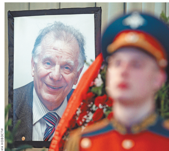
Память академика Алферова обещают достойно увековечить.