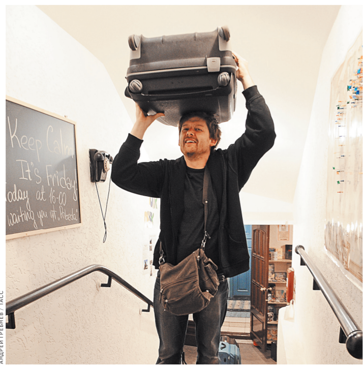
В многоквартирных домах не могут предоставляться гостиничные услуги.