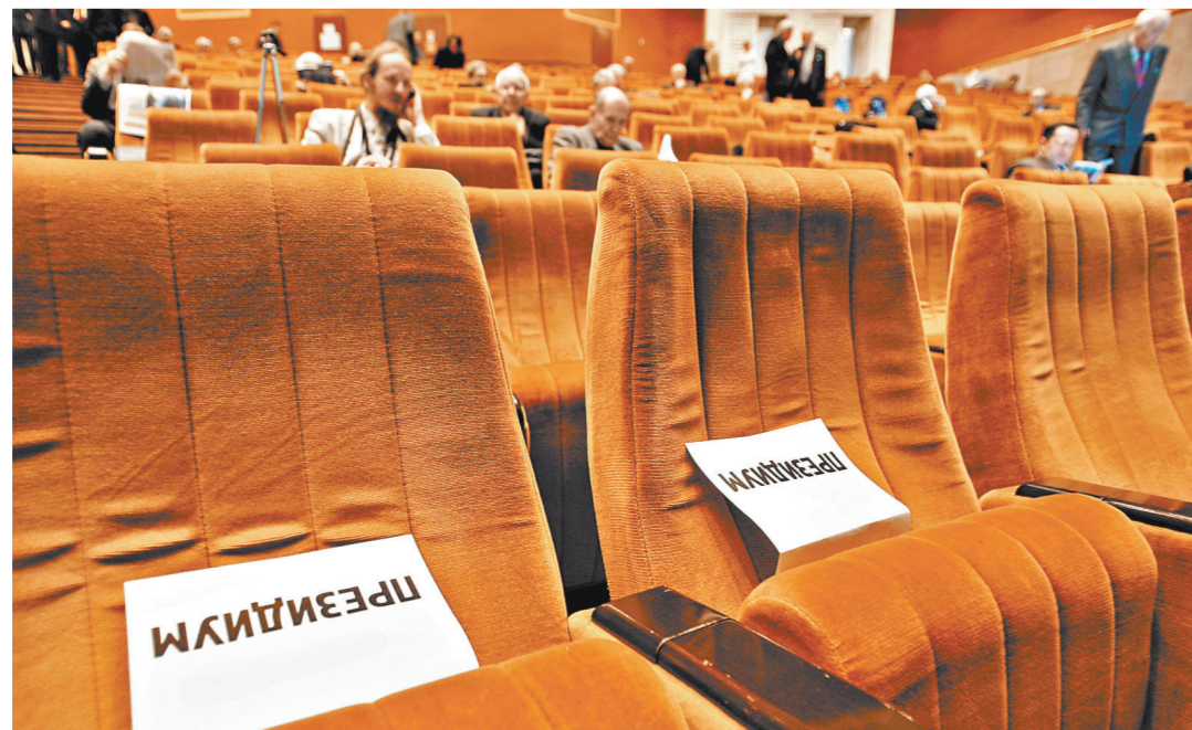
Интерпретация указа готовилась людьми, не знакомыми, как организована наука.

Вопросы повышения заработной платы остальных работников, занятых исследованиями и разработками, находятся в сфере внимания министерства. Прежде всего в последние годы приняты меры по повышению зарплаты всех работников бюджетной сферы. Начиная с 2018 года в федеральном бюджете ежегодно предусматриваются средства на повышение заработной платы работников, не подпадающих под действия указов президента. Кроме того, нацпроектом «Наука» предусмотрена реализация новых исследовательских и научно-технологических проектов, в том числе с учетом привлечения внебюджетных доходов. Это позволит в том числе обеспечить дополнительный рост зарплат всего персонала, занятого исследованиями и разработками. Нам важно, чтобы дополнительные доходы, привлекаемые научными учреждениями, направлялись на выстраивание эффективной системы оплаты труда и мотивации всего персонала, участвующего в исследованиях и разработках.