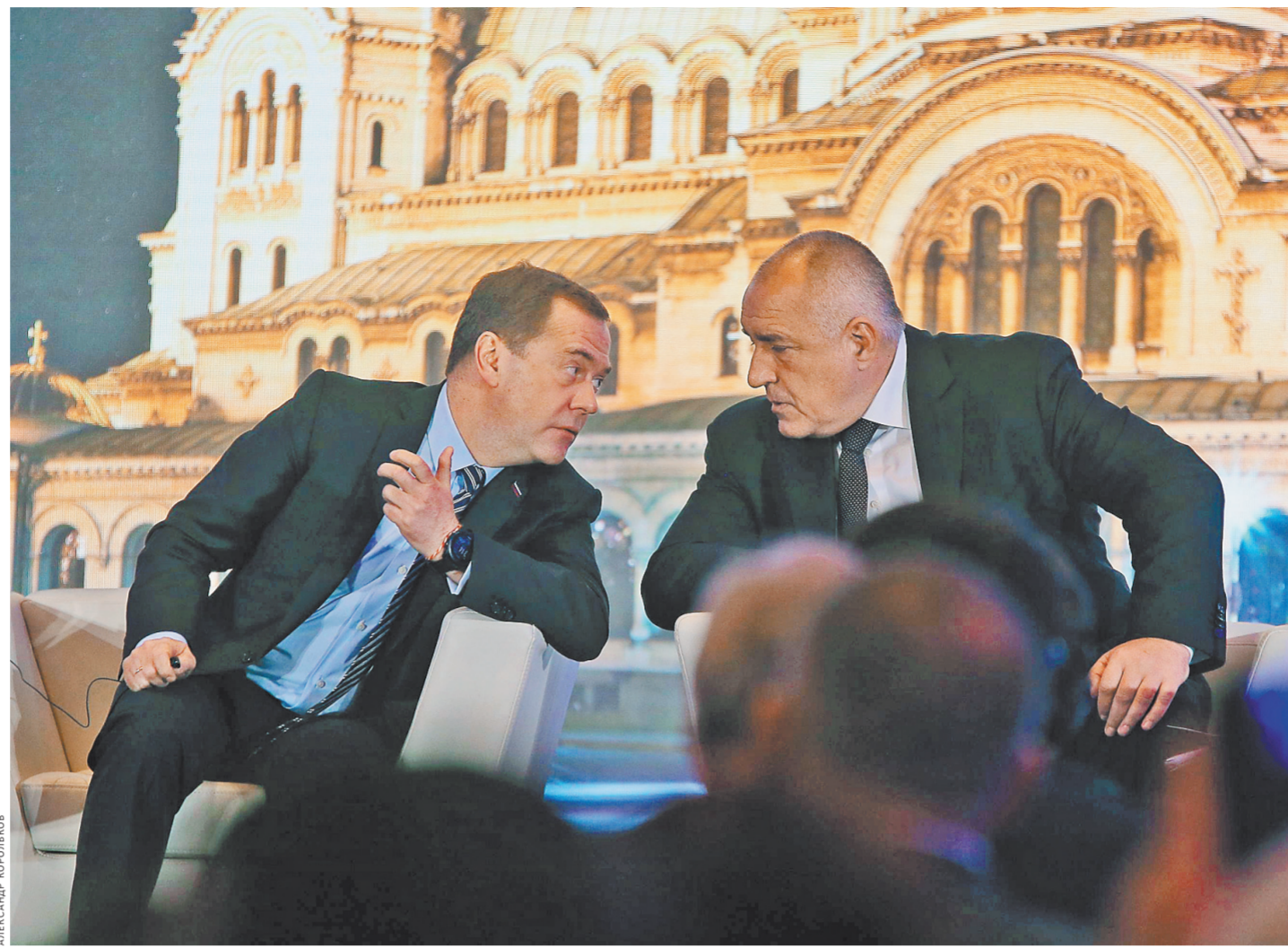
Дмитрий Медведев и Бойко Борисов в ходе российско-болгарского бизнес-форума в сфере туризма.

Завершив переговоры в Болгарии, Дмитрий Медведев направился в Люксембург — страну, которую ему «рекомендовали» как одну из европейских столиц, где большая часть политиков к экономическим санкциям против России относится без особого энтузиазма. В интервью местной газете Luxemburger Wort , премьер признался, что ему импонирует эта верность к традициям внешней политики, ярко выраженная в национальном девизе: «Мы хотим остаться такими, какие мы есть». «Это