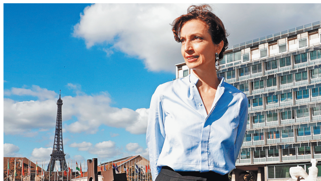
Глава ЮНЕСКО Одре Азуле встретится в России с президентом Путиным и посетит Татарстан.

ОДРЕ АЗУЛЕ: Этот визит очень важен для ЮНЕСКО, для меня лично. Россия — великая страна, которая является важной опорой нашей организации, ее активной участницей. Во время визита я буду иметь честь встретиться с президентом России Владимиром Пу-