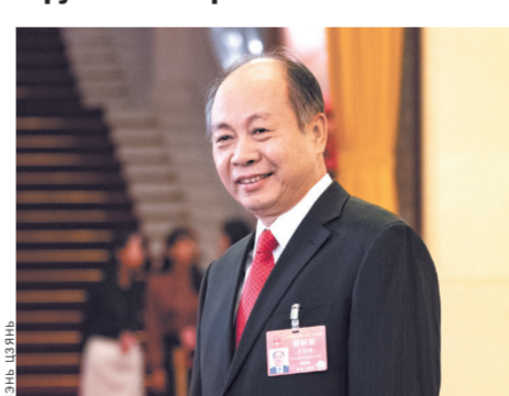
Глава Государственного агентства по сотрудничеству в области международного развития Китая Ван Сяоцао намерен расширить помощь странам-партнерам.

Государственное агентство по сотрудничеству в области международного развития Китая было основано 18 апреля 2018 года. Создание этой структуры можно назвать исторической вехой, которая открывает для Китая новый путь для оказания помощи зарубежным странам. Об этом заявил глава Государственного агентства по сотрудничеству в области международного развития Китая Ван Сяоцао.