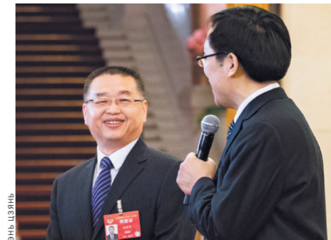
Начальник Государственного управления медицинского обеспечения Китая Ху Цзинлинь планирует изменения в списке лекарств.

ЦК КПК дал указания охватить системой базового медицинского страхования большее количество востребованных лекарств, заявил начальник Государственного управления медицинского обеспечения Китая Ху Цзинлинь во время пресс-подхода. Будут реформированы способы управления действующим списком лекарств, создан механизм внесения изменений в него и запущена работа по изменению списка лекарств на 2019 год. Эти работы планируется завершить в сентябре нынешнего года, отметил Ху Цзинлинь.