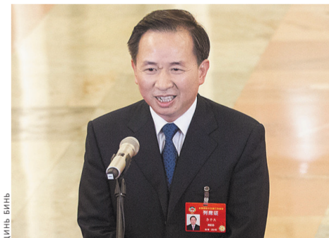
Министр охраны окружающей среды Китая Ли Ганьце обещал впредь не повторять ошибок в решении проблем экологии.

В 2018 году средняя концентрация мелкодисперсных загрязняющих частиц PM 2.5 в 338 китайских городах окружного значения или выше снизилась на 9,3 процента. В Пекине этот показатель упал на 12,1 процента