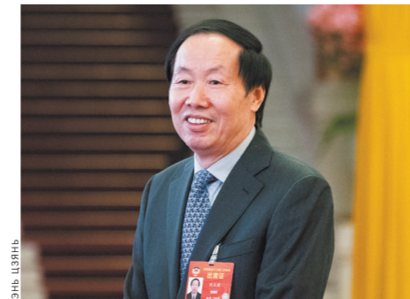
Начальник Государственного управления по делам охраны древних памятников культуры Китая Лю Юйчжу нацелен на модернизацию музейной работы.

В Китае растет спрос на разнообразные и качественные проявления культуры, но музеи и их услуги неотягивают до ожиданий общества. Предстоит проделать еще немало работы, резюмировал Лю Юйчжу.