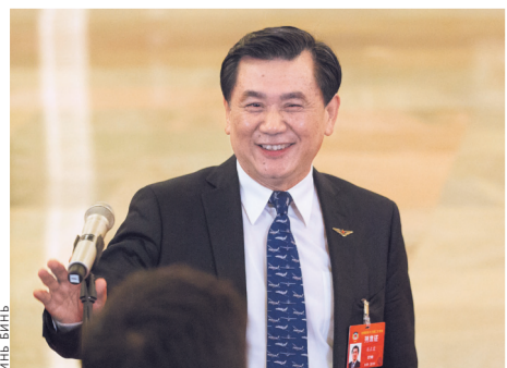
Глава Администрации гражданской авиации Китая Фан Чжэнлинь определил своей главной задачей безопасность полетов.

Безопасность гражданской авиации — жизненно важный фактор, нужно проявлять нулевую терпимость к скрытым угро-