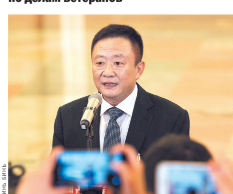
Министр по делам ветеранов Сунь Шаочэн сообщил о подготовке новых законов.

Министерство по делам ветеранов нацелено на защиту законных прав бывших военных. После своего создания ведомство начало работу над проектом закона о защите прав демобилизованных, а также выпустило 12 правовых документов.