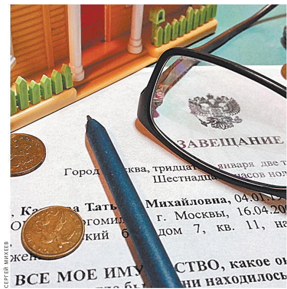
Восстановить сроки принятия наследства может только суд, но причины их пропуска должны быть уважительными.

Но в районном суде дочери не повезло — там ей отказали. Вторая же инстанция — Мосгорсуд — коллег поправила и приняла решение в пользу дочери. Отношения действительно были сложные, и отец сам не поддерживал связь с ребенком. По мнению апелляции, дочка пропустила срок по вине тети, которая сознательно не сообщила нотариусу о племяннице, чтобы завладеть недвижимостью в обход наследника первой очереди. В итоге Мосгорсуд восстановил дочке срок на принятие наследства и объявил ее владелицей квартиры и дома.