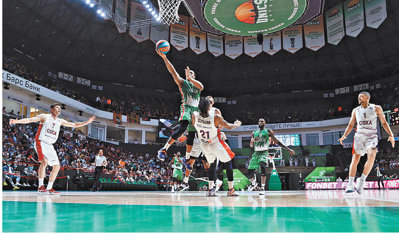
УНИКС снова не нашел что противопоставить московским армейцам. Теперь спастись в финальной серии будет невероятно сложно.

Женская сборная России по баскетболу в рамках подготовки к стартующему 17 июня на площадке Испании и Франции финальному турниру чемпионата Европы 2021 провела два контрольных матча в столице Сербии Белграде.