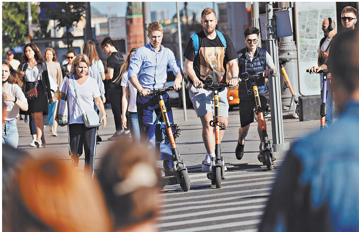
Эксперты считают, что если электросамокаты передвигаются рядом с пешеходами, то и скорость их должна быть пешеходной.

Как было сказано в сообщении пресс-службы этой организации, «высокая скорость передвижения данных транспор-