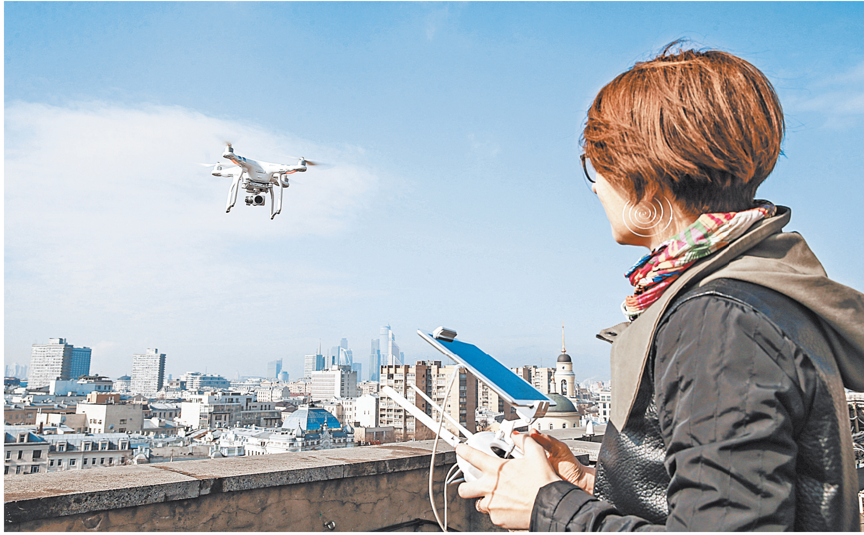
АРИН ГОРБАЧЕВ / РАС