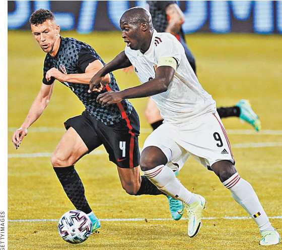
Бельгия подтвердила статус лучшей сборной мира в рейтинге ФИФА, одолев финалиста первенства планеты-2018 Хорватию.

Тем временем продолжают кипеть страсти вокруг Кубка Америки. Как известно, на прошлой неделе Южноамериканская конфедерация футбола (КОНМЕБОЛ) перенесла турнир из Аргентины в Бразилию.