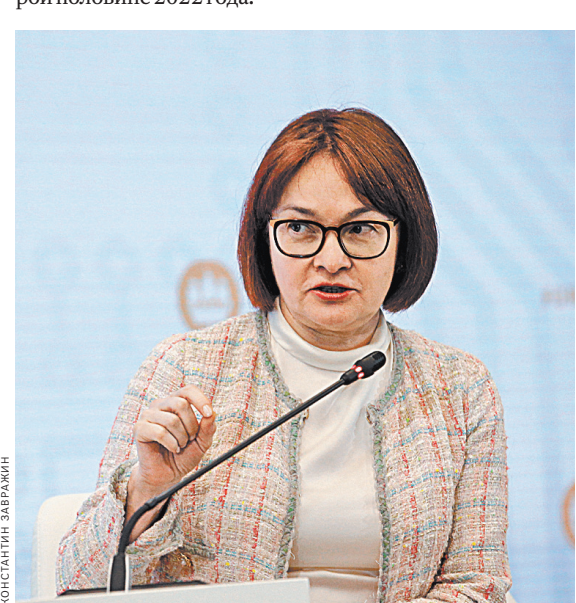
Эльвира Набиуллина: Если сравнить уровень ключевой ставки с инфляцией, то денежно-кредитная политика остается мягкой.

Впрочем, ЦБ в пятницу может и сократить шаг повышения ставки до 0,25 процентного пункта, кроме того, помимо самого решения будет важна и тональность заявления регулятора, говорит главный стратег АТОН Александр Кудрин. Такого же прогноза по ближайшему изменению ставки придерживается и главный аналитик Совкомбанка Михаил Васильев. По его прогнозу, инфляция достигнет пика этим летом и дойдет до 6,1–6,3%. Он ожидает, что к концу года инфляция замедлится до 5,1–5,3%, а к целевым 4% рост цен вернется только во второй половине 2022 года.