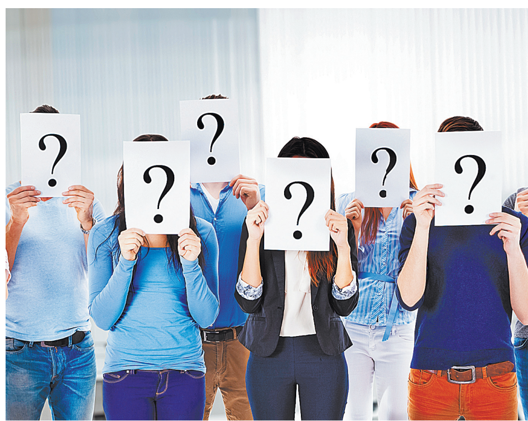
Если кто-то пытается скрыть свой номер, сотовый оператор обязан прервать этот звонок.

За нарушение законодательства о рекламе на юридических лиц может быть наложен штраф от 100 тысяч до 500 тысяч рублей. Правда, как поясняют эксперты, поскольку согласие абонента на получение рекламных рассылкок нередко «спрятано» в тексте договора на услуги, гражданин порой даже не понимает, что он одобрил получение SMS-рассылки.