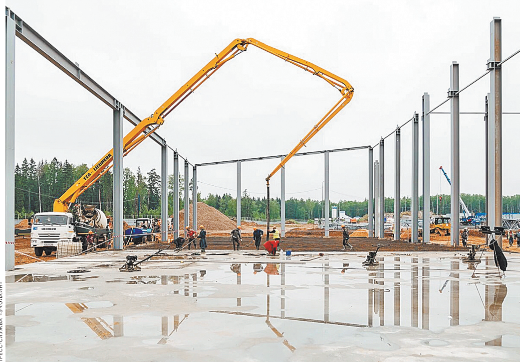
Так строят экологию. На этом предприятии будут применяться технологии, которых в России еще нет.

«Мы начали с двух рейсов. Сейчас их уже пять. И думаем о том, чтобы ввести еще пять таких же маршрутов», — говорит Кротова. ●