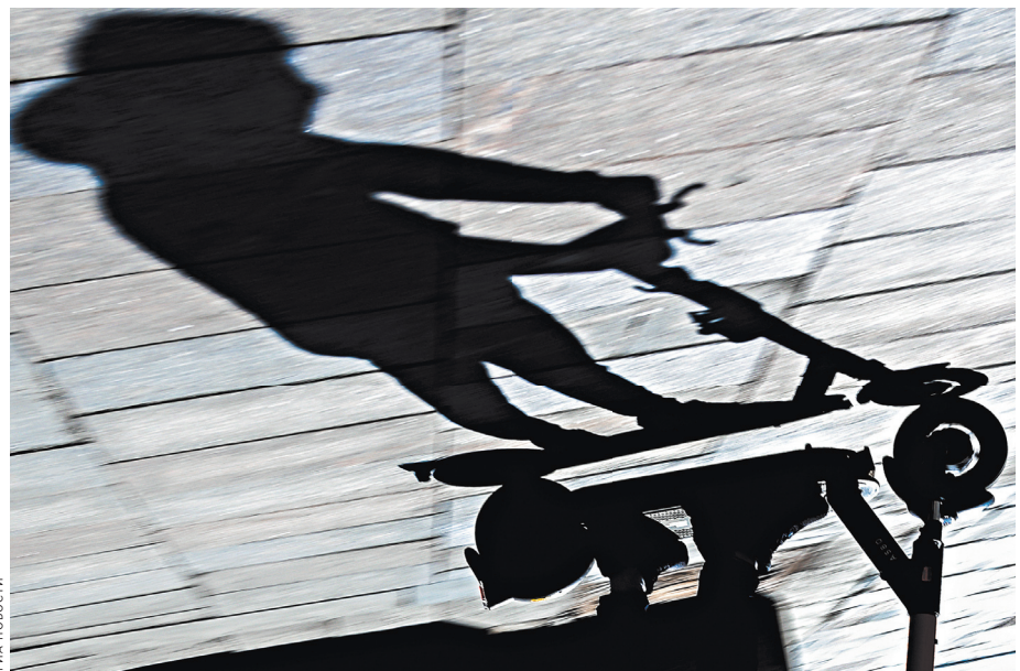
Тень электросамокатчика за спиной становится настоящим кошмаром для пешеходов.

Подобные предложения в последнее время приходится слышать достаточно часто. В том числе и от руководителей, отвечающих за организацию дорожного движения в городах. Звучит это примерно так: «Электросамокат должен двигаться по тротуару со скоростью людского потока».