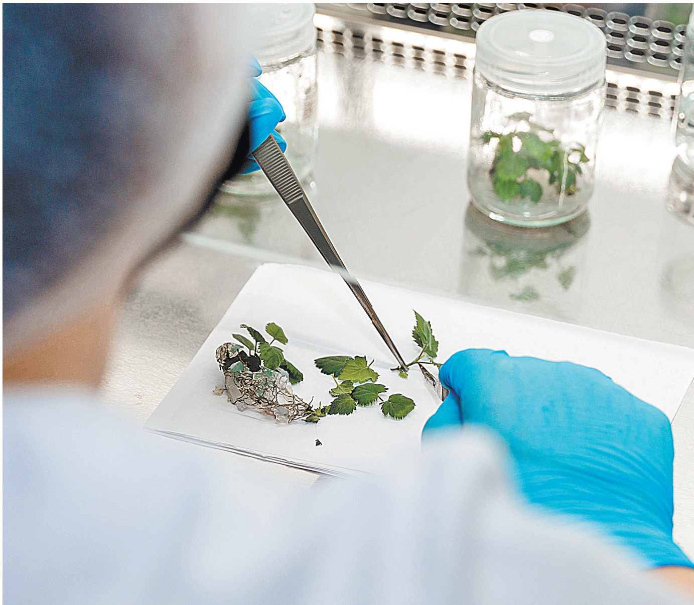
«Агрополис» — это инновационная сельскохозяйственная долина Крымского федерального университета. Здесь ученые производят безвирусный посадочный материал, занимаются микроклональным размножением растений, их селекцией, диагностикой и оздоровлением, генетической трансформацией и редактированием генома. В качестве модельных культур выбрали землянику, ежевику и виноград.

Утвержден Реестр новых и наилучших технологий, материалов и технологических решений повторного применения, в котором уже содержится 789 наименований материалов, более 250 конструкций и 360 технологий. Он создан в рамках нацпроекта «Безопасные качественные дороги», один из приоритетов которого — повышение качества дорожных работ.