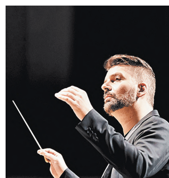
Руководитель EIC Маттиас Пинчер дирижирует и собственным сочинением — трио Beyond II.

Когда Ensemble intercontemporain (EIC) создавался в 1976 году, он был первым в мире ансамблем современной музыки с постоянным составом. Среди его солистов были пианист Пьер-Лоран Эмар и виолончелист Жан-Иен Керас. За почти полвека ансамбль исполнил более полутора тысяч сочинений, созданных в последние 120 лет. В прошлом году EIC выступил в Москве на VII Международном фестивале актуальной музыки «Другое пространство». Но тот концерт на фоне второй волны пандемии прошел в условиях серьезных ограничений: зал Чайковского был заполнен на 25%, а из тридцати музыкантов ансамбля в Москву смогли прилететь лишь восемь. На открытии юбилейного сезона Московской филармонии ансамбль выступит в пол-