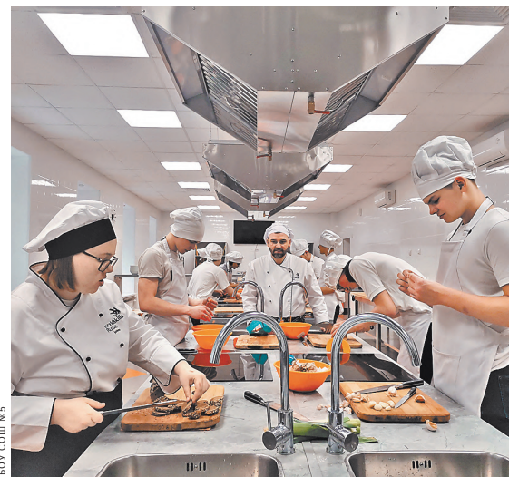
Профильные классы будут открываться в сотрудничестве с ведущими вузами и колледжами.