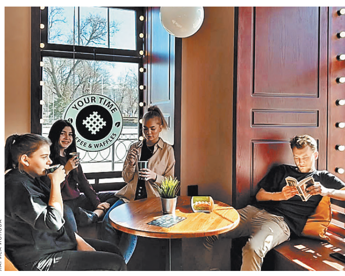
С дизайном кофейни в Новочеркасске помог центр «Мой бизнес».