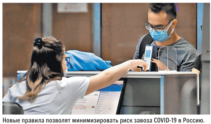
Новые правила позволяют минимизировать риск завоза COVID-19 в Россию.

в Россию, могут лишь лаборатории, прошедшие аккредитацию и соответствующие российским стандартам. Приложение используется для предъявления отрицательных результатов исследований на коронавирус при пересечении российской границы в определенных пунктах пропуска. Кроме данных о действующих в той или иной стране ЕАЭС санитарно-эпидемиологических правилах и нормах «Путешествие без COVID» содержит список верифицированных лабораторий. В приложении возможно сохранить результаты тестов и QR-коды. Функционал позволяет ответственным лицам проверять результаты теста на въезде в страну как визуально (зеленый цвет QR-кода), так и с помощью стандартного считывателя QR-кодов. ●