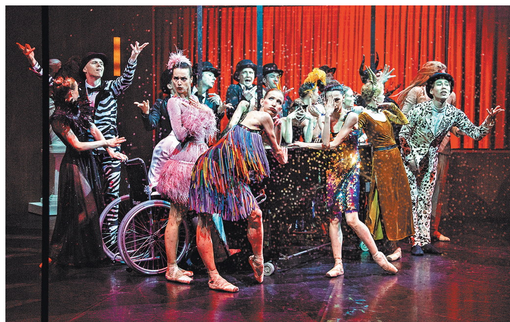
Среди недавно состоявшихся премьер театра Сац — балет «Карнавал» на музыку Сен-Санса и Шумана.

Театр по традиции 1 сентября проведет «День первокурсника» и праздник посвящения юных зрителей в театральные и покажет на Малой сцене спектакль «Королевский бутерброд». Как говорится, «Приятного аппетита и приятных театральные впечатлений!».