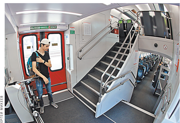
В двухэтажном поезде в любой час пик сидячих мест хватит всем пассажирам.

Глава дептранса Максим Ликсутов говорит, что вместе с коллегами из РЖД на МЦК уже дважды сокращали интервал движения. «На сегодня 4-минутный интервал — предельно возможный для существующей инфраструктуры», — объясняет он. — Но в то же время ищем и альтернативные решения. Одно из них — закупка более вместительных двухэтажных поездов. В качестве эксперимента выпустили на кольцо шестивагонный поезд «Штадлер». У него шире двери, а количество сидячих мест больше на 70%. При этом в комфорте «Ласточкам» они не уступают.