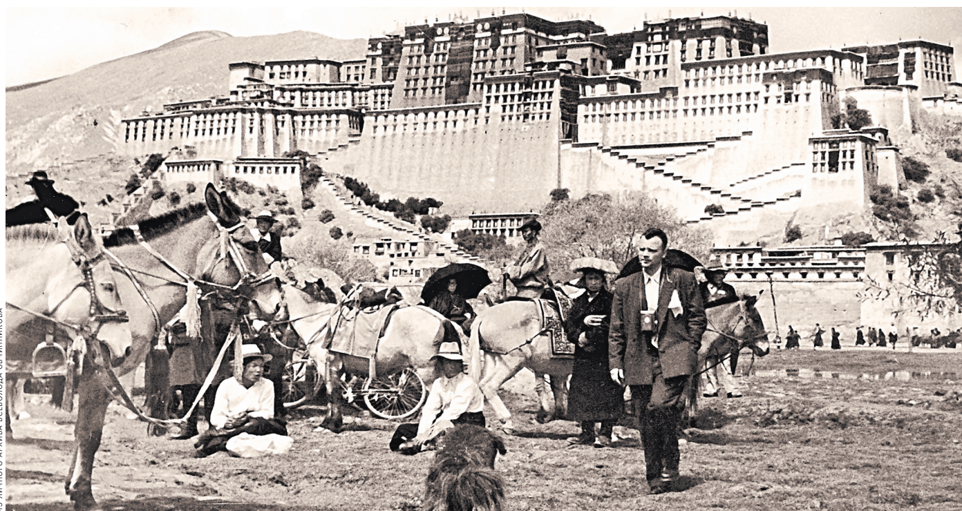
Всеволод Владимирович до мелочей знал места, где работал, изучал их буквально своими ногами. Например, в китайской Лхасе он бывал не единожды.

— В советское время многих потрясли книги Всеволода Владимировича «Ветка сакуры», «Корни дуба», «Горячий пепел» — все связано с Японией, Китаем, Юго-Восточной Азией. Он почти 40 лет проработал в газете «Правда». Это был высший пилотаж в печатной журналистике работать с «Правдой» в таких самых, наверное, уникальных и экзотических местах. В то время вряд ли кто-то из советских людей мог вот так свободно поехать в эти страны. И глазами Овчинникова миллионы наших граждан смотрели на действительность этого региона. Конечно, Всеволод Владимирович войдет в историю российской журналистики. И когда меня спрашивают, каким образом можно стать журналистом-международником, то я нашим молодым коллегам советую обязательно читать такие произведения и впитывать этот бэкграунд, который обязательно пригодится в работе. Нужно понимать этот стиль, понимать, как писали мастера своего дела, лучшие мастера международной журналистики.