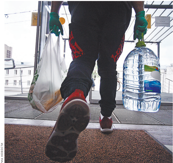
Маркировка вводится для борьбы с контрафактом и фальсификатом: на рынке воды такая продукция может составлять до четверти оборота.

С 1 сентября 2021 года производители бутилированной воды должны будут зарегистрироваться в системе мониторинга за оборотом товаров, подлежащих обязательной маркировке. Подать заявление будет необходимо в течение семи дней с начала оборота продукции. Это предваряет обязательную маркировку бутилированной воды: для минеральной воды она станет обязательной с 1 декабря 2021 года, для остальной бутилированной воды — с 1 марта 2022 года. Маркировка необходима упакованную воду, включая природную и искусственную минеральную, газированную, без добавления сахара и других подслащающих или вкусоароматических веществ. Упакованная вода пополнила список продукции, подлежащей обязательной маркировке, в феврале 2021 года. Эксперимент по маркировке начался еще 1 апреля прошлого года и должен был завершиться 31 марта 2021 года. Но кабмин принял решение продлить его до 1 июня 2021 года. Государство вводит цифровую маркировку для борьбы с контрафактом и фальсификатом. По разным оценкам, доля нарушений на российском рынке воды может составлять от 0,2% до четверти от всего оборота. ●