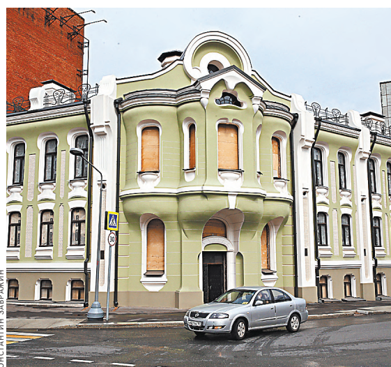
А что будет в этом доме, когда окончательно завершится его реставрация, решат сами москвичи.

После реставрации дом Абрикосовых откроется для рядовых горожан. Обсуждается два варианта. Первый — обустроить в нем общественное пространство. Второй — передать помещение музею шоколада. ●