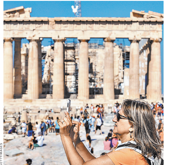
На групповую экскурсию на открытом воздухе в Греции теперь допускают максимум 40 человек.

На турпотоке эти меры вряд ли заметно повлияют. Количество рейсов в Грецию ограничено, а спрос в «бархатный сезон» большой. При этом требования к туристам в Греции теперь оказались строже, чем во многих других странах. Например, сейчас никаких ограничений нет в Турции. Применяются только сертификаты о вакцинации (признается «Спутник V») или ПЦР-тесты при въезде, говорит вице-президент АТОР Дмитрий Горин. Такие же правила на Кипре. В Египте при въезде используется сертификат о вакцинации или ПЦР-тест, а перемещаться по стране можно свободно. Но для въезжающих в Шарм-эль-Шейх в случае путешествия по стране придется приобретать визу. Вообще нет никаких ограничений в Мексике и Доминикане.