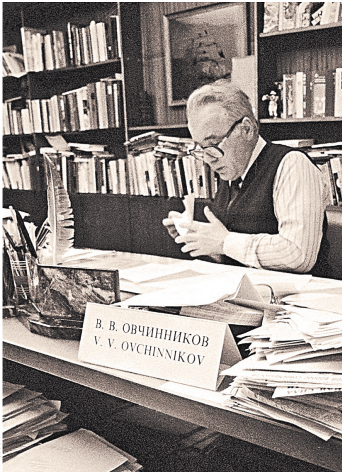
Политический обозреватель газеты «Правда» Всеволод Овчинников в своем рабочем кабинете.

— Всеволод Овчинников — корреспондент «Правды», выдающийся, на мой взгляд, журналист, японист. Провел довольно много времени в Японии и написал книгу об этой стране. Естественно, я ее читал, прежде чем вообще братья за Японию, читал очень подробно и детально, и очень многое, конечно, сохранилось. Он прекрасный журналист, он многое очень точно подметил, и поэтому эта книга лично мне помогла. Он японист, он изучал эту страну, у него совершенно другое представление об истории Японии, чем у меня, я тут новичок, а он знаток. Книга «Ветка сакуры» — прекрасная, и если вы ее не читали, то я вам очень советую. На мой взгляд, это посылнее, чем его же книга «Корни дуба» об Англии. Все-таки про Англию мы многое знаем и много читали, а про Японию — это совсем другое в нашем преломлении. Так что читайте книгу Всеволода Овчинникова. Из интервью на pozneronline.ru