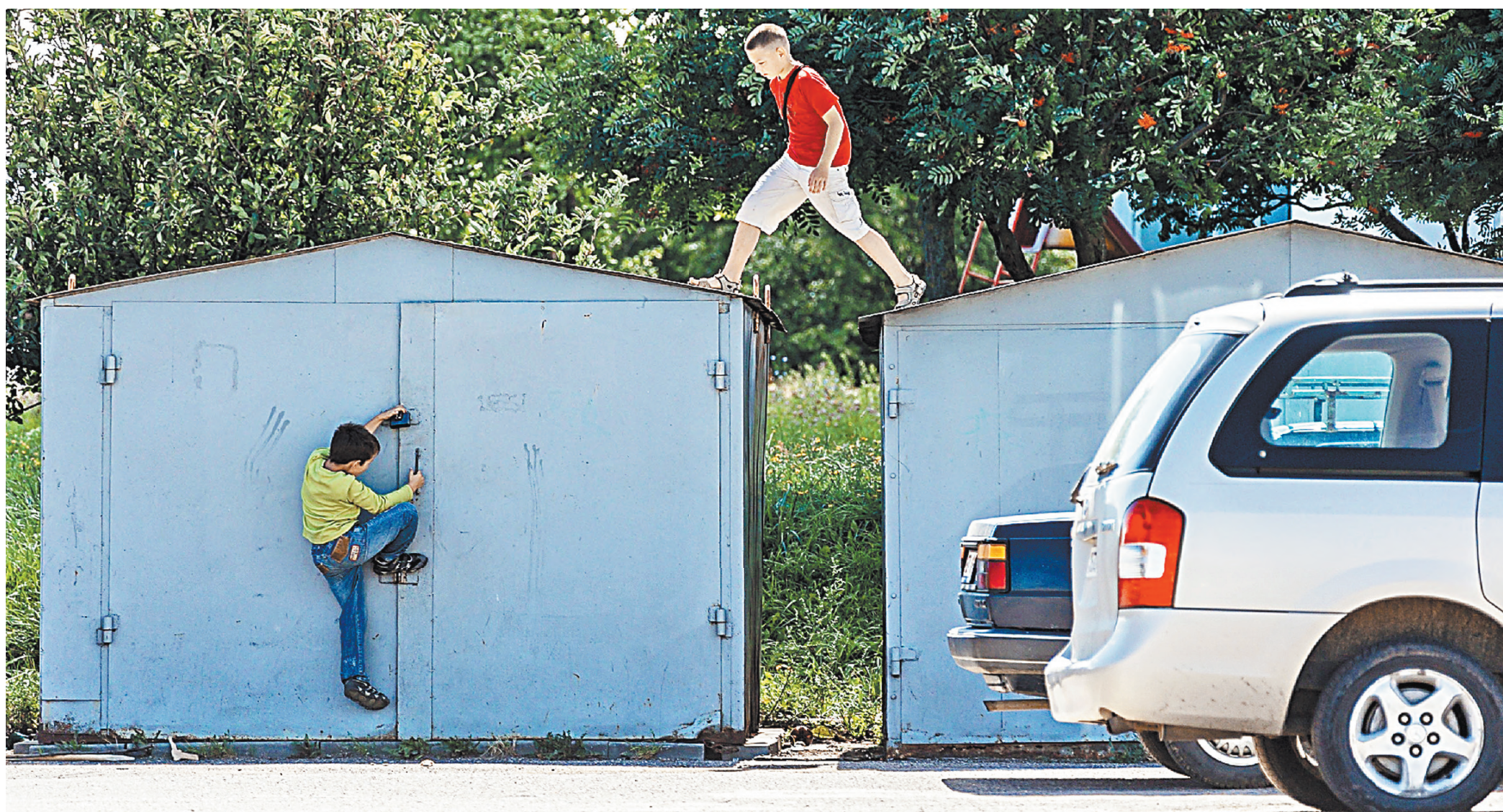
Легализовать гараж можно при соблюдении трех условий: он капитальный, не признан самовольной постройкой и построен до 29 декабря 2004 года.