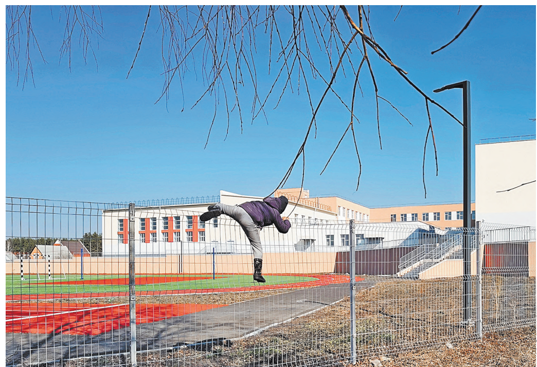
Так хочется попасть в эту школу, что и высокий забор местной ребятне не помеха.