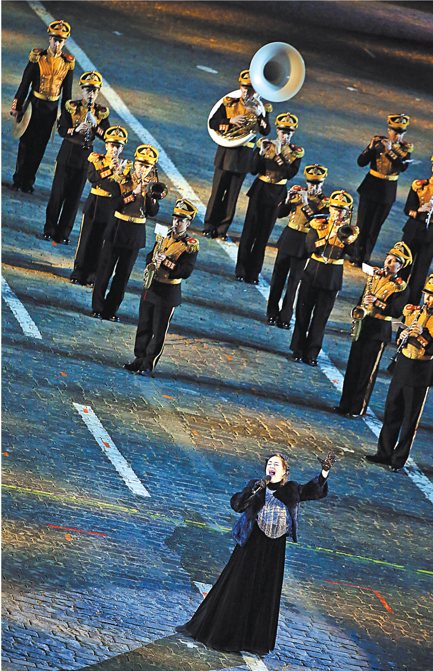
Красная площадь: народная артистка Тамара Гвердцители и Центральный военный оркестр под руководством заслуженного артиста Сергея Дурьгина. Сакральное место, щемящее контрольно и безупречное исполнение.

Сегодня, 1 сентября, на Красной площади выступит Хор Турецкого, 4 и 5 сентября поет фронтмен «Рамштайт» Тиль Линдеманн. На правах ветерана-вокалиста «Спасской башни» можете дать коллегам пару технических советов? Как сохранить голос, если не дай бог дождет. Вы ведь пели под дождем.