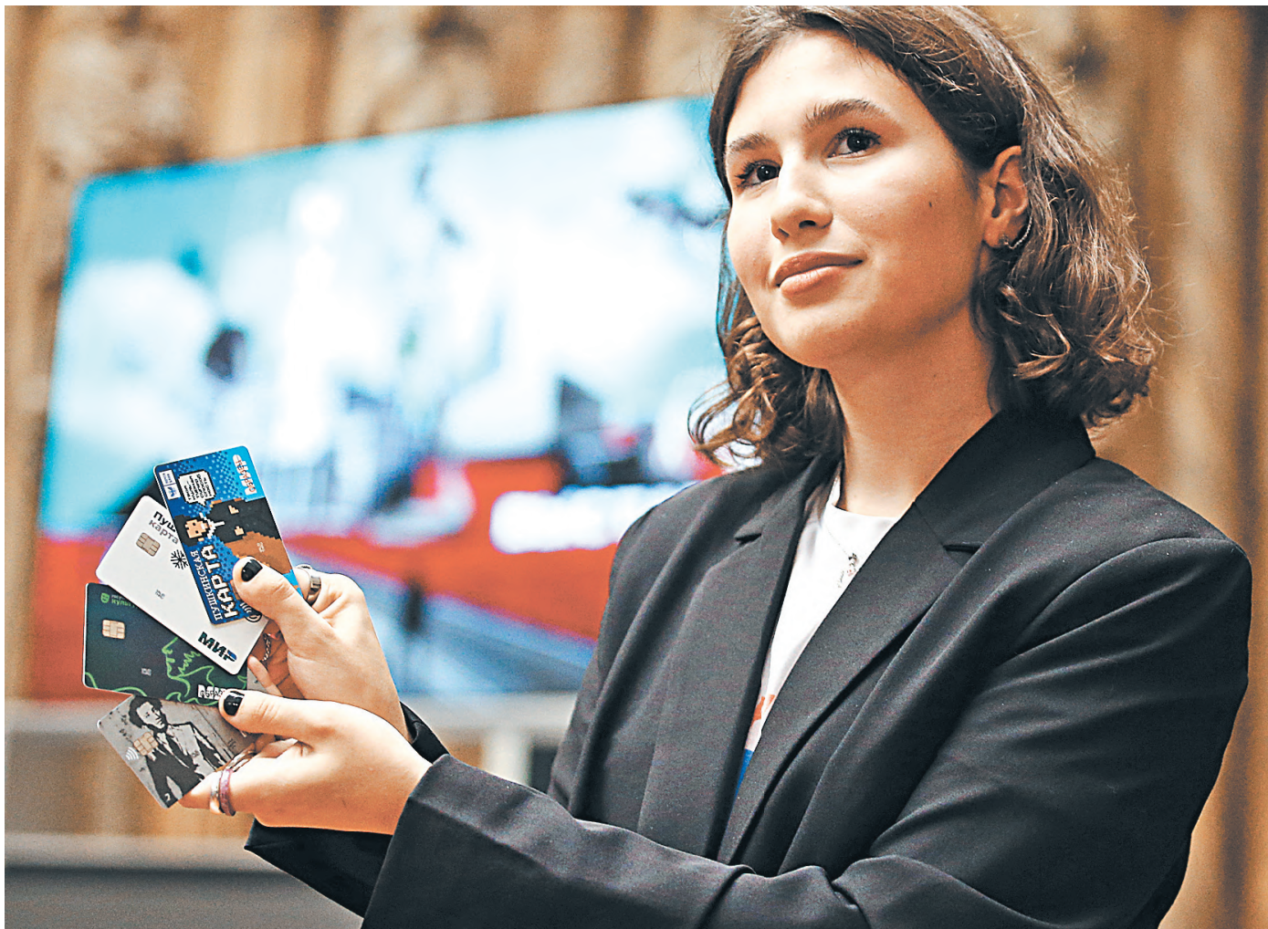
Новая программа в сфере культуры «Пушкинская карта» стартует 1 сентября. Благодаря проекту 13 миллионов молодых россиян от 14 до 22 лет смогут получить специальные карты, на баланс которых зачислят 3000 рублей. Эти деньги можно будет потратить только в музеях, театрах, концертных залах и библиотеках.

Кстати, в средней школе, которая станет следующей ступенью для младшеклассников, возможностей больше. С 2017 года она участвует в республиканской программе «IT-вектор образования» и является двукратным победителем Фонда президентских грантов. Здесь работает и «Точка роста» — центр образования цифрового и гуманитарного профилей, еще одна часть национального проекта. ●