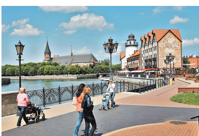
Одно из главных туристических мест Калининграда — Кенигсбергский кафедральный собор и Рыбная деревня.

Калининград вошел в топ востребованных осенних направлений для путешествий по России. Отели на морском побережье в бархатный сезон уже забронированы на 80 процентов, в самом Калининграде — на 75–78. А в выходные дни сентября и октября гостиныцы заняты полностью.