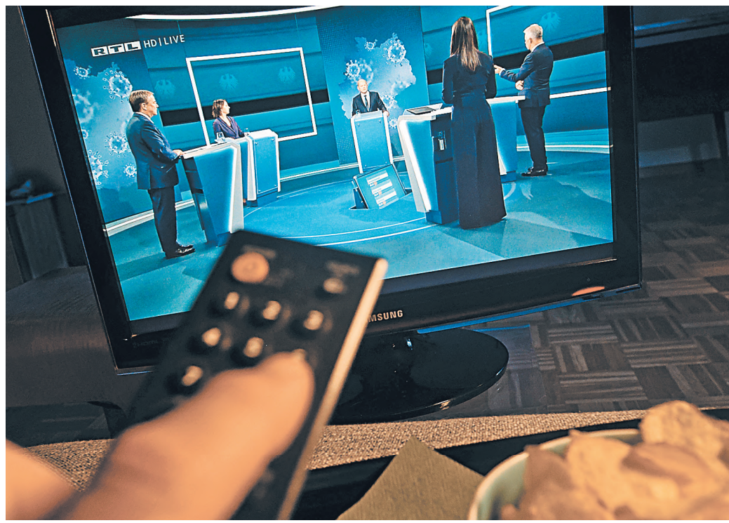
Кандидаты Армин Лашет от ХДС, Анналена Бербок от «Зеленых» и Олаф Шольц от СДПГ (слева направо) приняли участие в теледебатах «на троих».

Вообще-то христианские демократы уже давно опубликовали свою предвыборную программу, однако далеко не каждый рядовой избиратель способен осилить почти 140 страниц текста. Поэтому на финишной прямой Лашет обозначил пять ключевых тем, волнующих граждан. О них он собирается рассказывать в течение ближайших двух недель вместе с партийными экспертами. Первое выступление в Доме Коирада Аденауэра (берлинской штаб-квартире Христианско-демократического союза) было посвящено проблемам климата, на очереди — цифровизация, снижение налогов, стимуляция экономики