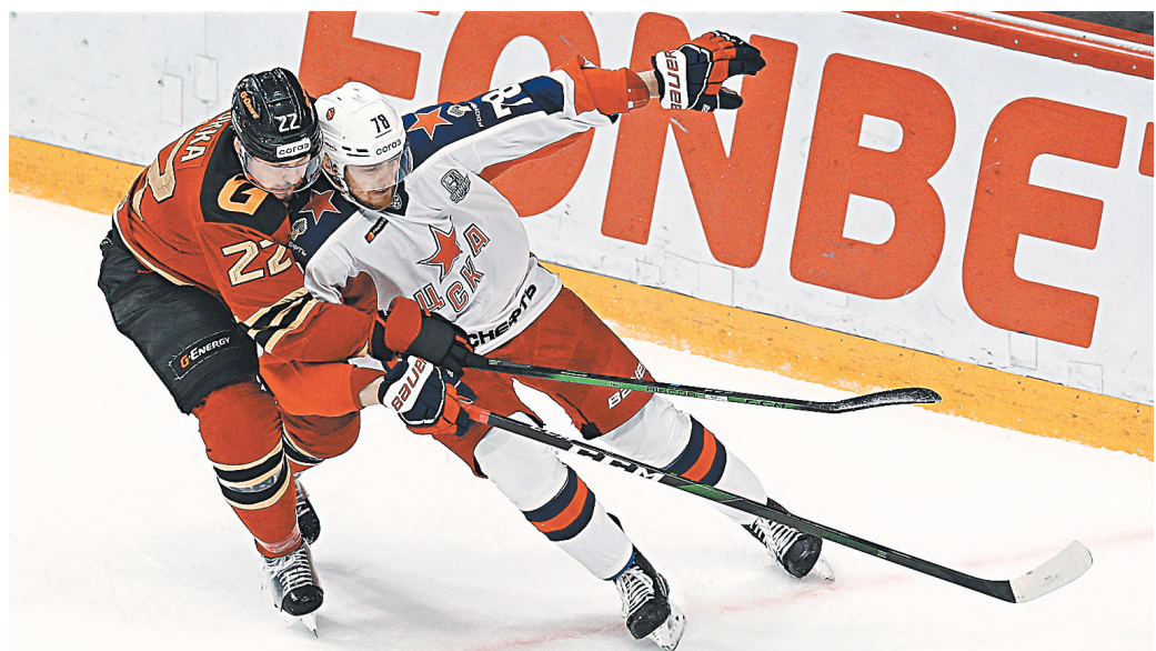
Матчем «Авангарда» и ЦСКА завершился прошлый сезон и начнется новый.

«Авангард» (Омск) «Адмирал» (Владивосток) «Амур» (Хабаровск) «Барыс» (Астана, Казахстан) «Салават Юлаев» (Уфа) «Сибирь» (Новосибирск)