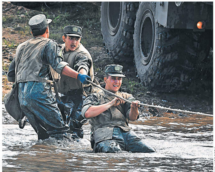
Войсковых офицеров в первую очередь привлекут для проведения практик, стажировок, учений и занятий курсантов военных вузов на полигонах.

Он отдельно остановился на ситуации в Афганистане. Министр назвал ее критической. «Люди пытаются сбежать оттуда, даже ценой собственной жизни», — отметил Шойгу. Министр поблагодарил наших летчиков и медиков за оперативную и четкую работу при выполнении поручения президента России — эвакуации из Кабула нескольких сотен граждан пяти стран. ●