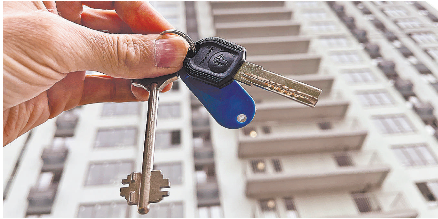
В Москве, Санкт-Петербурге, Московской и Ленинградской областях для использования льготной ставки кредит должен быть до 30 млн рублей, в остальных регионах — до 15 млн рублей.