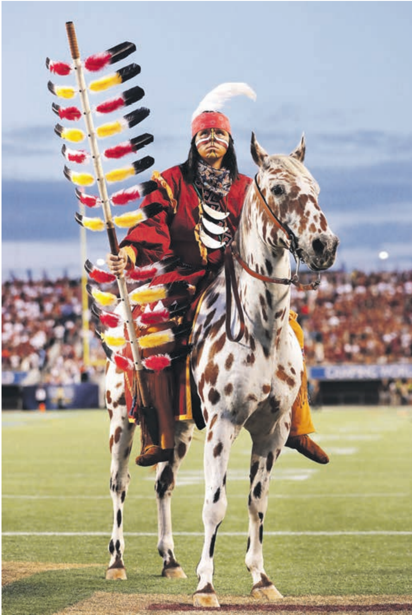
ТОЧКА Сегодня точку в номере ставит легендарный вождь индейцев Оцеола на верном коне Ренегате, открывающий первый уик-энд студенческого футбольного сезона в американском штате Флорида...