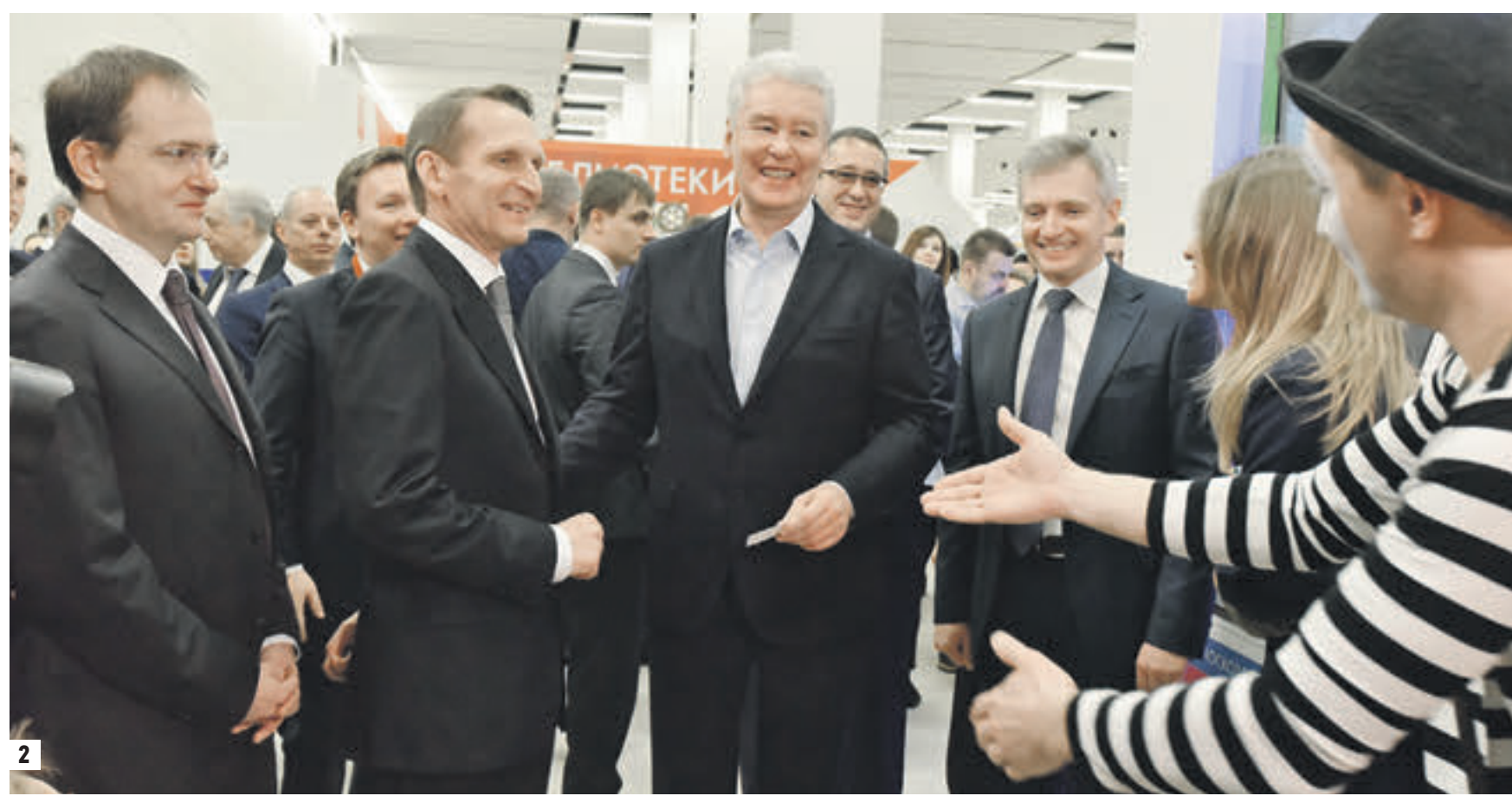
27 марта 07:10 «Ночь театров» в Манеже. Зрители фотографируют голографическую проекцию балерины (1) 25 марта 11:25 Слева направо: министр культуры России Владимир Мединский, председатель Госдумы Сергей Нарышкин, мэр Москвы Сергей Собянин, председатель Мосгордумы Алексей Шапошников (на втором плане) и министр правительства Москвы, глава Департамента культуры Александр Кибовский на церемонии открытия Московского культурного форума (2)

ПЕРСПЕКТИВА На три дня Манеж стал площадкой, объединившей все виды искусств. Масштабное событие позволило властям и деятелям культуры обсудить актуальные вопросы и повестку на будущее.