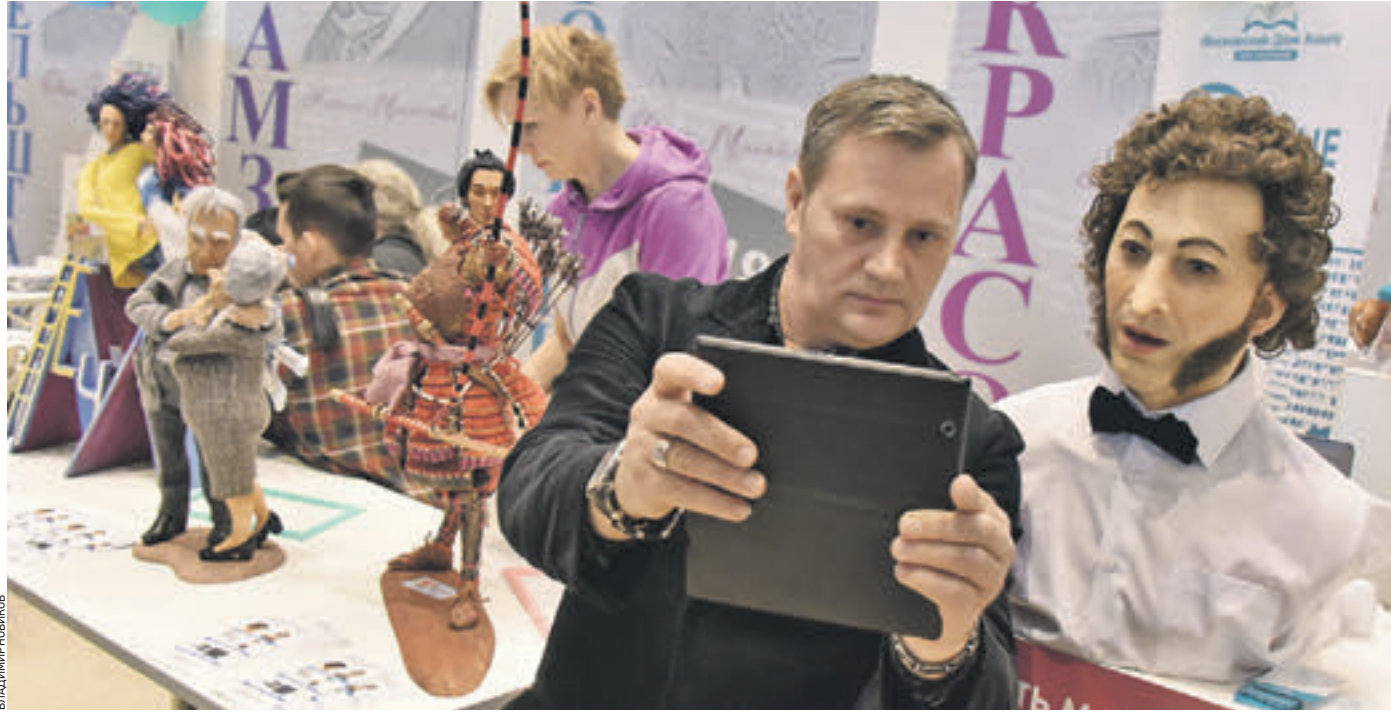
25 марта 15:23 На Московском культурном форуме у посетителей была возможность пообщаться с роботизированным Александром Пушкиным...