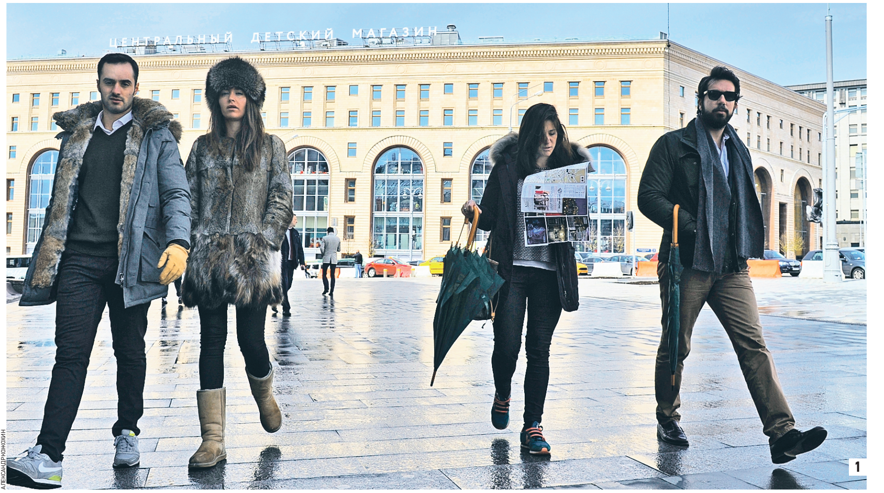
11 мая 2017 года 10:45 Итальянские туристы гуляют на Лубянке — участок пешеходной зоны только что сдали после реконструкции (1) Проект благоустройства улицы Тверская (2) Проект благоустройства участка пешеходной зоны у станции метрополитена «Краснопресненская» (3)