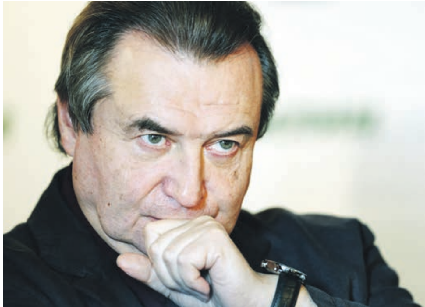
16 сентября 2017 года 17:00 Президент Международного кинофестиваля документальных, короткометражных, анимационных и экспериментальных фильмов «Послание к человеку» Алексей Учитель

Наверняка вы слышали, что Кирилл Серебренников тоже снимает фильм о Викторе Цое и что Борис Гребенников, прочитав сценарий, сказал, что «Цюэ эта картина не имеет отношения». Вы не боитесь, что и в вашей ленте друзья Цоя могут отозваться так же? Я не видел фильм Серебренникова и ничего комментировать не могу. Скажу одно: режиссер не должен ничего бояться. Мне кажется, чтобы снимать фильм о той музыкальной эпохе, необходимо было в ней вариться и, конечно же, хорошо ее знать. Какие из работ современных режиссеров вызывают у вас интерес? А возможно, и зависть? К счастью, зависти я лишён. Мне понравилась последняя