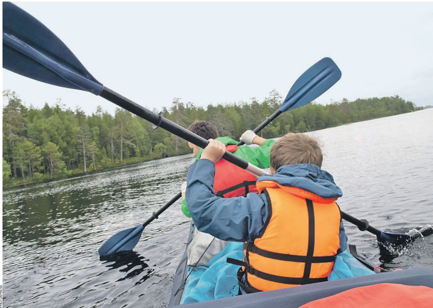
3 сентября 2018 года. Туристы сплавляются на байдарке по одному из озер Карелии. По мнению экспертов, именно спортивные маршруты будут в ближайшее время набирать популярность: пляжным отдыхом москвичи «наелись»

туризм Впереди — майские праздники. Они по сути открывают туристический сезон — 2019. Куда поедут москвичи нынешним летом? Во сколько может обойтись путешествие?