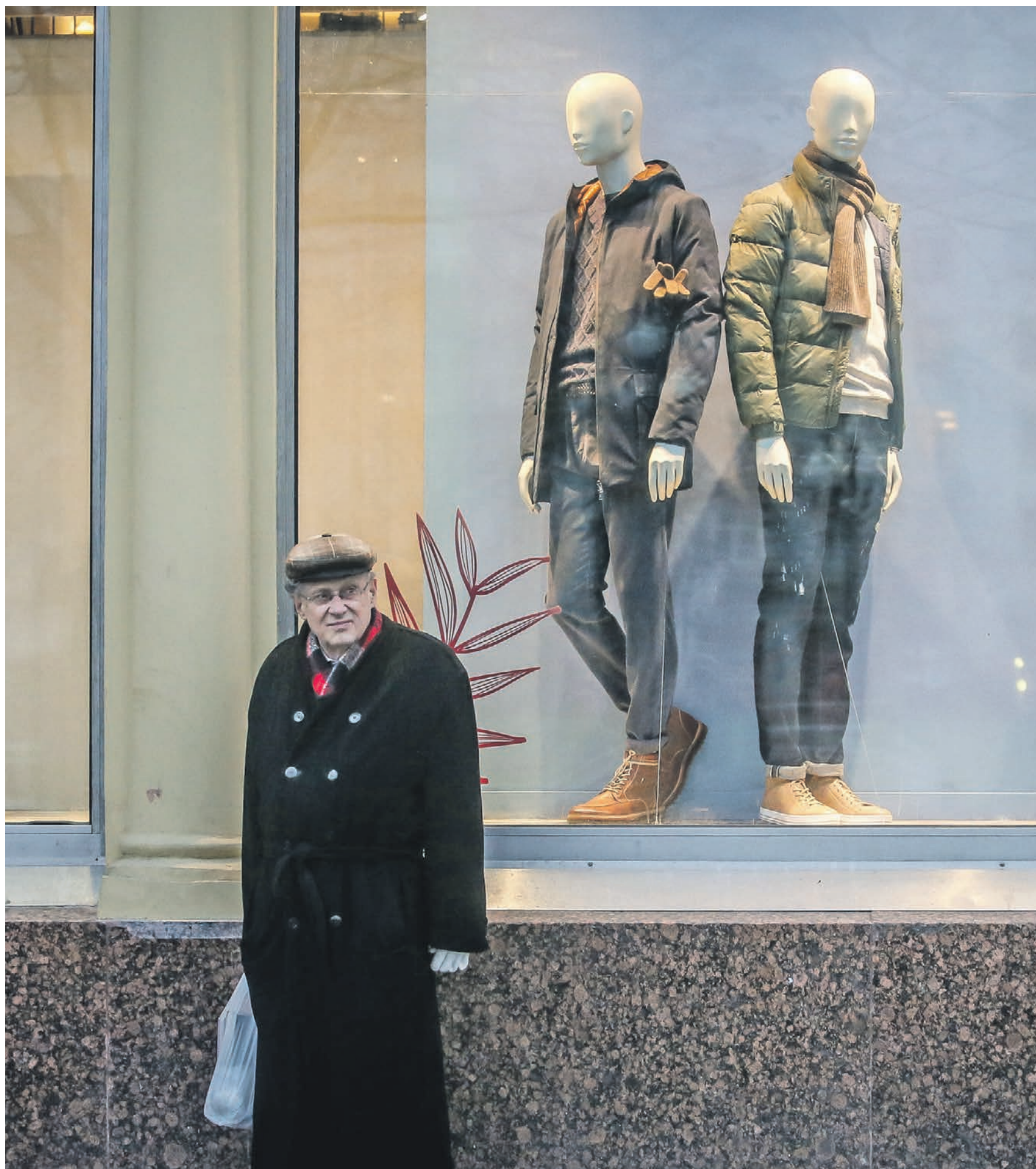
11 ноября 2017 года. Прохожий у крупного магазина одежды на Тверской улице

— Проблема в нашем обществе состоит вот в чем, — пояснил Федоров. — У нас все ругают власти. Чиновничество везде одинаково, а вот общество — разное. При становлении современной нам России общество было атомизировано, каждый был сам за себя, и институты, призванные защищать людей от такого раздела имущества, не работали. Стремление части общества выделиться, а потом закрепить себя надо всеми было всегда, как и генетически заложено стремление к справедливости.