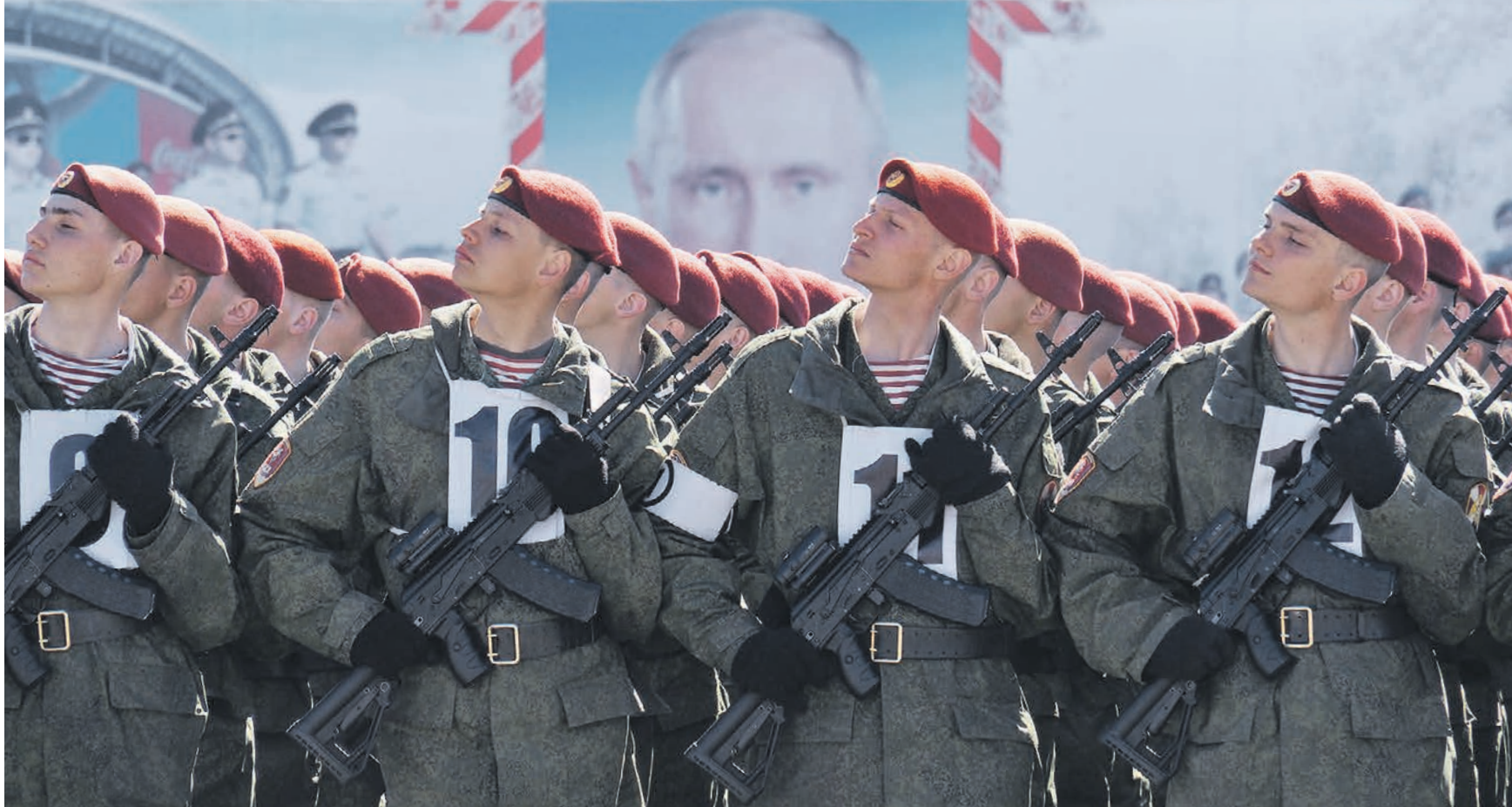
Вчера в 11:05 Военнослужащие Отдельной дивизии оперативного назначения имени Дзержинского войск национальной гвардии РФ держат ровный строй во время открытой тренировки к предстоящему параду Победы