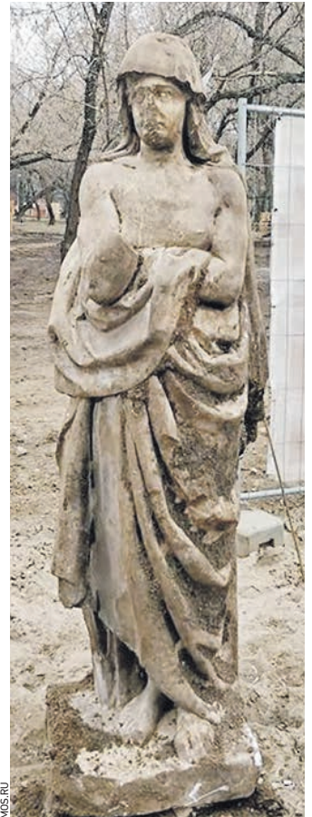
10 апреля 2019 года. Скульптура, которую обнаружили в усадьбе Люблино

В усадьбе «Люблино» во время работ по благоустройству и озеленению рабочие нашли скульптуру XVIII века. В чем заключается уникальность этой находки, «ВМ» рассказал московский историк.