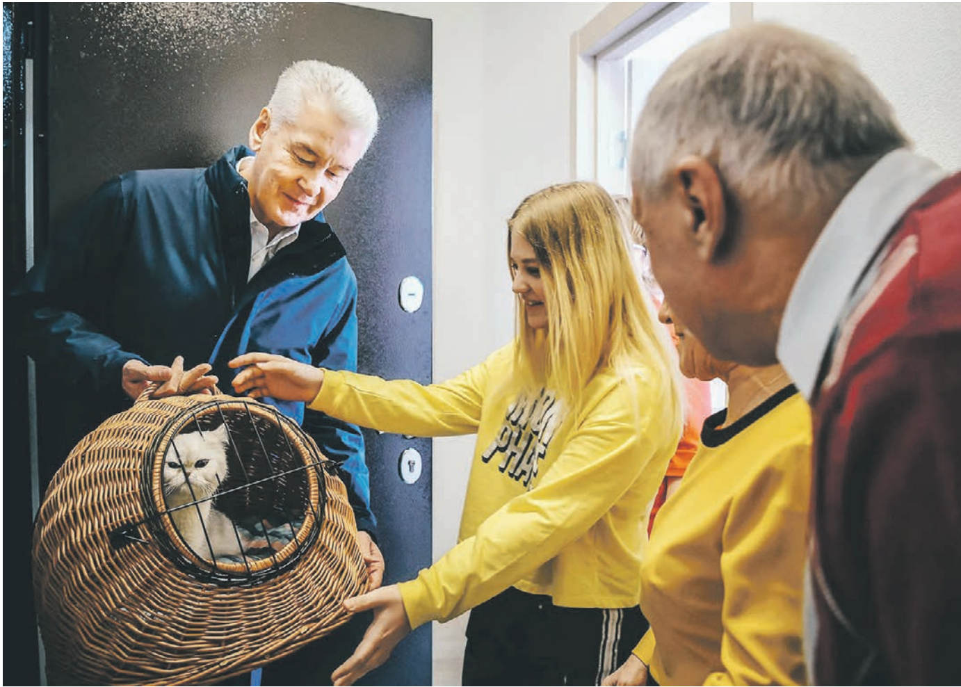
14 марта 2019 года. Мэр Москвы Сергей Собянин (слева) вручает в качестве подарка символ семейного уюта, кот, жителям нового дома, построенного по программе реновации на Щелковском шоссе, 90. Здание оснащено самыми современными системами отопления

Заместитель мэра Москвы по вопросам жилищно-коммунального хозяйства Петр Бирюков отметил, что минувшая зима в Москве выдалась не столь снежной и холодной, как в предыдущие годы. Объем выпавшего снега составил 183 сантиметра, что в среднем на 70 сантиметров ниже, чем в предыдущие годы. Замэр подчеркнул: в мегаполисе не произошло ни одной аварии, приведшей к длительному отключению электричества, тепла, газа или воды. — В энергетической системе города имеется достаточный запас мощности. Резервное топливо на городских теплоэлектростанциях не использовалось, — заявил он. По словам Бирюкова, зимой с улиц и дворов было вывезено и утилизировано 29,2 миллиона кубометров снега. Качественная уборка улиц поспособствовала сокращению числа дорожных аварий — более чем на сто ДТП за сезон.