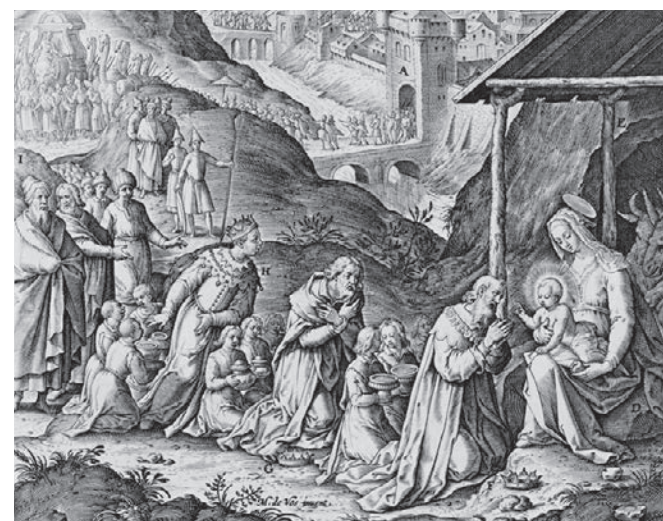
Гравюра из первого издания «Евангелие Иеронима Наталиса»

В Музее Андрея Рублева вчера состоялась предпоследняя выставка «Евангелие Иеронима Наталиса. Первое издание», официальное открытие которой состоится завтра, 18 апреля.