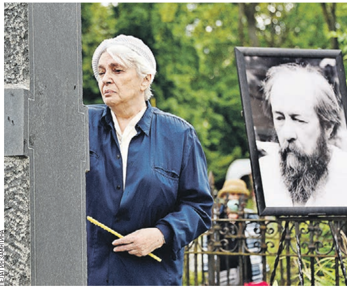
Вчера 13:41 Вдова писателя Наталия Солженицына у мраморного креста на могиле мужа

Понимаешь, как много он предвидел, как часто им написанное сбывается в жизни. Он мог предугадать судьбу нашей страны на много лет вперед. После панихиды возложили цветы к мраморному кресту на могиле писателя. В мгновение букетами заполнились практически все вазы, подготовленные к мероприятию. Память о великом классике не просто живет — крепнет. — Мне очень тепло на душе от того, сколько людей приходит сюда, — поделилась с «ВМ» вдова писателя Наталия Солженицына. — Когда мне принесли книгу Александра Исаевича, я так и пишу: «Спасибо за верность его памяти». Для меня это очень дорого. Просто так ведь на панихиду люди не приходят. Значит, что-то сюда их тянет. Имя Солженицына гремит все время. Каждый день мне приходит от 30 до 50 ссылок с материалами, в которых упоминается Александр Исаевич. Это говорит о многом. Собравшиеся не спешили расходиться. Им еще было о чем поговорить и чем друг с другом поделиться. Они нашли общую тему: Солженицын и его огромный вклад в литературу и историю нашей страны.