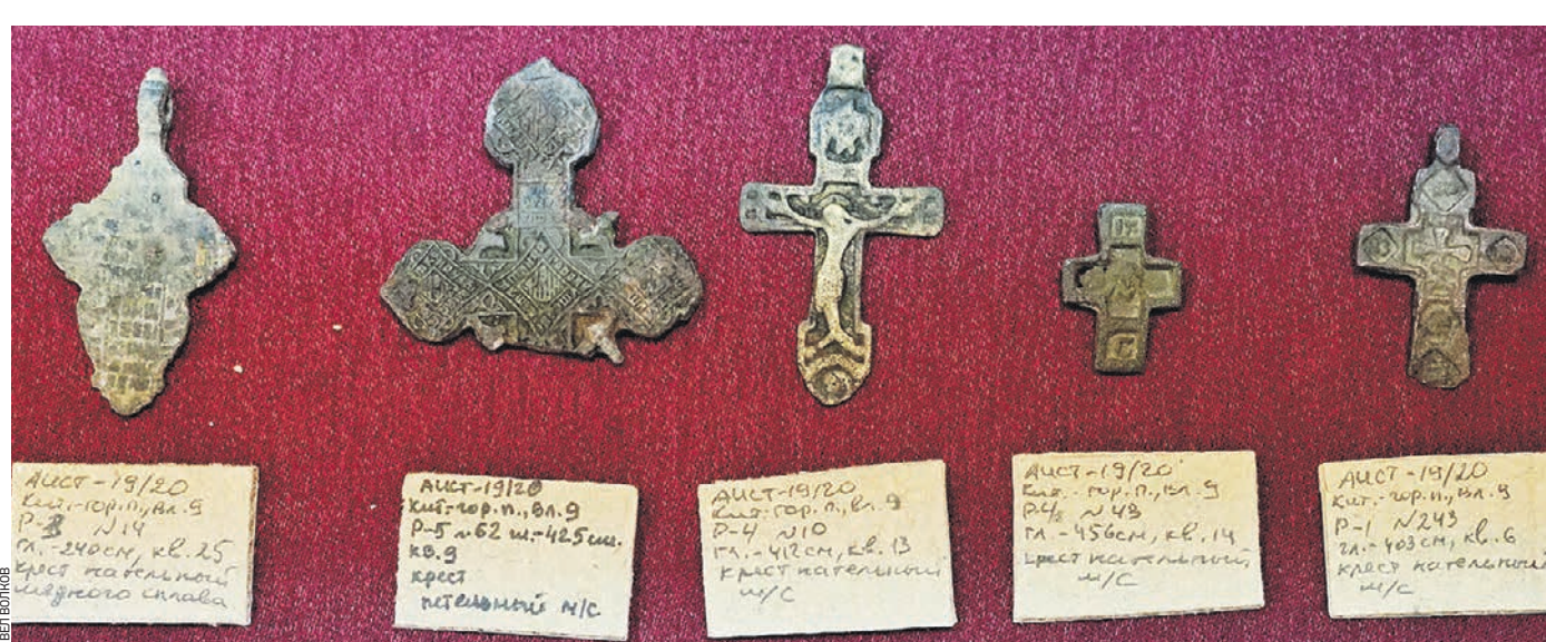
Вчера 14:14 Нательные кресты XVI–XIX веков, которые были найдены археологами на территории Воспитательного дома в Москве

Литой крестовидный амулет обнаружен во время археологических работ на территории старинного Императорского воспитательного дома возле Москворецкой набережной. Оберег стал одним из редчайших артефактов, найденных за последнее время в столице. О новых находках «ВМ» рассказали вчера в компании «Археологические изыскания в строительстве».