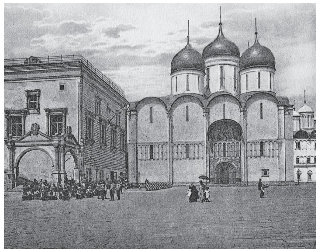
1908 год. Фототипия. Успенский собор Московского Кремля, где венчались на царство российские самодержцы

Аристотель Фиораванти был довольно известной личностью в разных городах Италии. Поэтому, очевидно, когда русское посольство Семена Толбузина оказалось в Италии для поиска мастеров, сведущие люди посоветовали обратиться внимание на Фиораванти с полным на то основанием: он был известен тем, что получал строительные подряды и в большинстве случаев справлялся с ними.