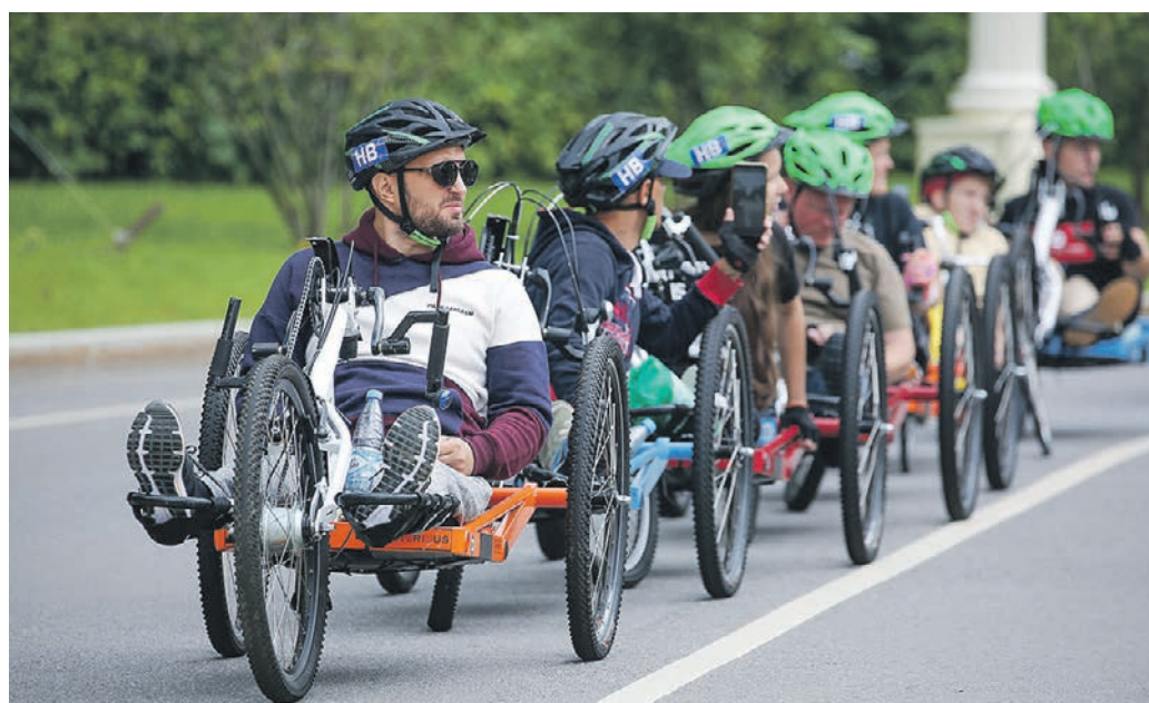
1 августа 15:44 В столице создают условия для полноценной жизни людей с ограничениями по здоровью. Маломобильные москвичи приняли участие в хендбайк-параде на ВДНХ

Первые тренировочные квартиры появились на базе городского научно-практического центра по защите прав детей «Детство» в 2018 году. С тех пор обучение и реабилитацию в них прошли 576 человек. По новому проекту курс реабилитации, рассчитанный на 19 дней, смогут пройти 216 жителей столицы с такими психо-