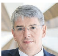
АЛЕКСЕЙ ФУРСИН РУКОВОДИТЕЛЬ ДЕПАРТАМЕНТА ПРЕДПРИНИМАТЕЛЬСТВА И ИННОВАЦИОННОГО РАЗВИТИЯ МОСКВЫ

Сложная макроэкономическая ситуация не могла не сказаться на столичном экспорте услуг. Его объем в первом квартале 2020 года составил более 6,4 миллиарда долларов США, но это на 5,4 процента меньше, чем в аналогичный период прошлого года. В наибольшей степени пострадал экспорт поездок — падение объемов составило 23,5 процента. В свою очередь, правительство Москвы всесторонне поддерживает экспорт столичных предпринимателей. Так, с марта этого года получить субсидии на компенсацию издержек, связанных с ведением экспортной деятельности, теперь могут не только производители товаров, но и поставщики услуг. Наибольшей популярностью среди поставщиков услуг пользуются экспортные гранты. Так, например, грант на сумму свыше 1,2 миллиона рублей получила компания, работающая в туристической сфере. Более четырех миллионов рублей выдано поставщику ИТ-услуг. Кроме того, более двух миллионов рублей мы направили предприятию, ведущему деятельность в сфере культуры и отдыха. Свыше 340 тысяч рублей выдано поставщику строительных услуг. В ближайшее время грант в размере более 2,6 миллиона рублей получит компания, осуществляющая деятельность в сфере финансовых услуг. Всего к этому моменту выплаты из бюджета города на общую сумму 277,46 миллиона рублей выделены для 120 экспортно ориентированных компаний. Мы очень надеемся, что эти меры поддержки будут способствовать восстановлению экономики и увеличению объемов экспорта столичных компаний.