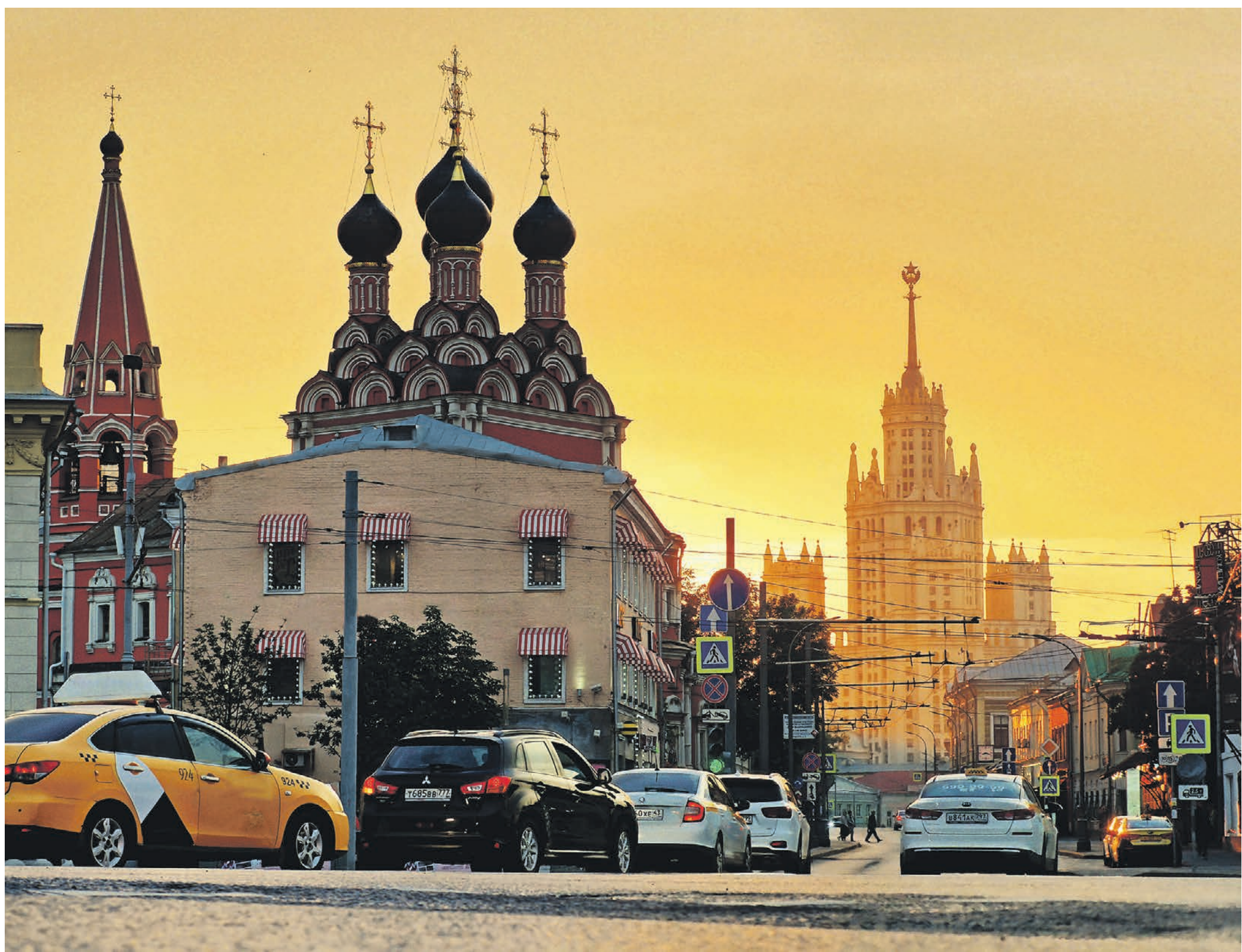
4 августа. Таганская площадь раньше была самым известным торговым местом Москвы