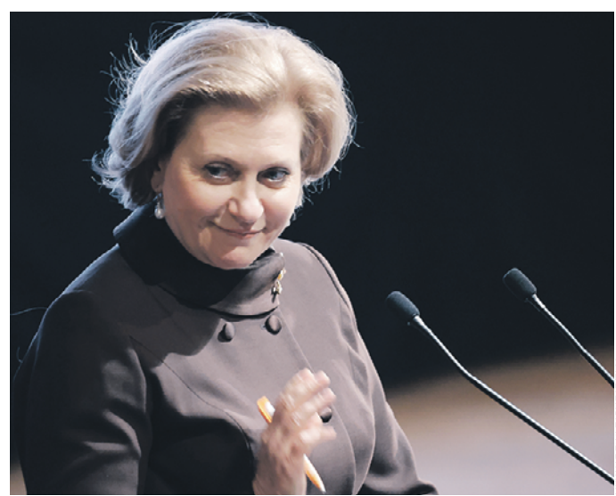
Вчера 11:10 Глава Роспотребнадзора Анна Попова рассказала о тест-системе, выявляющей штамм «омикрон»

Вчера в столице открылось общее собрание членов Российской академии наук. В течение двух дней врачи и ученые обсудят профилактику, лечение коронавируса, его влияние на организм, а также вопросы создания новых лекарств.