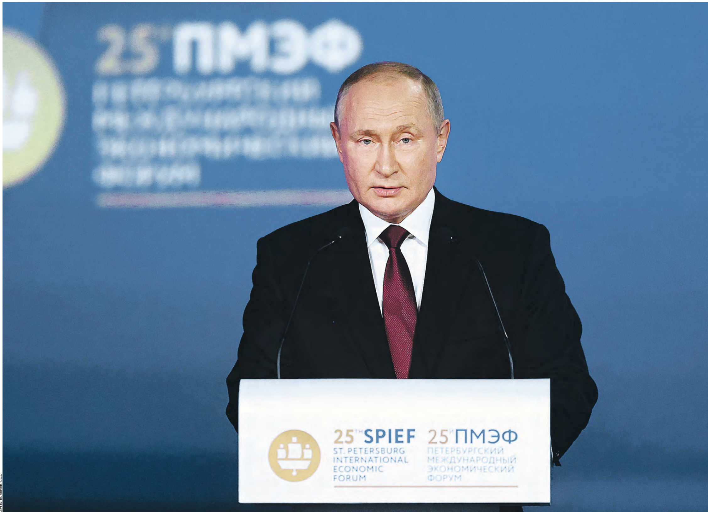
17 июня 15:46 Президент России Владимир Путин во время выступления на пленарном заседании XXV Петербургского международного экономического форума

Президент России Владимир Путин: Мы справимся с любыми вызовами