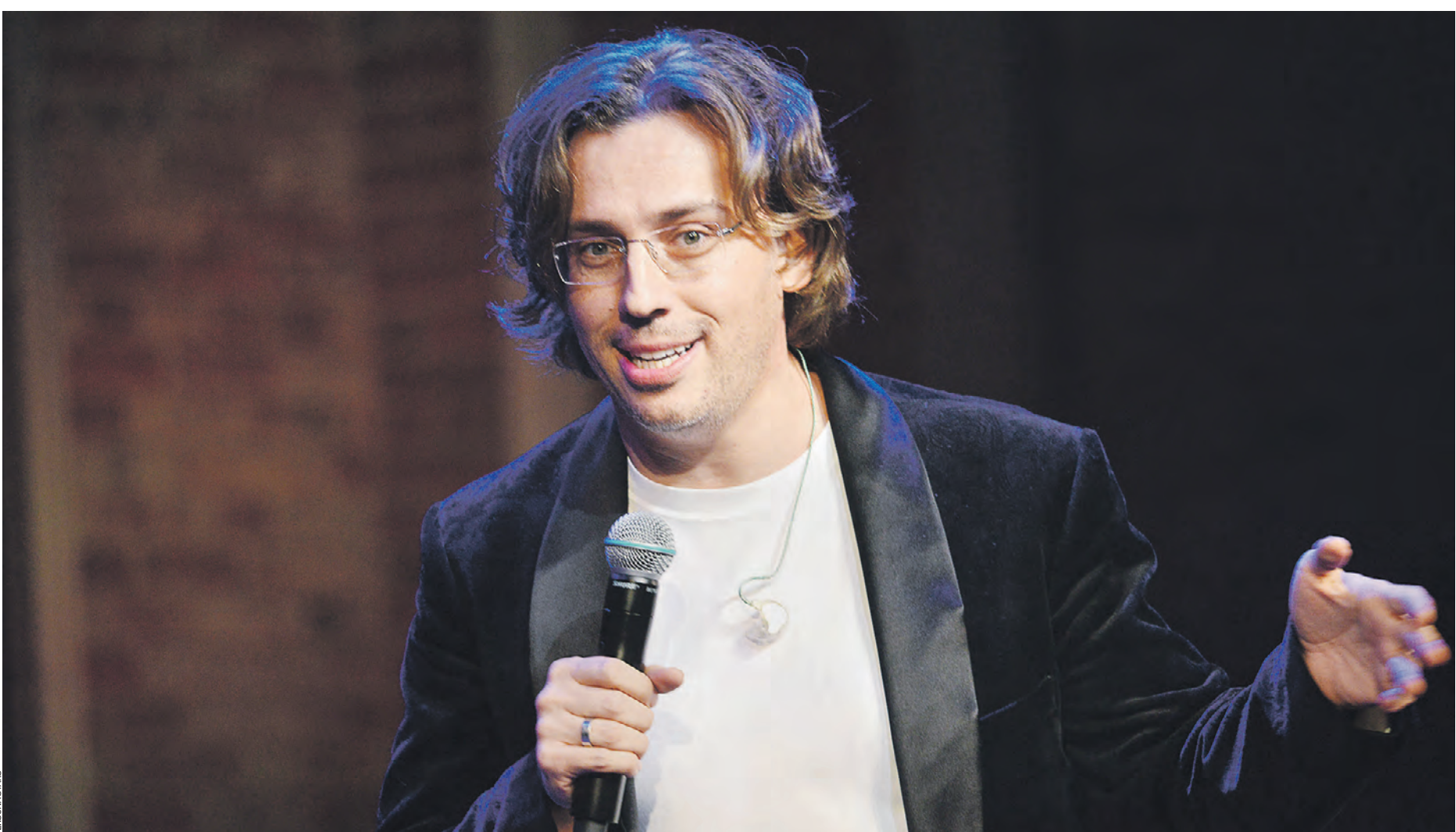
22 декабря 2019 года. Комик Максим Галкин в Доме актера имени А. Яблочниковой в Москве. Артист регулярно выступал на российских гостелеканалах, прилично там зарабатывал. У него было роскошное жилье, его любили зрители. И вдруг он одним из первых выступил против спецоперации. Почему? Сегодня это не самый актуальный вопрос. Он встанет завтра