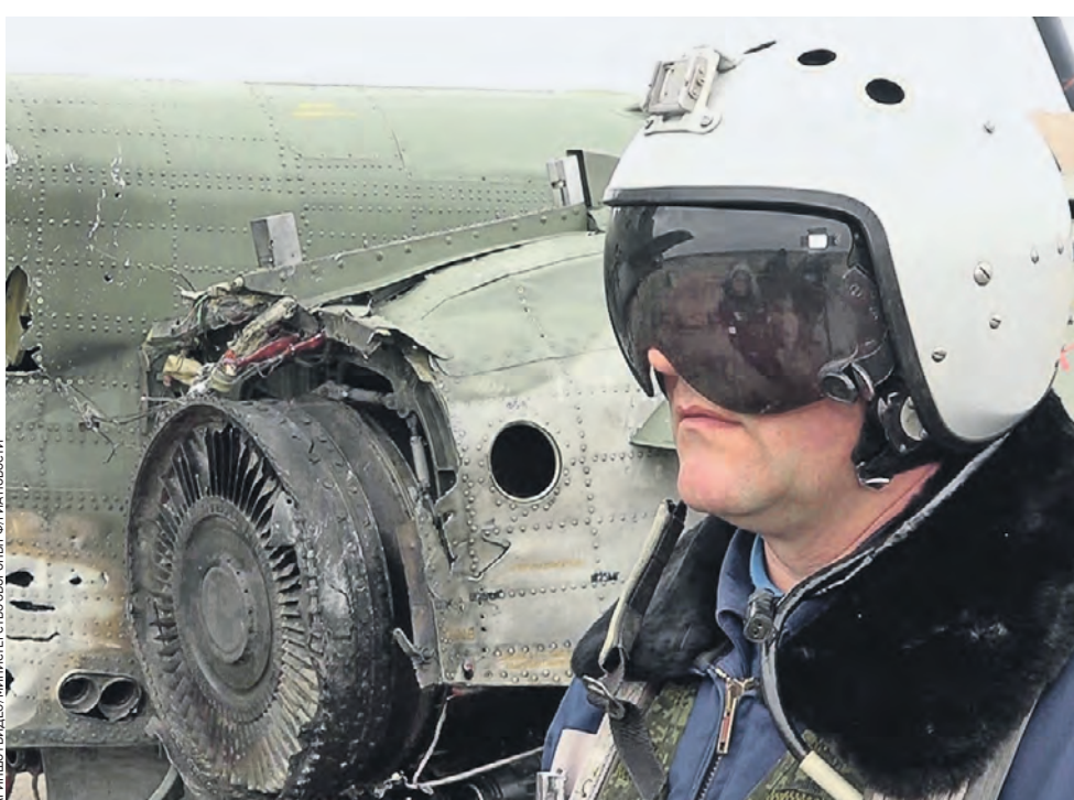
Вчера 09:02 Летчик ведущего самолета подполковник Денис Литвинов прикрыл своим самолетом штурмовик товарища Су-25, в который попала ракета, выпущенная с земли украинскими военными. Летчики сумели посадить подбитый самолет на аэродром базирования. Оба героя представлены к государственным наградам.