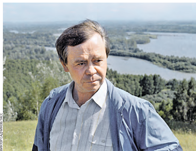
23 июля 1987 года. Иркутская область. Писатель Валентин Распутин

В интернете о нем сказано скупо и сухо: один из наиболее значительных представителей «деревенской прозы». «Отгораживающий русскую душу и наши сердца» — так о Распутине скажет каждый — вчера, сегодня и наверняка завтра прочтя написанные им повести и рассказы: о любви к отчему дому, чести, человеческом достоинстве и нашей генетической памяти. Она по Распутину — в правде, без которой нет жизни. Сермяжная истина, без прикрас и громких заявлений: «Четыре подпорки у человека в жизни: дом с семьей, работа, люди, с кем вместе править праздники и будни, и земля, на которой стоит твой дом. И все четыре — одна важнее другой», — стро-