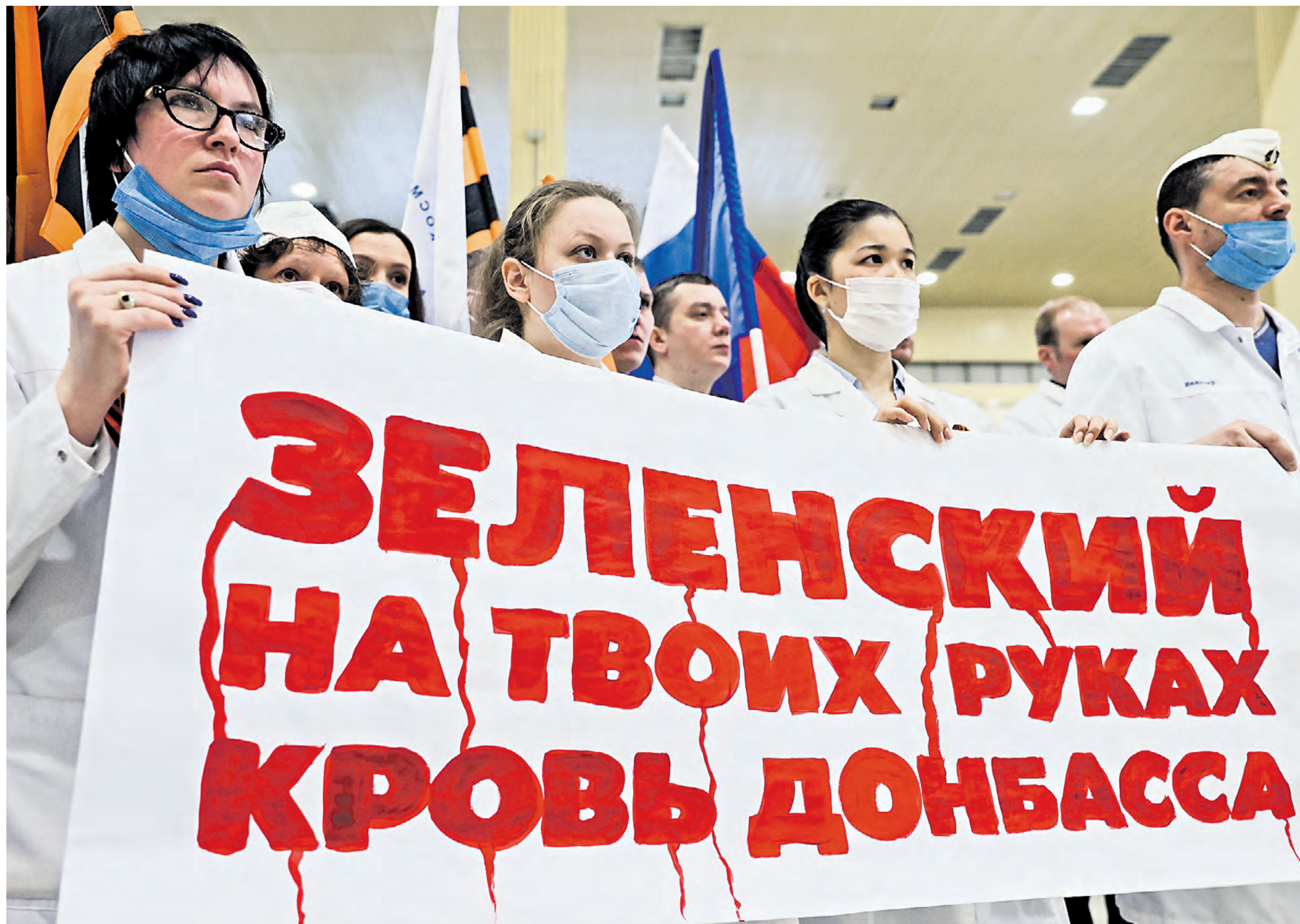
10 марта 2022 года. Сотрудники предприятия во время акции «За Мир! В поддержку Президента» в Государственном космическом научно-производственном центре им. Хруничева

Как обрести баланс в непростых условиях текущего момента