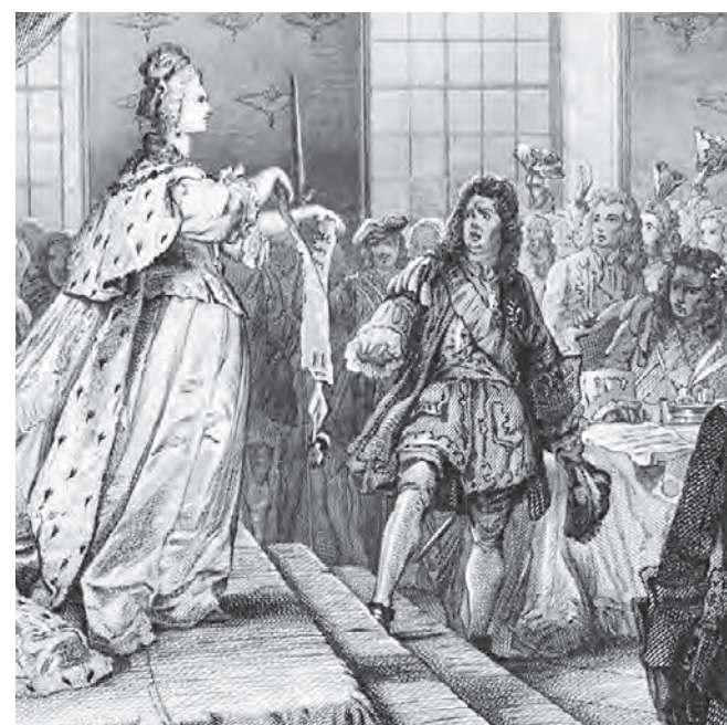
Фрагмент картины «Императрица Анна Иоанновна разряжает «ондиции» в 1730 году в Москве», художник Иосиф Шарлемань

«Вечерняя Москва» продолжает рассказывать о важных исторических событиях дня.