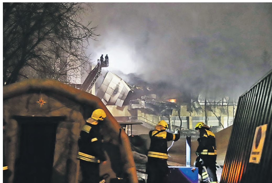
20 февраля. Сотрудники столичного ГУ МЧС тушат пожар в административном здании на Варшавском шоссе в Москве.

и Ми-26, — сообщили в Центре управления кризисными ситуациями Главного управления МЧС по Москве.