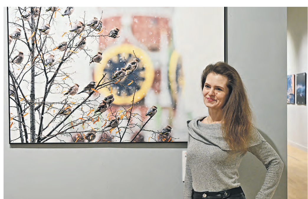
20 февраля. Фотограф Мария Беляева рассказывает про свою работу «Гости столицы сверяют часы».

Вчера в здании Новой Третьяковки открылся 12-й Общероссийский фестиваль природы «Первозданная Россия». «ВМ» побеседовала с фотографами, участвующими в проекте.