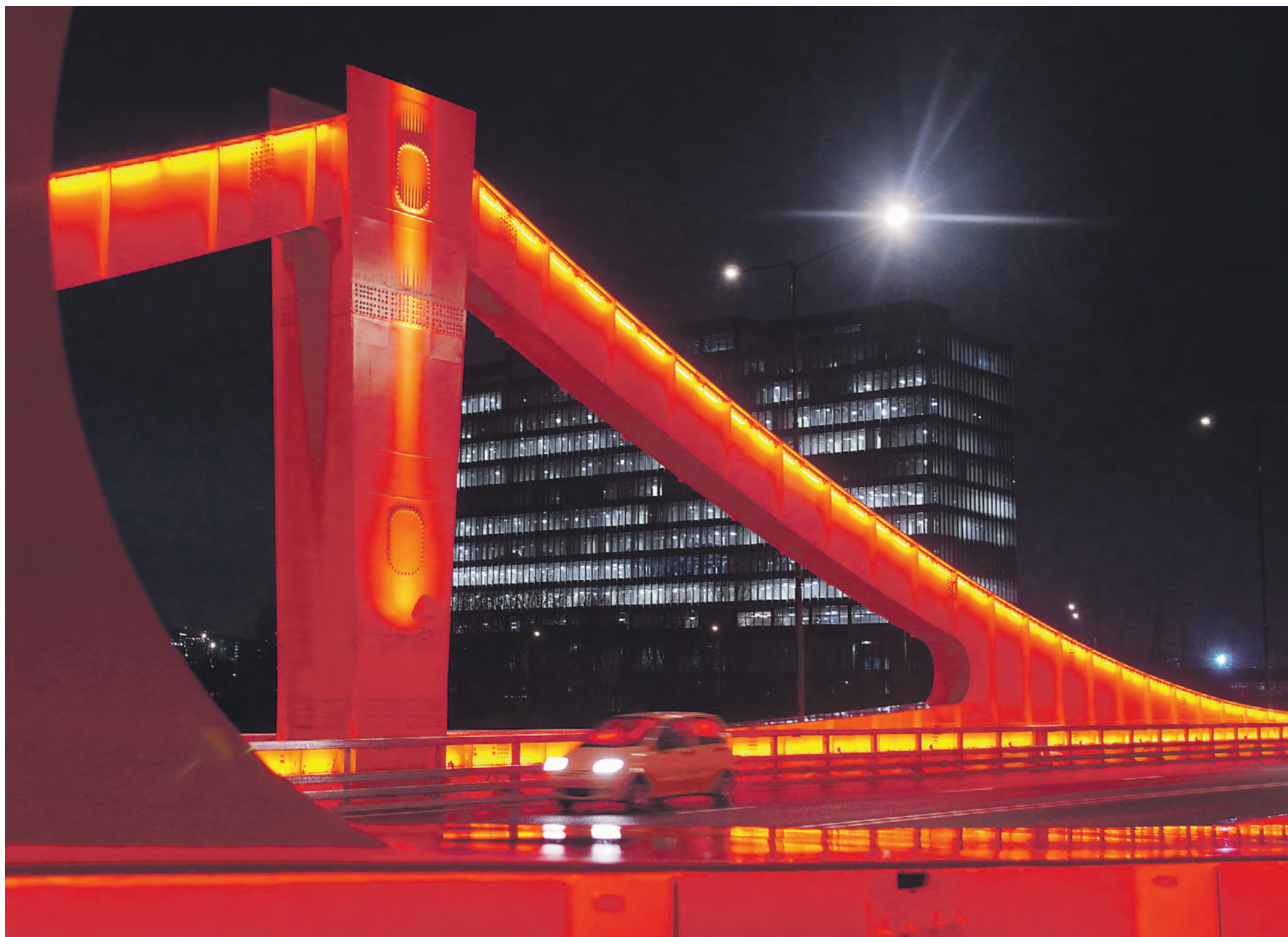
Новые мосты не только улучшают дорожно-транспортную инфраструктуру столицы, но и становятся настоящим украшением города. Один из них — открытый в конце 2024 года автомобильно-пешеходный мост, соединивший районы Филевский Парк и Хорошево-Мневники. По вечерам он отлично выполняет и декоративную функцию.