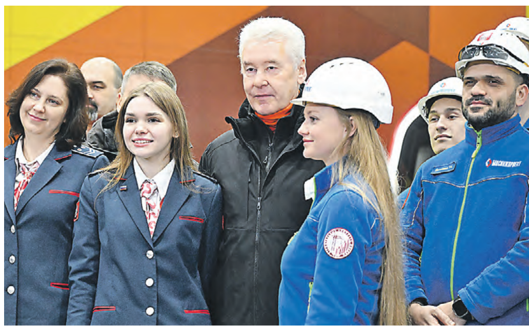
28 декабря 2024 года. Мэр Москвы Сергей Собянин (в центре) со строителями и сотрудниками метро во время церемонии открытия новых станций Троицкой линии

Сергей Собянин утвердил перечень ключевых объектов строительства на 2025–2026 годы. В их числе: северный участок Троицкой линии метро от «Новаторской» до «ЗИЛа», многопрофильный комплекс Детской городской клинической больницы святого Владимира в Сокольниках, Центральный московский ипподром на Беговой улице. В списке также Национальный космический центр на территории Филевской поймы и новые корпуса Мо-