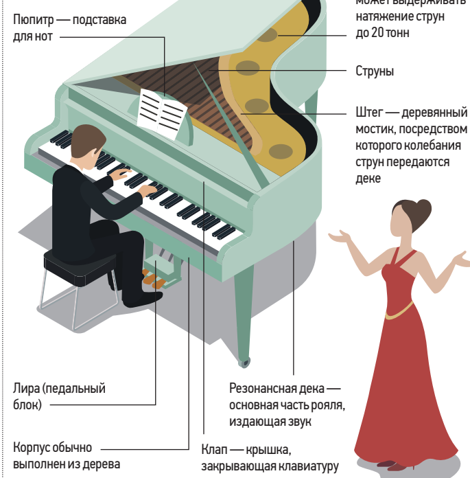
По данным royal.info

Что вдохновляет музыканта на творчество → стр. 2