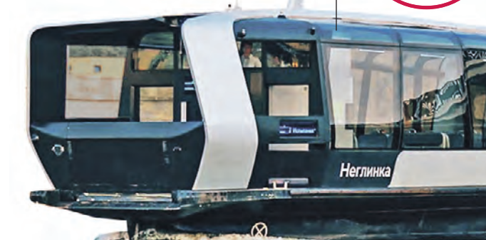
По данным mos.ru