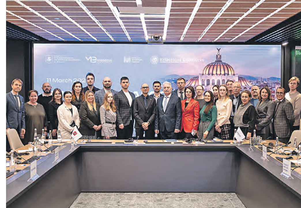
11 марта. Представители предпринимательского сообщества Москвы в сфере фармацевтики и медицинского оборудования во время бизнес-встречи с сотрудниками посольства Мексики в РФ