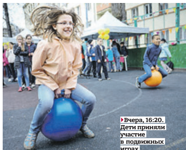
► Вчера, 16:20. Дети приняли участие в подвижных играх