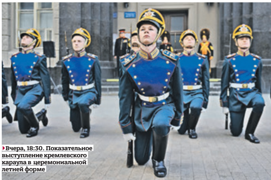
►Вчера, 18:30. Показательное выступление кремлевского караула в церемониальной летней форме