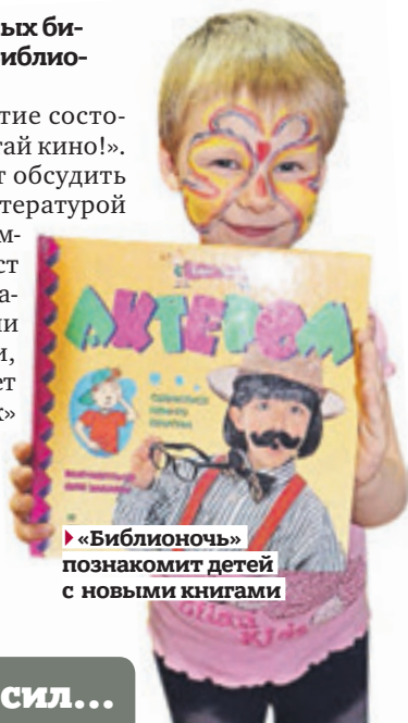
► «Библионочь» познакомит детей с новыми книгами

В этом году мероприятие состоится под лозунгом «Читай кино!». Участникам предстоит обсудить взаимосвязи между литературой и кинематографом, вспомнить случаи, когда текст становится фильмом и наоборот. Вас ждут встречи с кинематографистами, которые раскроют секрет «движущихся картинок» и помогут понять, как устроено это искусство. Библиотеки, книжные магазины будут работать до глубокой ночи. 23 апреля, 17:00–00:00