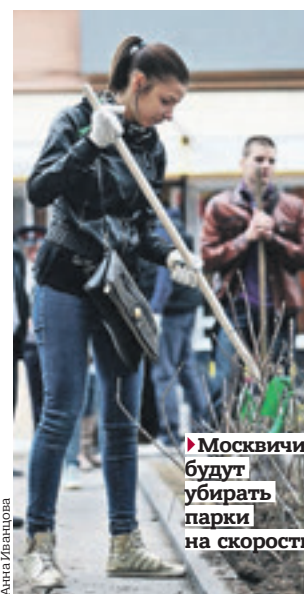
► Москвичи будут убирать парки на скорость

■ «Чеховская» Ул. Каретный Ряд, 3 Сад «Эрмитаж» 23 апреля, 10:00–19:00