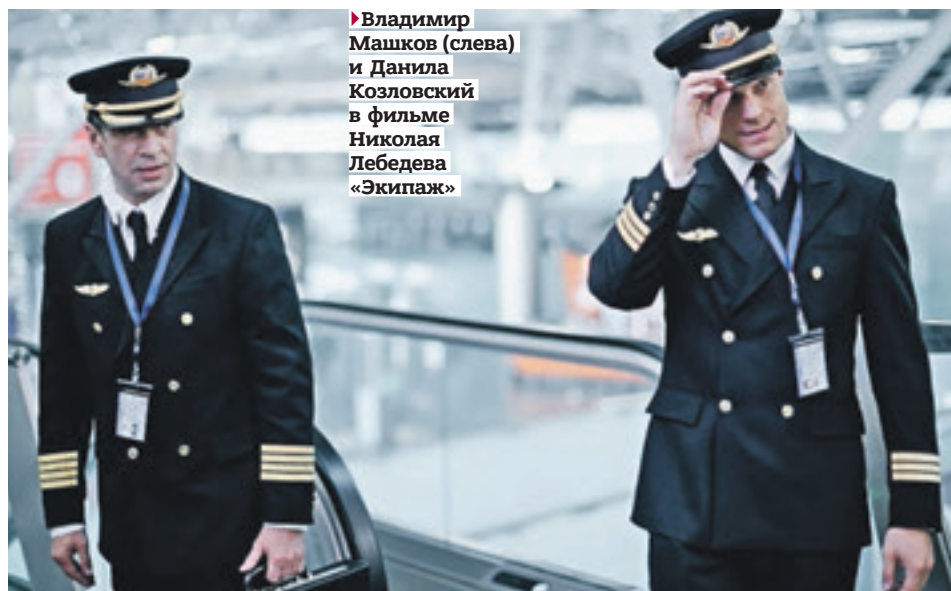
► Владимир Машков (слева) и Данила Козловский в фильме Николая Лебедева «Экипаж»