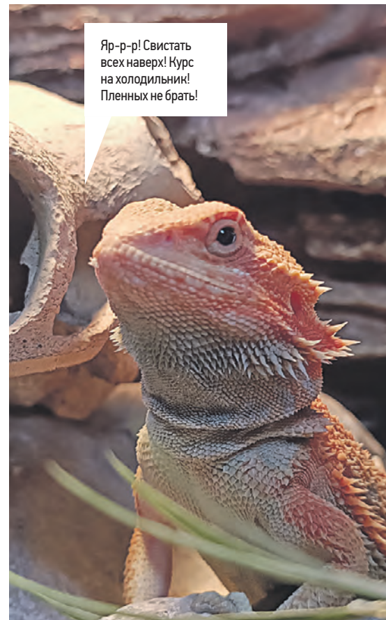
Яр-р-р! Свистать всех наверх! Курс на холодильник! Пленных не брать!