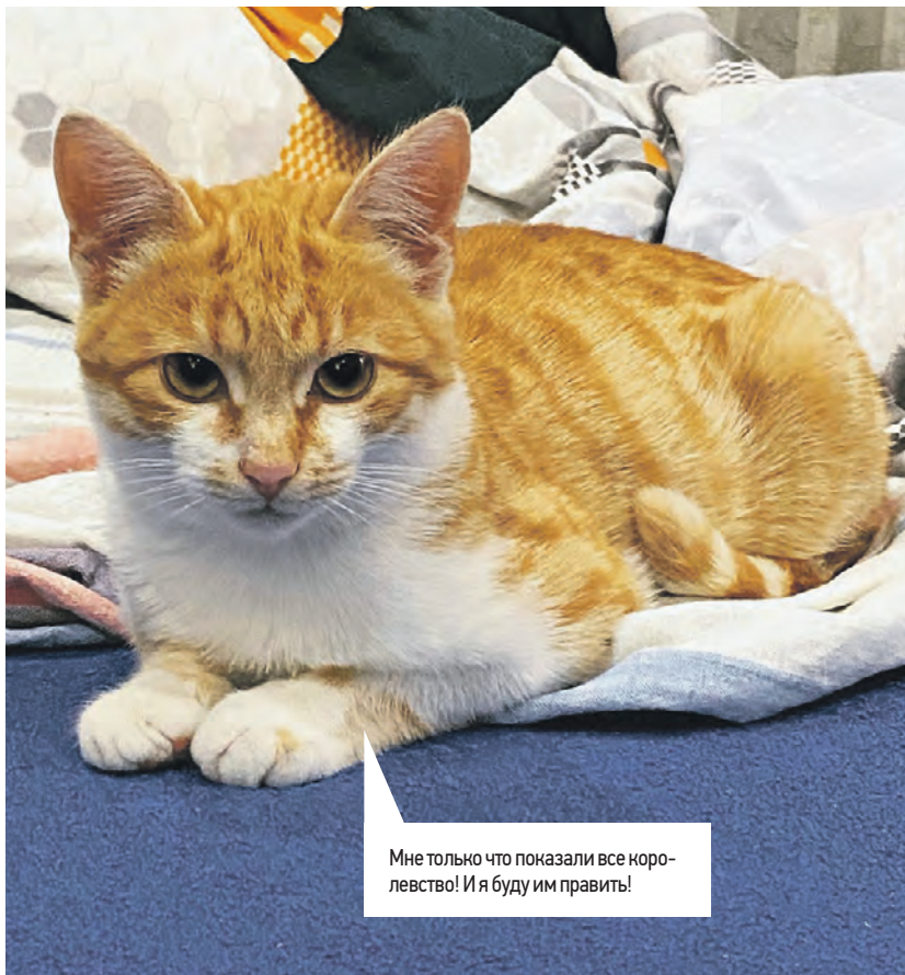
Мне только что показали все королевство! И я буду им править!