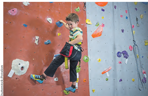
В новом скалолазном центре в Головинском смогут заниматься как взрослые, так и дети

Капитальный ремонт жилого дома завершили в Лефортове. Старинная постройка располагается по адресу: шоссе Энтузиастов, д. 20б. Здание возведено в 1930 году в стиле конструктивизма. Специалисты привели в порядок его фасад и подъезды, проложили новую электросеть. При этом главной задачей специалистов было сохранение исторического облика дома.