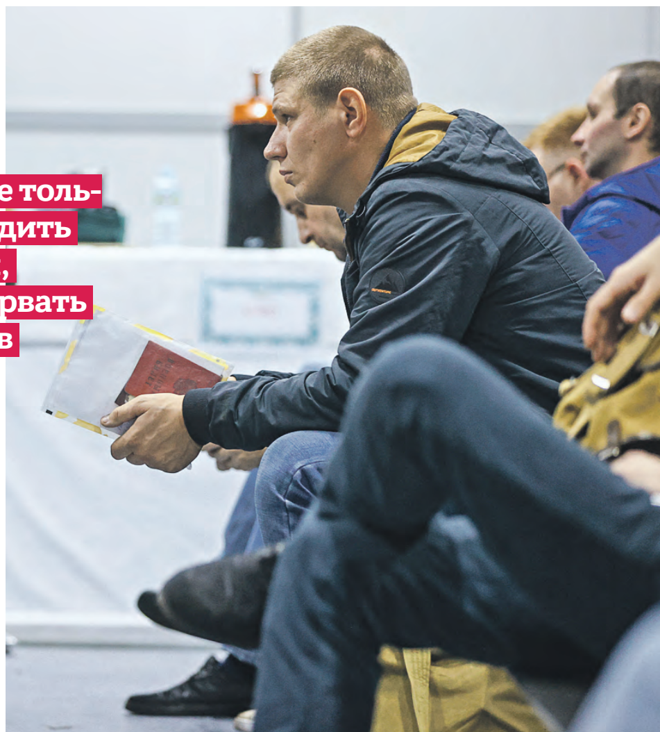
27 сентября 2022 года. Мобилизационный центр при Музее Москвы. Жители столицы не пытаются уклониться от призыва и добровольно отправляются защищать Родину

Мошенники предлагают «откосить» от армии за кругленькую сумму