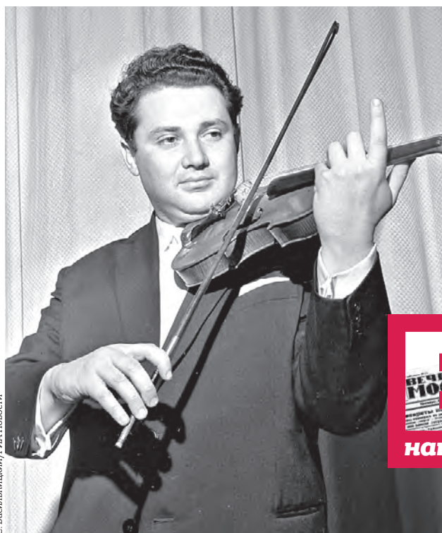
1962 год. Скрипач Эдуард Грач выступает на музыкальном вечере в Доме дружбы народов

Далее сообщались подробности о конкурсах скрипачей и виолончелистов, которых принимали практически все страны Европы.