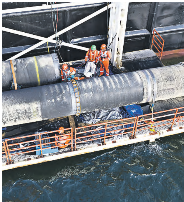
Специалисты проводят надводную сварку захлестного стыка газопровода «Северный поток — 2»