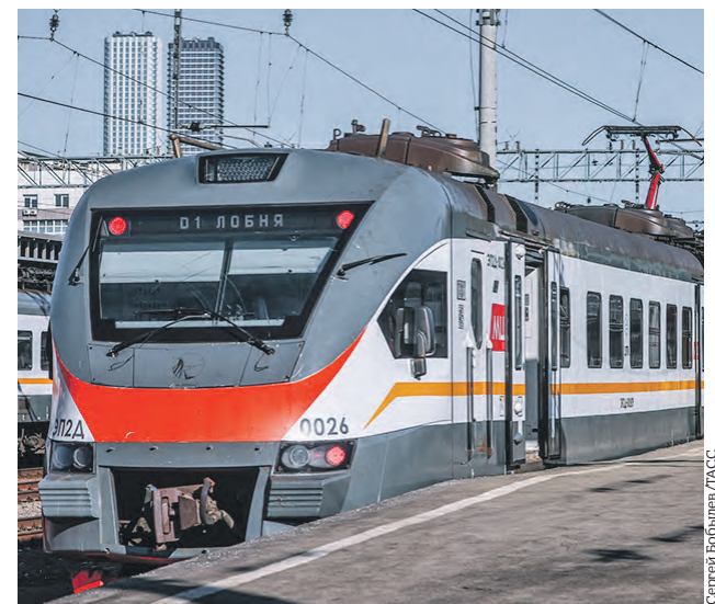
Электричка у платформы Савеловского железнодорожного вокзала